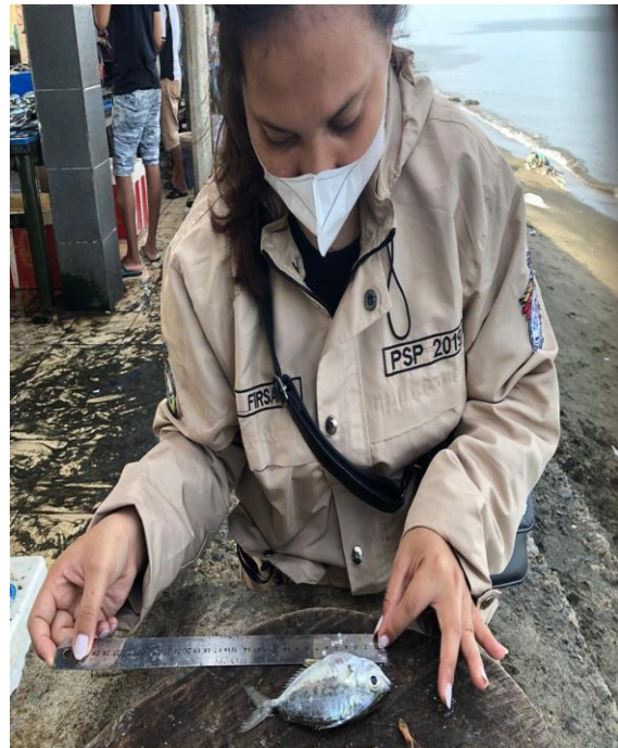
Gambar 16. Pengukuran sampel ikan peperek ( Leiognathus equulus ) di PPI Sumpang Binagae Kab. Barru.