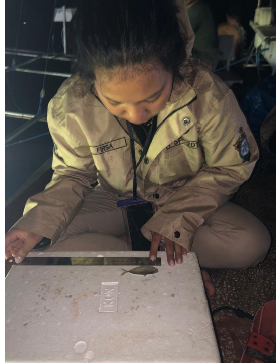
Gambar 15. Pengukuran sampel ikan peperek ( Leiognathus equulus ) diatas kapal.