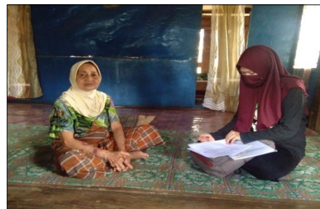
Gambar 4. Wawancara Responden di Wilayah Kerja Puskesmas Aska