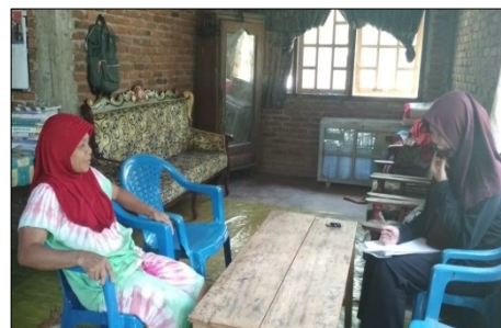
Gambar 6. Wawancara Responden di Wilayah Kerja Puskesmas Samaenre