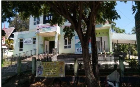
Gambar 1. Puskesmas Aska