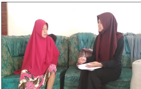
Gambar 3. Wawancara Responden di Wilayah Kerja Puskesmas Aska