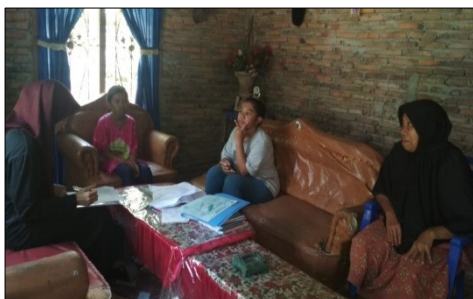
Gambar 5. Wawancara Responden di Wilayah Kerja Puskesmas Samaenre