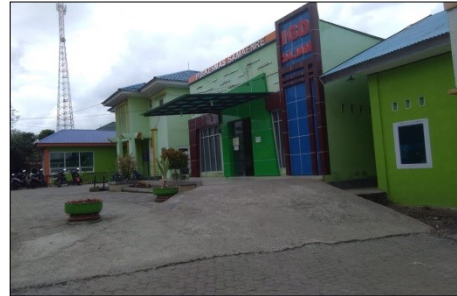
Gambar 2. Puskesmas Samaenre