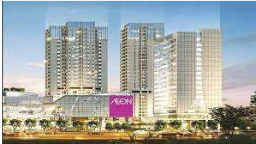
Gambar 2 Southgate Apartment, Jakarta Selatan