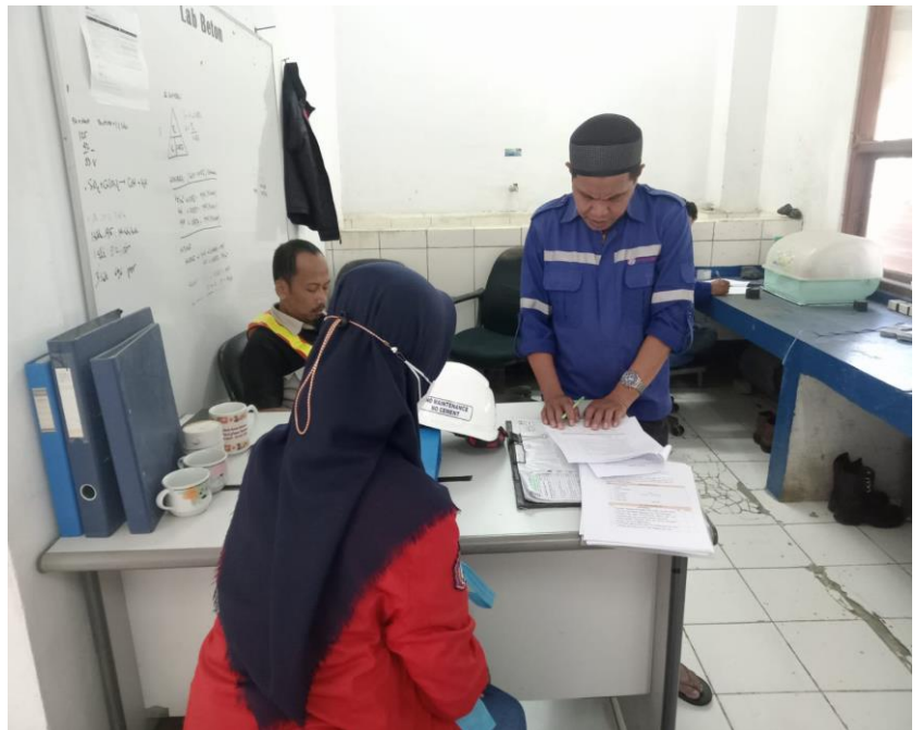
Gambar 3. Penyebaran kuesioner