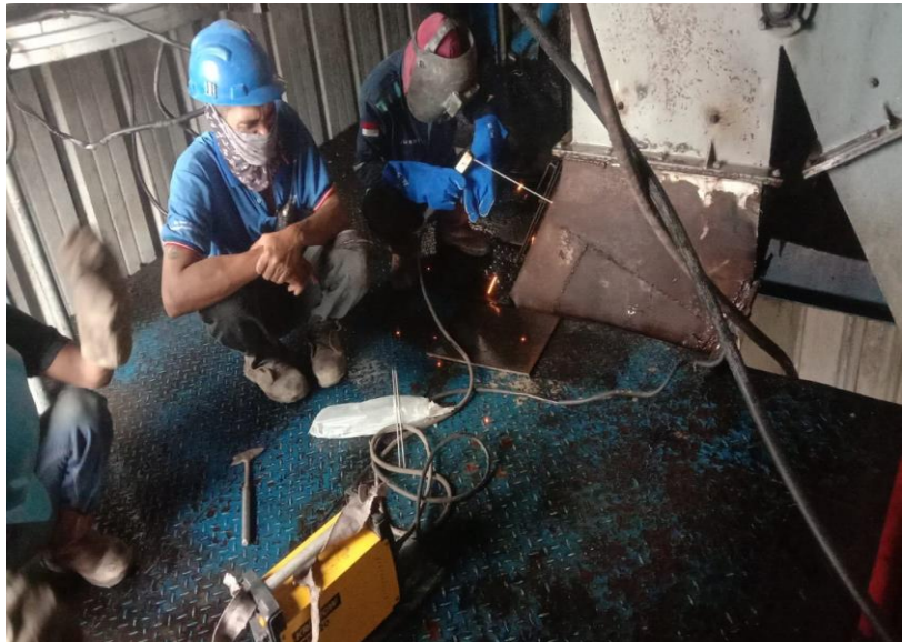
Gambar 2. Kondisi area dalam produksi