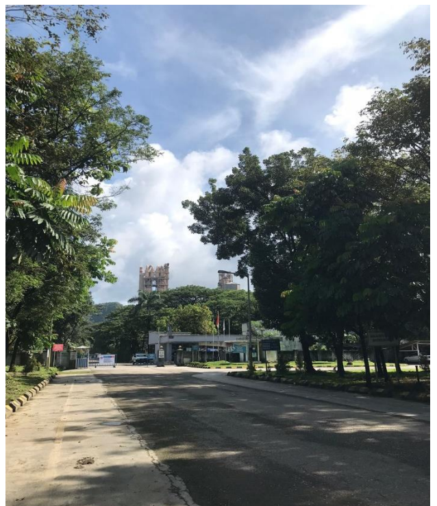
Gambar 1. Kondisi lingkungan halaman kerja