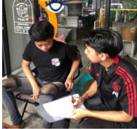
GAMBAR 7. 1 WAWANCARA BERSAMA INFORMAN SK