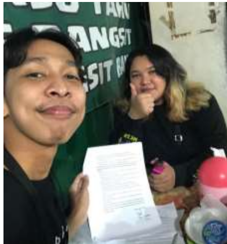
GAMBAR 7. 8 WAWANCARA BERSAMA INFORMAN PR