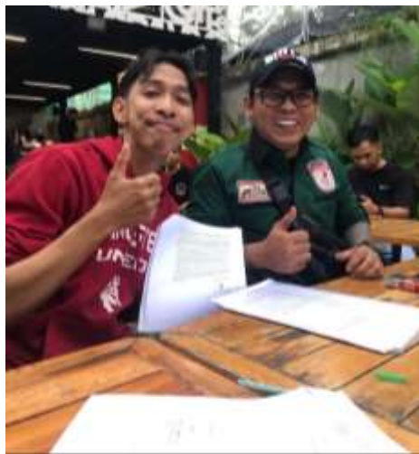
GAMBAR 7. 5 WAWANCARA BERSAMA INFORMAN AI