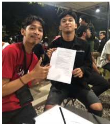
GAMBAR 7. 2 WAWANCARA BERSAMA INFORMAN FZ