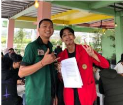
GAMBAR 7. 4 WAWANCARA BERSAMA INFORMAN IR