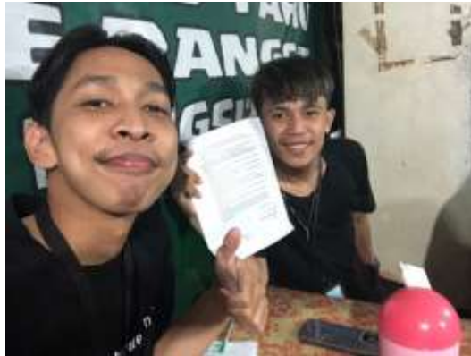
GAMBAR 7. 7 WAWANCARA BERSAMA INFORMAN HS