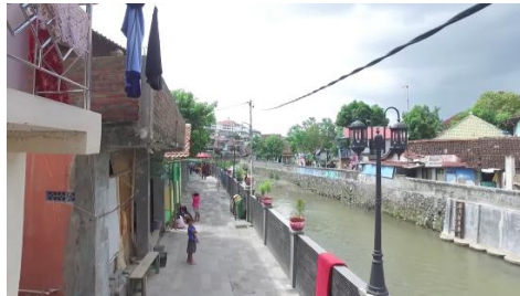
Gambar 2. 6 Pembanguna rumah darurat menjadi rumah permanen 2 lantai

Hal yang patut dikagumi dari gotong-royong warganya adalah kesediaan warga Suryatmajan melakukan konsep pembangunan “Mundur, Munggah, Madhep Kali” di sepanjang bantaran Kali Code. Konsep ini dilakukan dengan “memundurkan” (memapas) bangunan rumahnya selebar 2 sampai 3 meter, “menaikkan” rumah menjadi multilantai, lalu menghadapkan pintu utama ke arah kali.