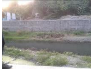
Gambar 2. 1 Pembuat talut dan penghijauan pada tepi sungai

pertama dari pengurangan dampak banjir adalah pembuatan talut di pinggir sungai dan penghijauan atau penanaman tumbuhan-tumbuhan penutup lahan yang akan menjadi frontliner terhadap aliran banjir sebelum sampai ke permukiman. Fungsinya menyerap air, sebagai filter material vulkanik yang dibawa oleh arus sungai.