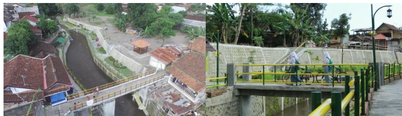
Gambar 2. 9 Jembatan Penghubung antara Kelurahan di Karangwaru

Pemilihan skala prioritas penanganan kawasan Sungai Buntung ini tepat karena di kawasan inilah semua permasalahan permukiman ada, mulai dari kemiskinan, kesehatan, sanitasi, dan kumuh miskin. Hal tersebut ditandai dengan banyaknya kebiasaan buruk warga sekitar yang membuang sampah, limbah rumah tangga dan limbah manusia (sampah, limbah dapur, deterjen) di sungai. Jika tidak segera ditata akan muncul permasalahan-permasalahan baru lainnya di masa mendatang.