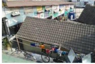
Gambar 2. 3 Atap bangunan dengan material genteng dan asbes

Sebuah bangunan yang tidak permanen dengan konstruksi kayu difungsikan sebagai ruang serbaguna dinamakan Paseban. Bangunan ini berbentuk rumah panggung dan terbuka tanpa pintu dan dinding tidak masif. Bangunan ini menggunakan material kayu sebagai material struktur utama, sedangkan bambu sebagai kolom praktis. Dindingnya terbuat dari gedheg (anyaman bambu) yang dicat warna-warni. Bangunan ini berfungsi untuk melaksanakan kegiatan-kegiatan sosial seperti arisan, tempat bermain anak, pertemuan warga, dan rapat-rapat.