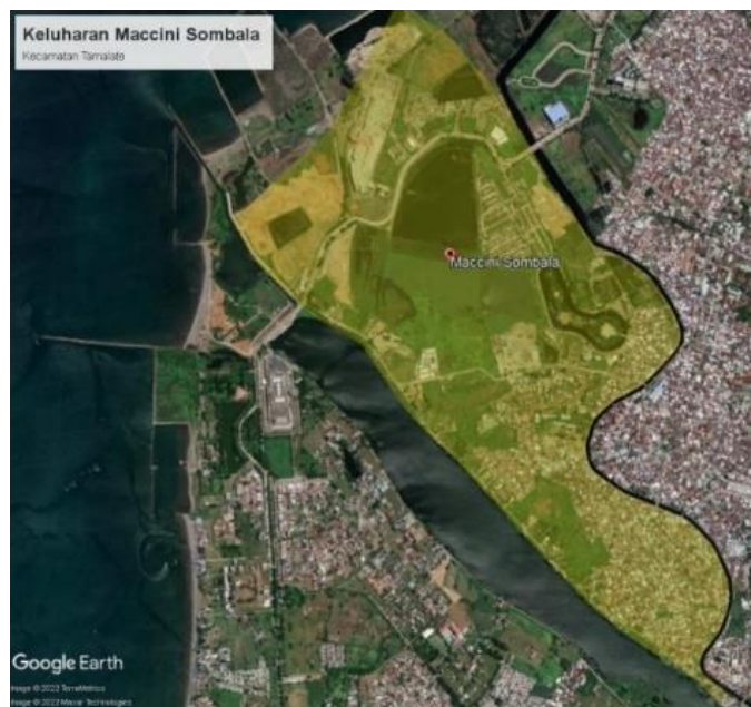
Gambar 1. 1 Kelurahan Maccini Sombala

diterima hanya mampu untuk memenuhi kebutuhan pangan sehari-hari, membuat sebagian warganya yang bermukim di bangunan semi-permanen hingga darurat, tidak mampu untuk membenahi maupun mengatasi ancaman-ancaman yang mempengaruhi tempat tinggalnya. Ketersediaan sarana dan prasarana lingkungan di permukiman tersebutpun kurang maksimal, baik untuk memenuhi kebutuhan rumah tangga maupun untuk kebutuhan sosial-ekonomi seperti tidak tersedianya lahan parkir, ruang terbuka publik, jalan, drainase, air bersih dan pengelolaan sampah. Pola permukimannya tumbuh secara tidak teratur, terkesan padat yang mengakibatkan kualitas lingkungannya menjadi non-humanis.