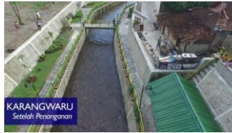
Gambar 2. 8 Balai pantau banjir

Pemilihan skala prioritas penanganan kawasan Sungai Buntung ini tepat karena di kawasan inilah semua permasalahan permukiman ada, mulai dari kemiskinan, kesehatan, sanitasi, dan kumuh miskin. Hal tersebut ditandai dengan banyaknya kebiasaan buruk warga sekitar yang membuang sampah, limbah rumah tangga dan limbah manusia (sampah, limbah dapur, deterjen) di sungai. Jika tidak segera ditata akan muncul permasalahan-permasalahan baru lainnya di masa mendatang.