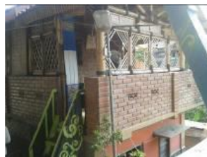
Gambar 2. 2 Bangunan dengan konstruksi dinding kombinasi batu bata dan bambu

Beberapa material kayu digunakan pada bangunan-bangunan di bantaran Kali Code, untuk pondasi, kolom, balok dan rangka atap. Material dinding banyak yang menggunakan anyaman bambu yang dicat warna warni sehingga terlihat menarik untuk menghilangkan kesan kusam dan kumuh. Namun ada juga beberapa dinding bangunan yang menggunakan kombinasi antara batu bata dan bambu.