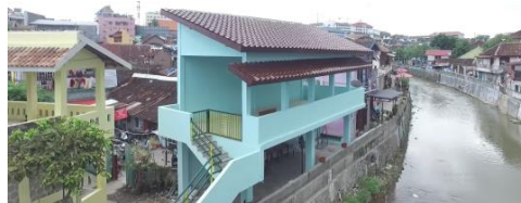
Gambar 2. 7 Balai pantau banjir

Lurah Suryatmajan dan Ketua LPM Kelurahan Suryatmajan Paryanto mengakui bahwa memang tidak mudah merealisasikan pencapaian ini. Butuh sekitar dua tahun hingga akhirnya warga dengan sukarela melakukan konsep tersebut, karena warga sadar hal tersebut adalah untuk kepentingan bersama.