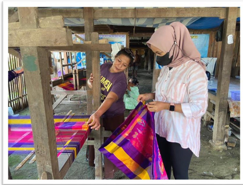
Foto bersama informan