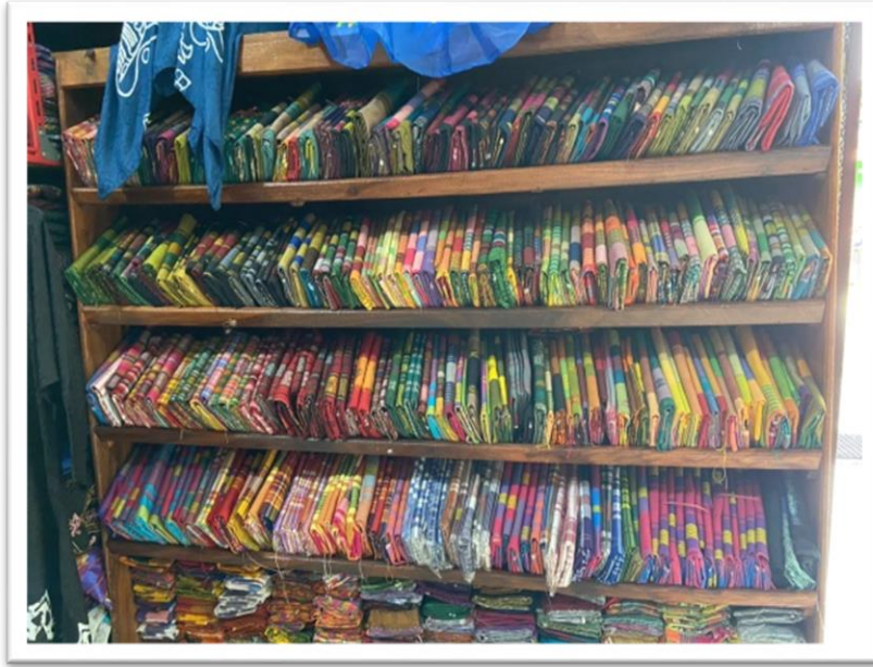
Foto beberapa contoh kain sutera yang telah ditenun