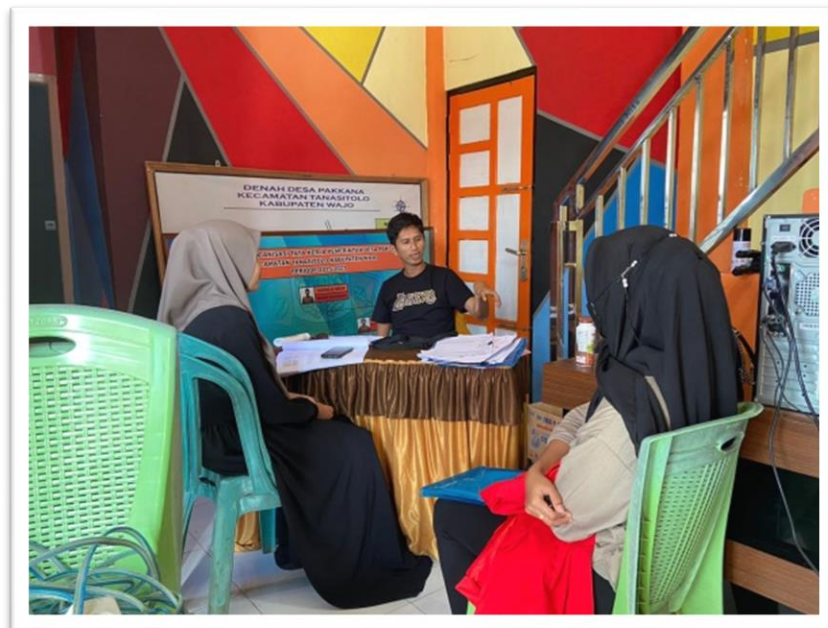
Foto bersama informan