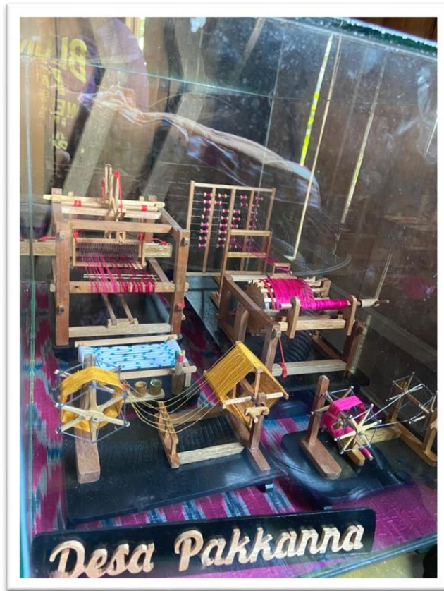
Foto alat pembuatan kain sutera