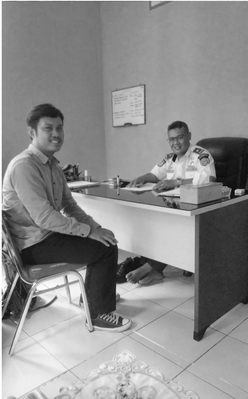
WAWANCARA DENGAN KEPALA DINAS PERHUBUNGAN KABUPATEN BARRU