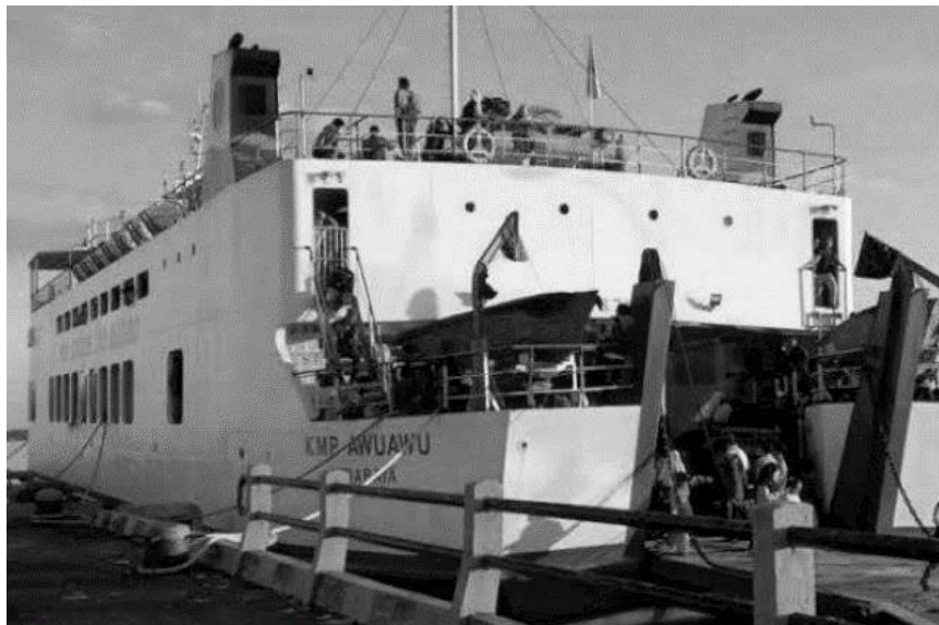
KAPAL FERY AWU AWU