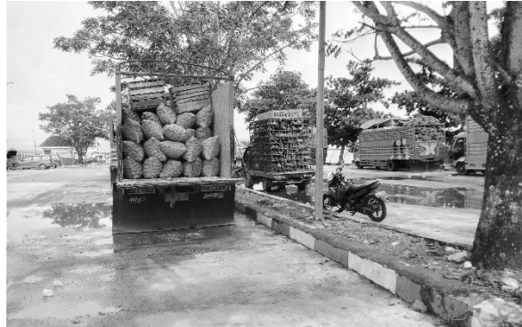
KONDISI ANTRIAN MOBIL BARANG DI PELABUHAN PENYEBERANGAN ANDI MATTALATA