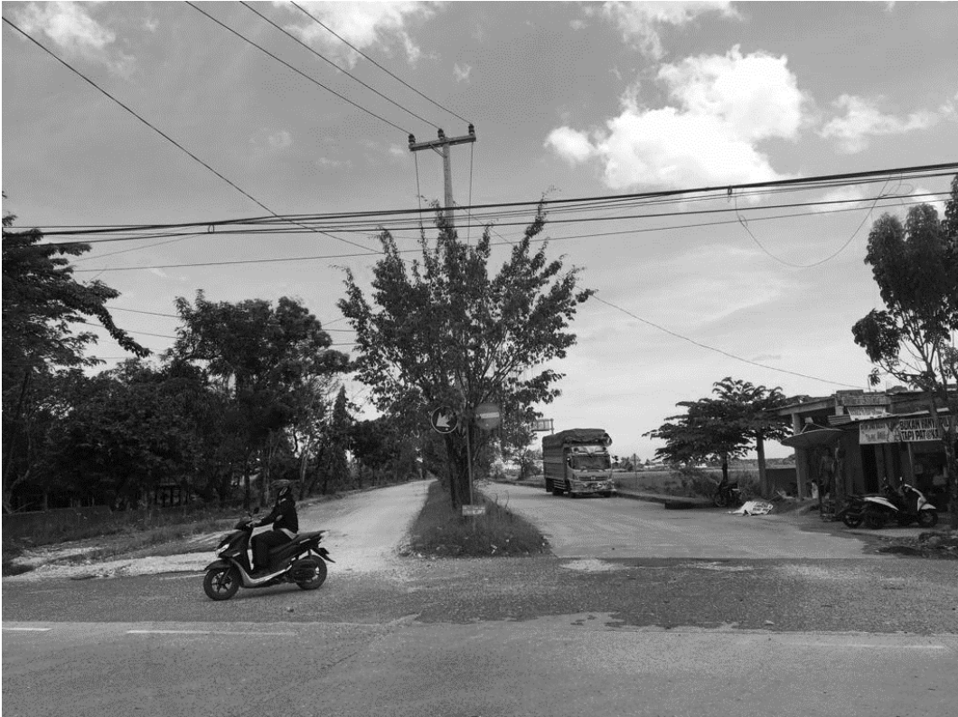
AKSES JALAN MASUK PELABUHAN