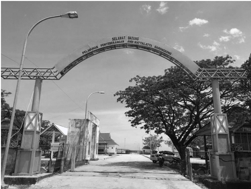
PINTU GERBANG PELABUHAN PENYEBERANGAN ANDI MATTALATA GARONGKONG