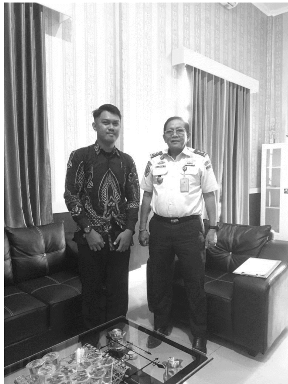
WAWANCARA DENGAN KEPALA KANTOR UPP KELAS III GARONGKONG KAB. BARRU