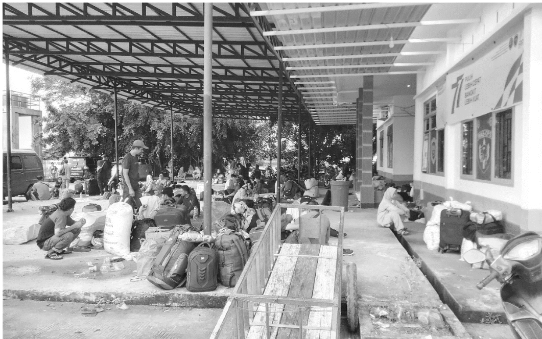
KONDISI RUANG TUNGGU PENUMPANG PELABUHAN PENYEBERANGAN ANDI MATTALATA GARONGKONG