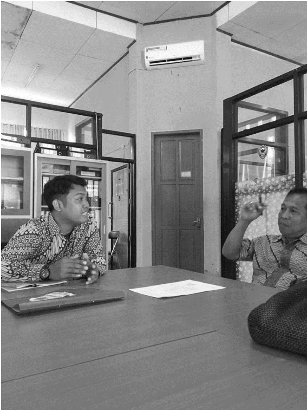
WAWANCARA DENGAN SEKRETARIS DINAS PERHUBUNGAN KABUPATEN BARRU