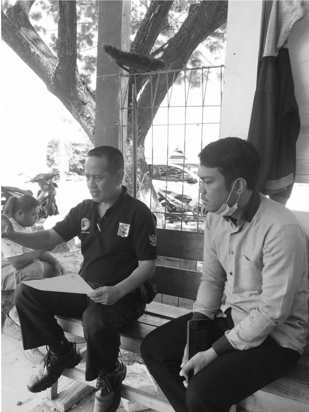
WAWANCARA DENGAN KEPALA UPTD KEPELABUHANAN DINAS PERHUBUNGAN KABUPATEN BARRU