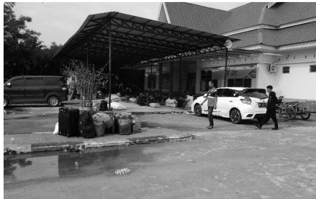
KONDISI RUANG TUNGGU DI PELABUHAN PENYEBERANGAN ANDI MATTALATA