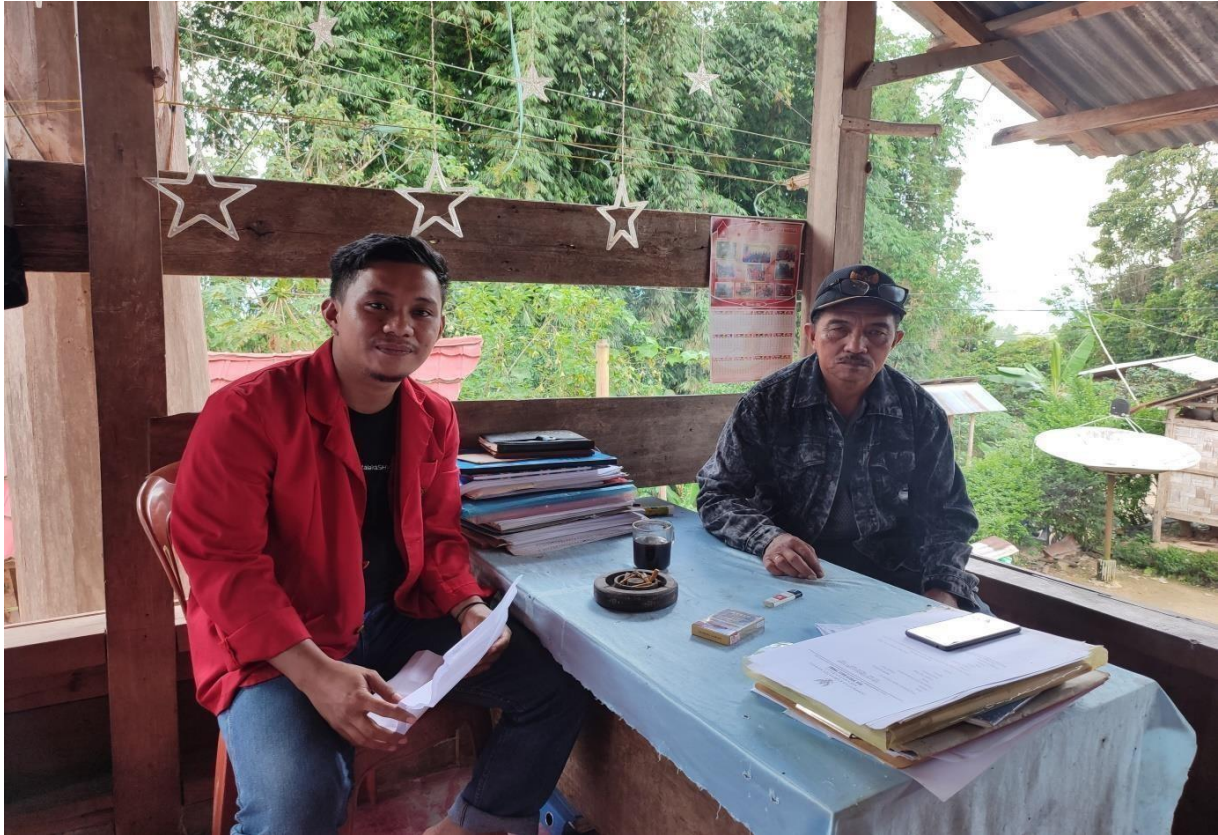
Dokumentasi wawancara dengan Pengelola Objek wisata buntu mussa'