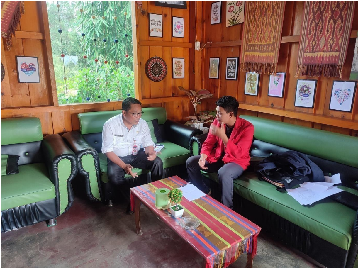
Dokumentasi Wawancara dengan Kepala Bidang pengembangan dan Promosi Pariwisata, Dinas Pariwisata Kabupaten Mamasa, Sekaligus salah satu pengelola objek wisata di kampung wisata tondok bakaru