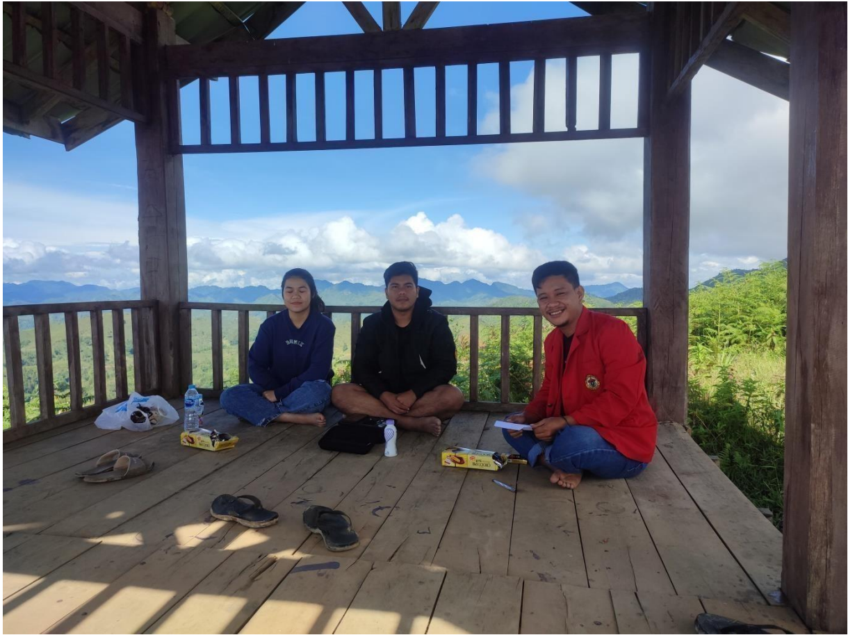
Dokumentasi wawancara dengan para pengunjung objek wisata buntu mussa, Sarambu Liawan, dan Desa wisata tondok bakaru