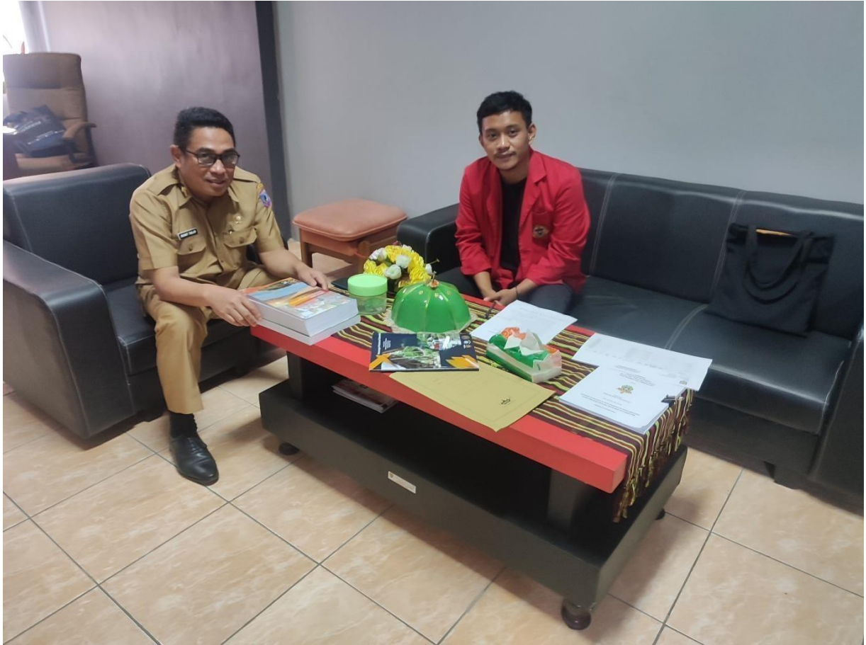
Dokumentasi wawancara dengan Kepala Dinas Pariwisata Kabupaten Mamasa