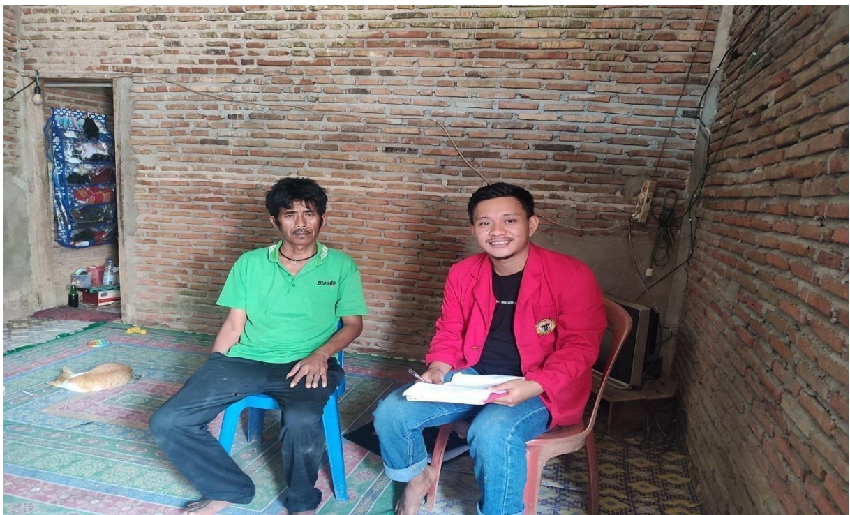
Dokumentasi wawancara dengan pengelola objek wisata Sarambu Liawan