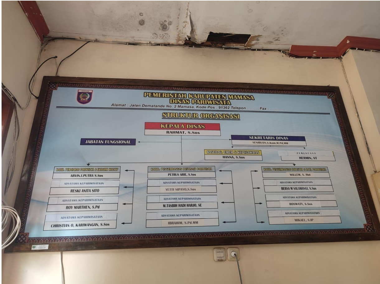
Struktur Organisasi Dinas Pariwisata Kabupaten Mamasa