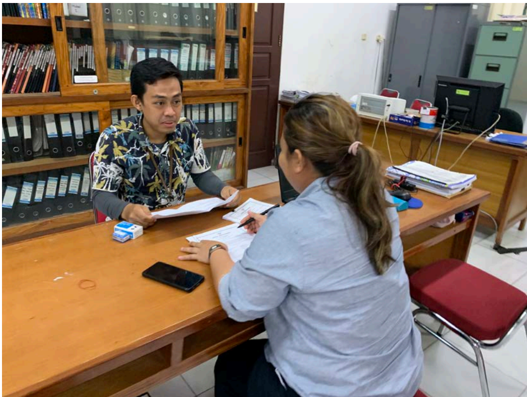
Wawancara dengan informan dari Kab. Boven Digoel