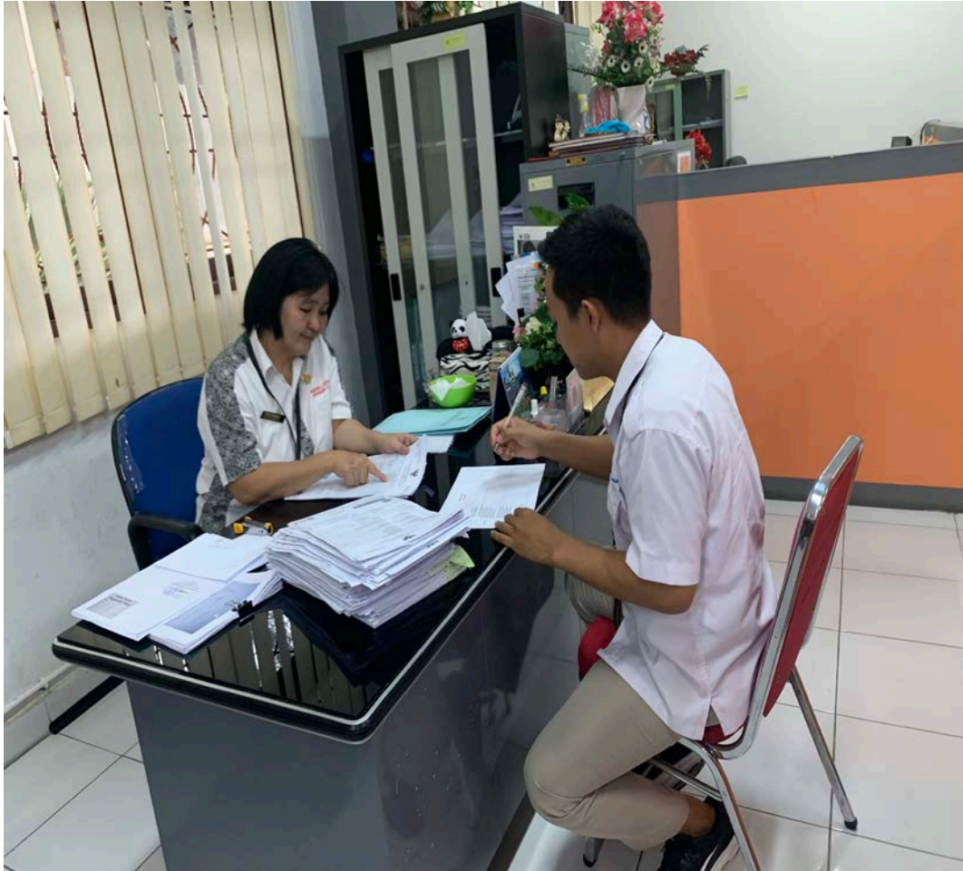
Wawancara dengan Koordinator Wilayah Kab. Supiori, Kab. Sarmi, Kab. Puncak, Kab. Waropen, Kab. Yapen, Kab. Intan Jaya, Kab. Mamberamo tengah