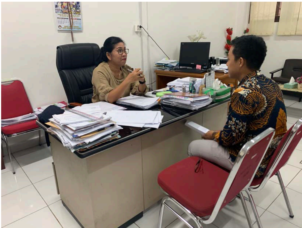
Wawancara dengan Kepala Bidang Mutasi dan Status Kepegawaian Kantor Reginal IX BKN Jayapura