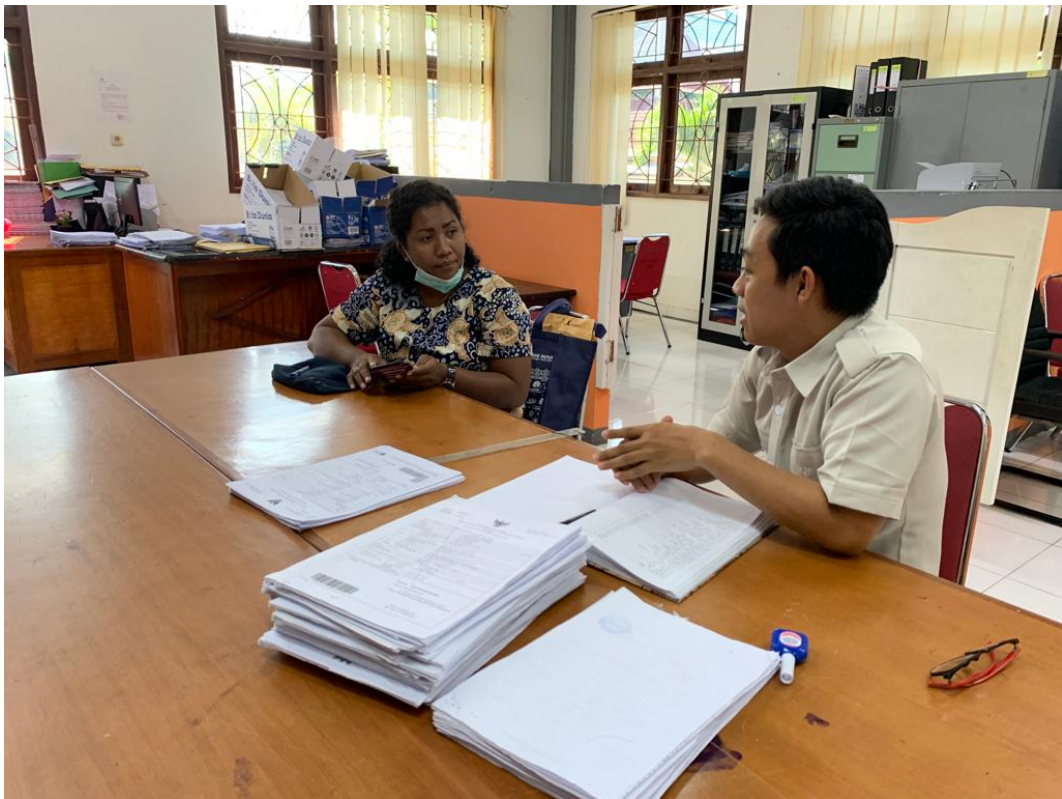
Wawancara dengan informan Kab. Asmat