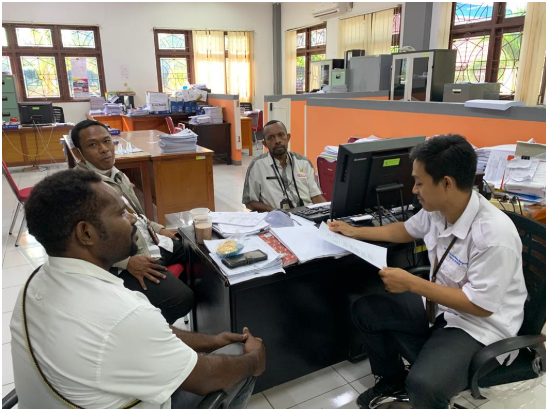
Wawancara dengan informan dari Kab. Puncak Jaya