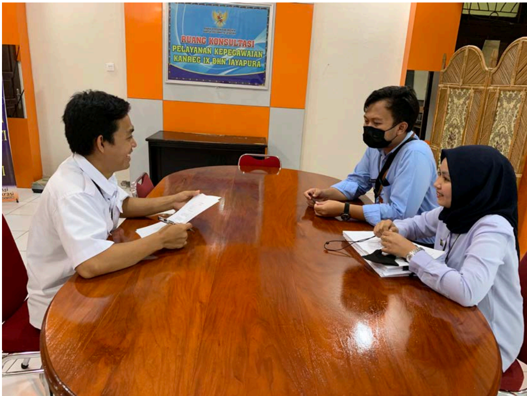
Wawancara dengan Informan dari Instansi Vertikal Kementerian Keuangan