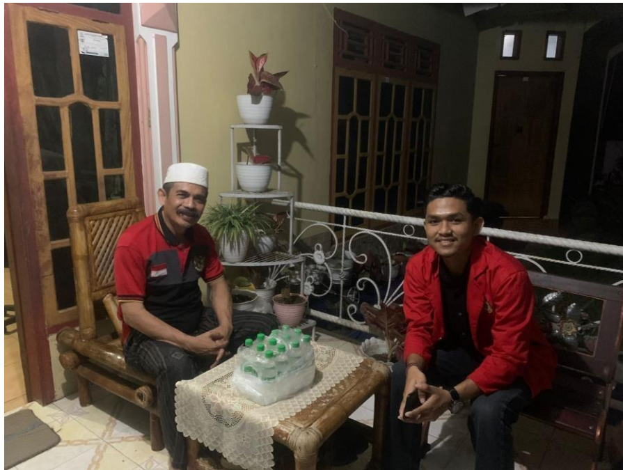
Gambar : Peneliti bersama Wakil Dewan Pendidikan Kabupaten Luwu Timur