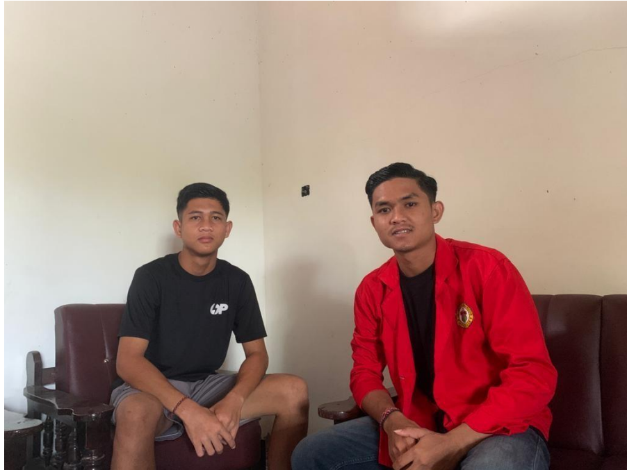
Gambar : Peneliti bersama masyarakat pengguna (siswa) Program Perpustakaan Keliling