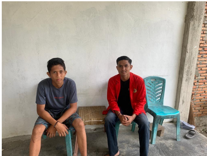
Gambar : Peneliti bersama masyarakat pengguna (siswa) Program Perpustakaan Keliling