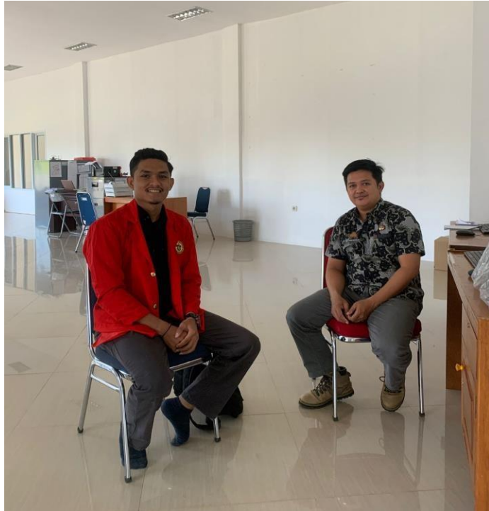
Gambar : Peneliti bersama Kepala Bidang Dinas Perpustakaan dan Kearsipan Kabupaten Luwu Timur