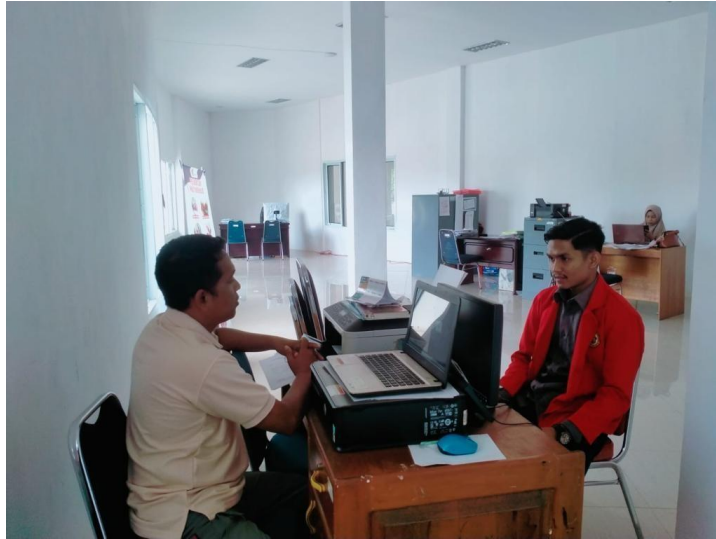
Gambar : Peneliti bersama Pustakawan Dinas Perpustakaan dan Kearsipan Kabupaten Luwu Timur