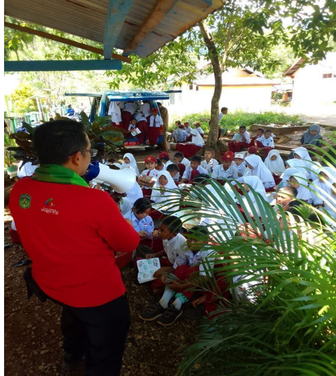
Gambar : Kegiatan Perpustakaan Keliling di Kabupaten Luwu Timur