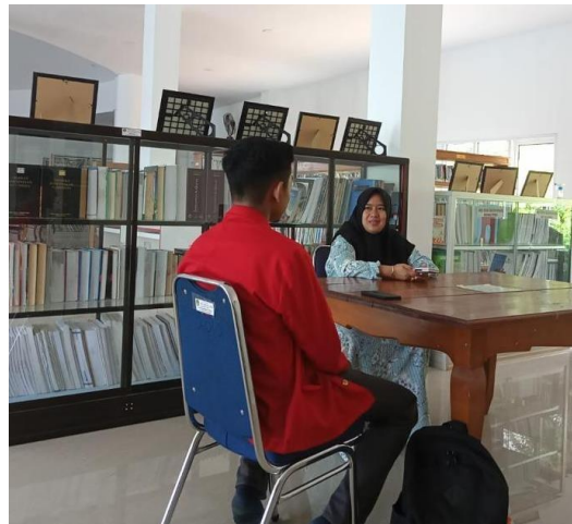
Gambar : Peneliti bersama Pustakawan Dinas Perpustakaan dan Kearsipan Kabupaten Luwu Timur