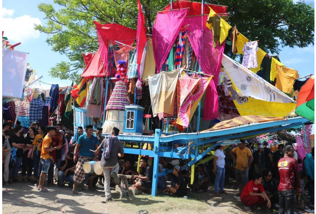
Foto 17. Mengantar Kanre Maudu