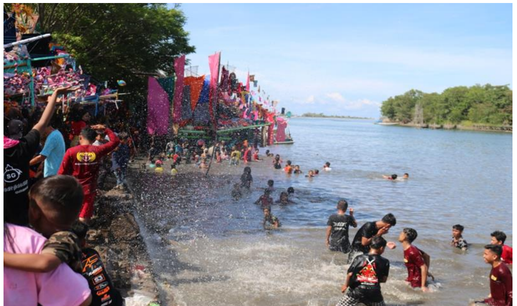
Foto 18. Suasana di Tepi Sungai Cikoang saat Ritual Maudu Lompoa