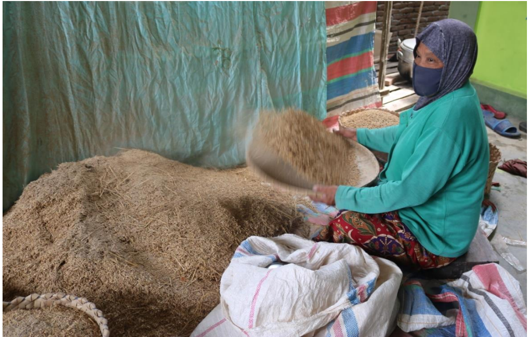
Foto 6. Proses Allodda Ase