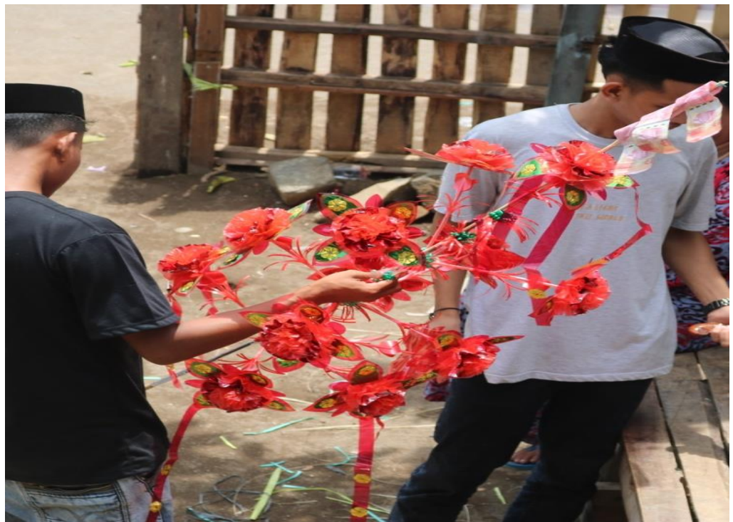
Foto 16. Gambar Pakbelo-belo Maudu