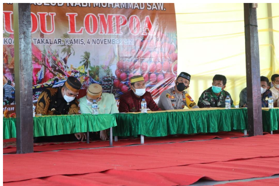
Foto 5. Tamu Undangan Maudu Lompoa di Cikoang