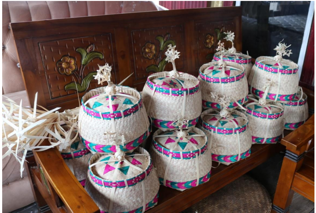
Foto 15. Gambar Tepak-tepak Maudu