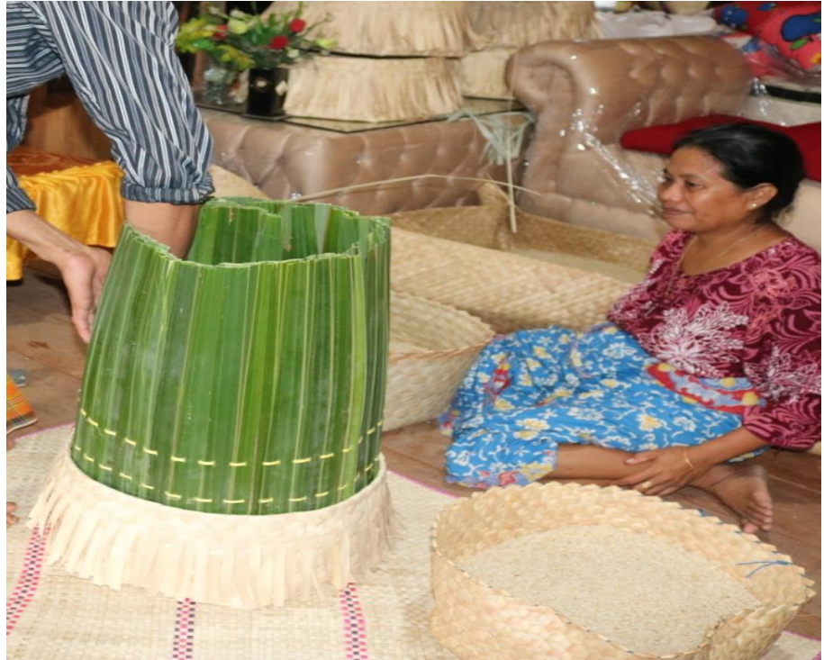
Foto 13. Gambar Sallusung yang Terbuat dari Daun Nira