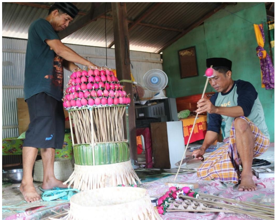
Foto 14. Gambar Menata Telur Maudu