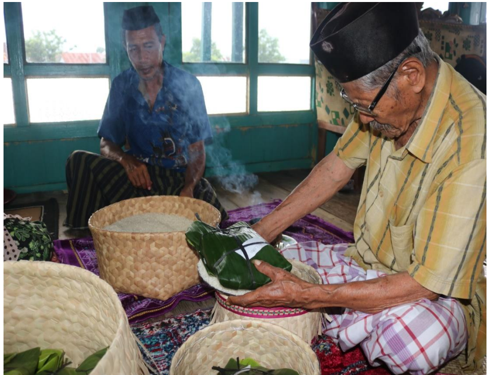
Foto 10. Ritual Ammune Kanre Maudu oleh Anrongguru