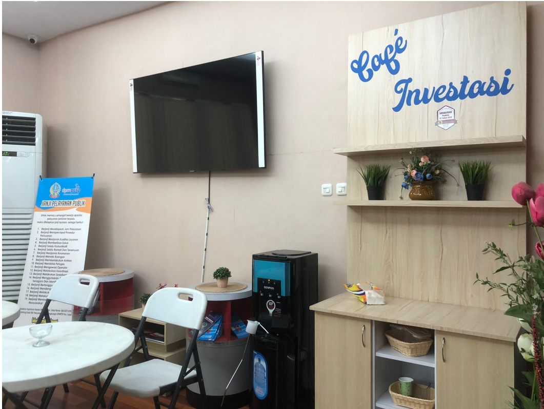
Café Investasi ( Umum) It.1 di Dinas Penanaman Modal dan Pelayanan Terpadu Satu Pintu Prov. Sulawesi Selatan.