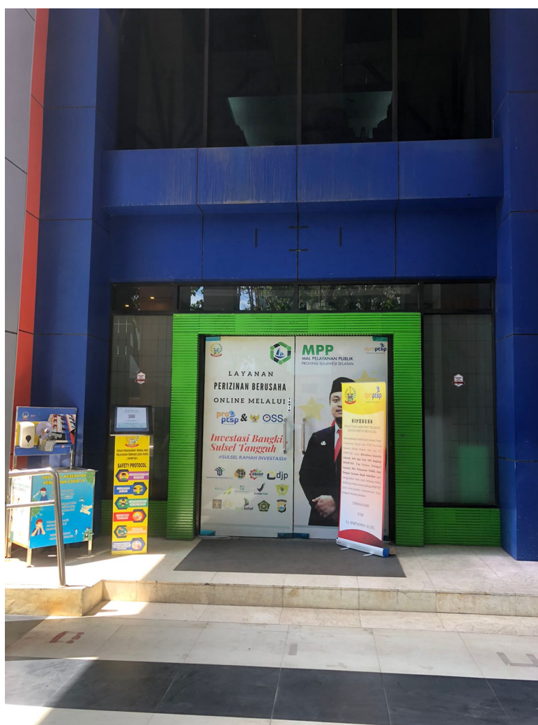
Pintu Akses Utama Dinas Penanaman Modal dan Pelayanan Terpadu Satu Pintu Prov. Sulawesi Selatan