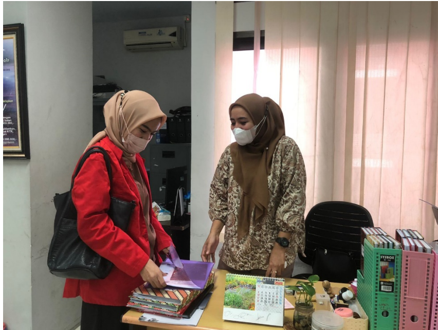
Penulis Sedang Melakukan Wawancara