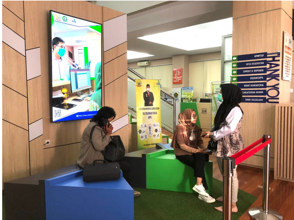
Ruang Tunggu Pemohon Perizinan Lt.1 Dinas Penanaman Modal dan Pelayanan Terpadu Satu Pintu Prov. Sulawesi Selatan.