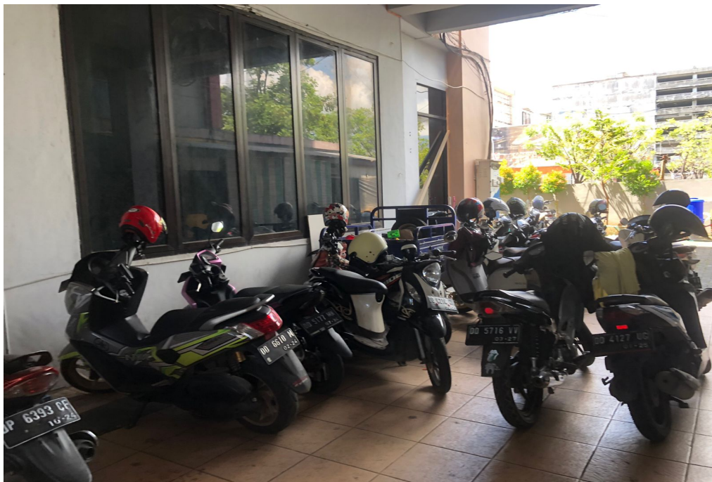
Lokasi Parkiran di Dinas Penanaman Modal dan Pelayanan Terpadu Satu Pintu Prov. Sulawesi Selatan