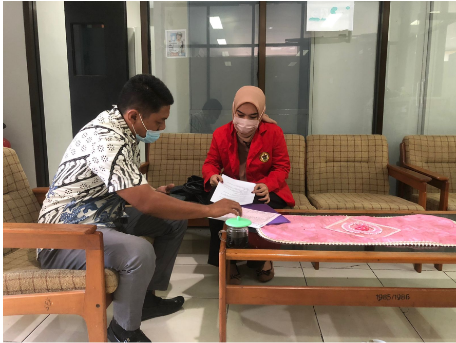
Penulis Sedang Melakukan Wawancara