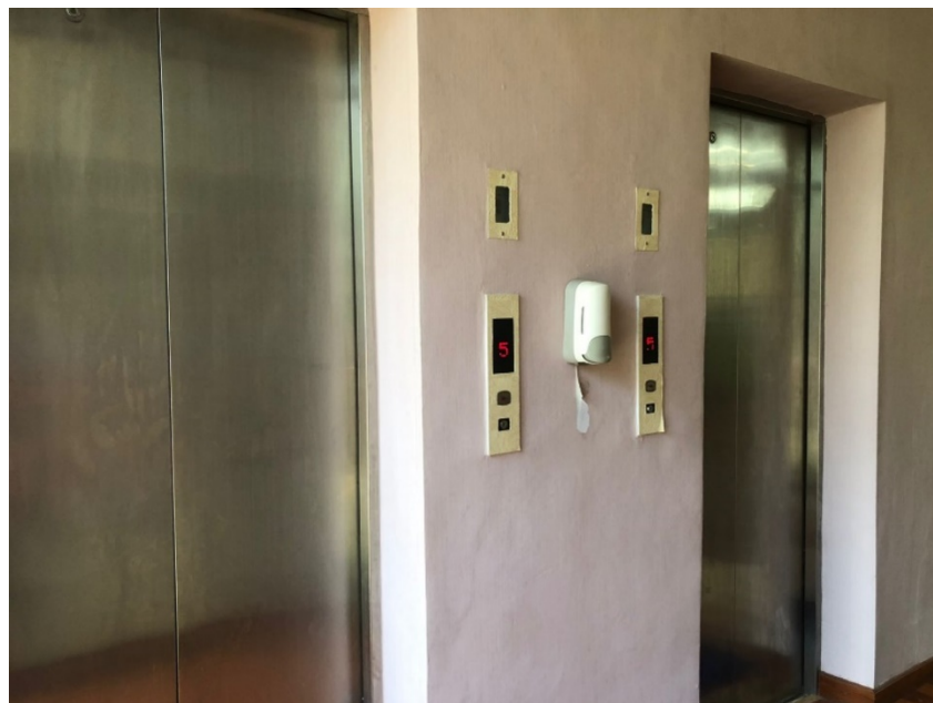
Fasilitas Umum Tangga dan Lift di Dinas Penanaman Modal dan Pelayanan Terpadu Satu Pintu Prov. Sulawesi Selatan.