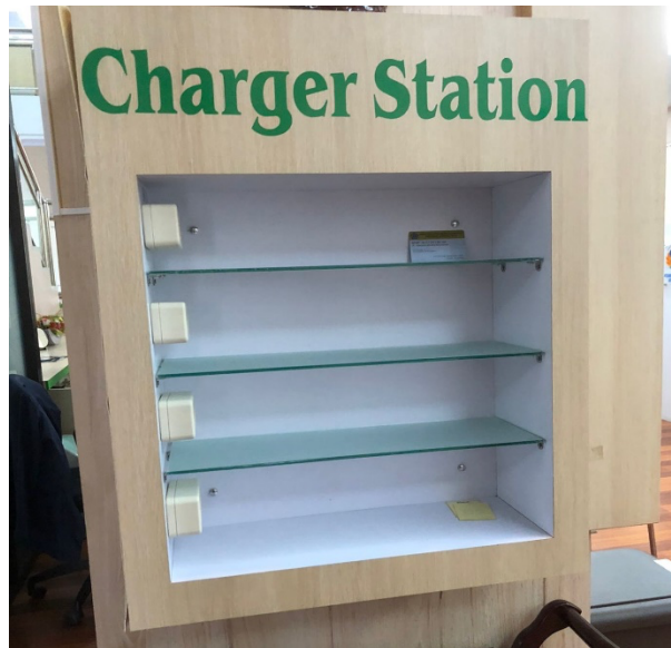
Charger Station ( Umum) It.1 di Dinas Penanaman Modal dan Pelayanan Terpadu Satu Pintu Prov. Sulawesi Selatan