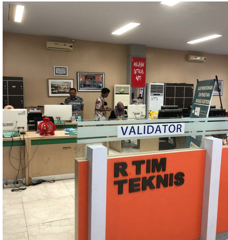
Ruang Validator (Back Office) It.2 di Dinas Penanaman Modal dan Pelayanan Terpadu Satu Pintu Prov. Sulawesi Selatan.