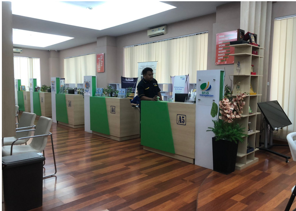
Mol Pelayanan ( Font Office) Lt.1 di Dinas Penanaman Modal dan Pelayanan Terpadu Satu Pintu Prov. Sulawesi Selatan.