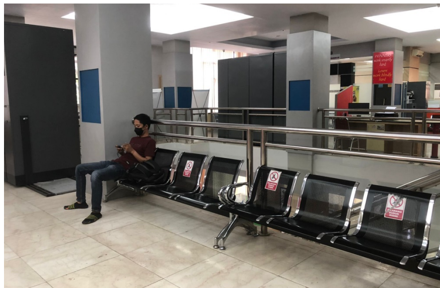
Ruang Tunggu Pemohon It.2 di Dinas Penanaman Modal dan Pelayanan Terpadu Satu Pintu Prov. Sulawesi Selatan