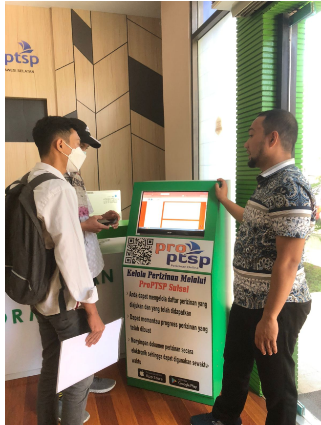
Pemberian Informasi Pegawai Kepada Pemohon Perizinan di Dinas Penanaman Modal dan Pelayanan Terpadu Satu Pintu Prov. Sulawesi Selatan.