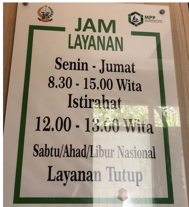
Papan Informasi Jam Layanan Dinas Penanaman Modal dan Pelayanan Terpadu Satu Pintu Prov. Sulawesi Selatan.