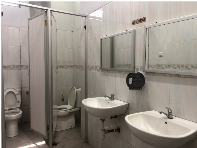
Toilet Umum di Dinas Penanaman Modal dan Pelayanan Terpadu Satu Pintu Prov. Sulawesi Selatan.