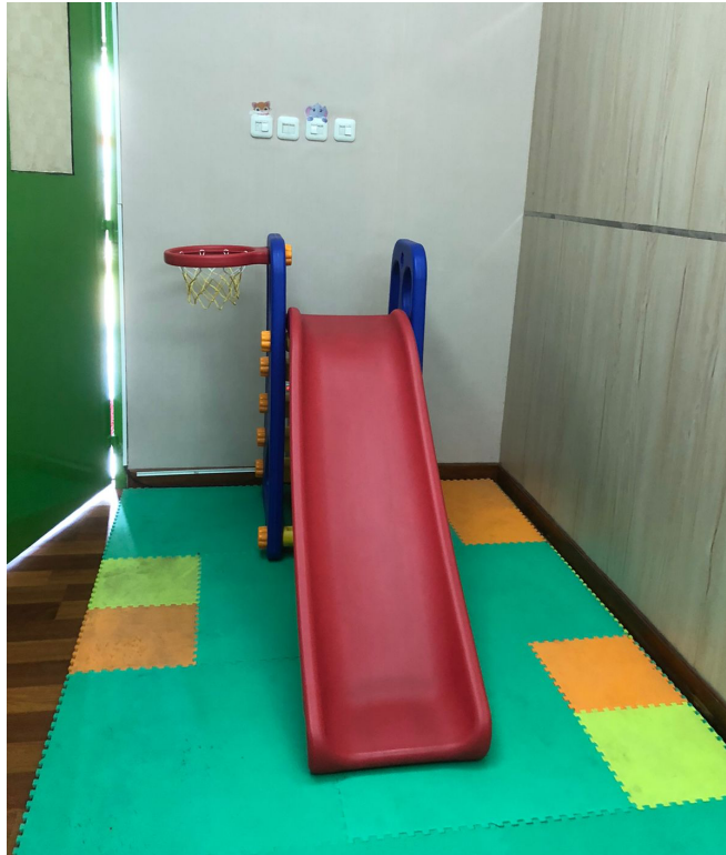
Ruang Bermain Umum Anak di Dinas Penanaman Modal dan Pelayanan Terpadu Satu Pintu Prov. Sulawesi Selatan.