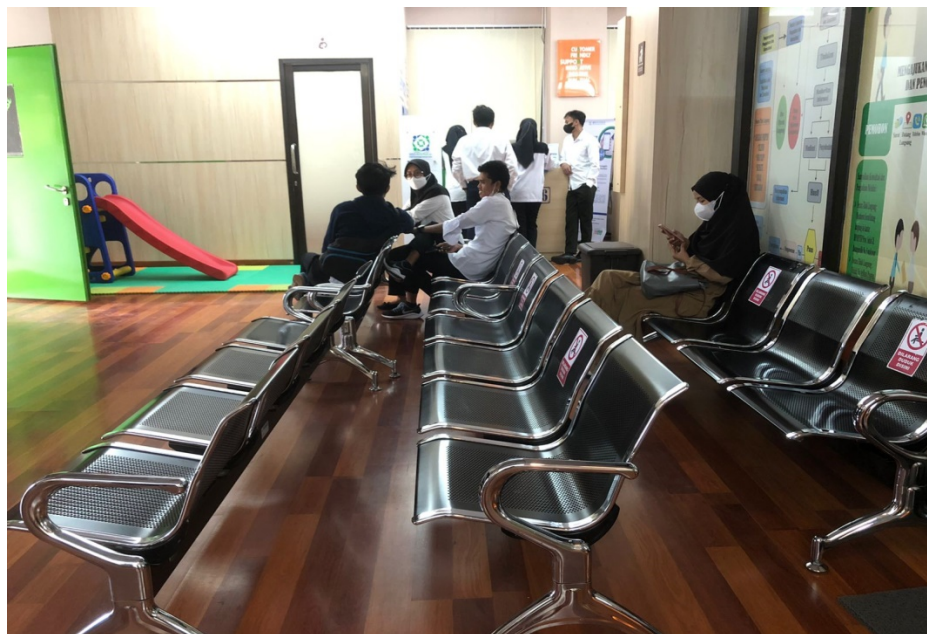
Ruang Tunggu Pemohon Lt.1 di Dinas Penanaman Modal dan Pelayanan Terpadu Satu Pintu Prov. Sulawesi Selatan