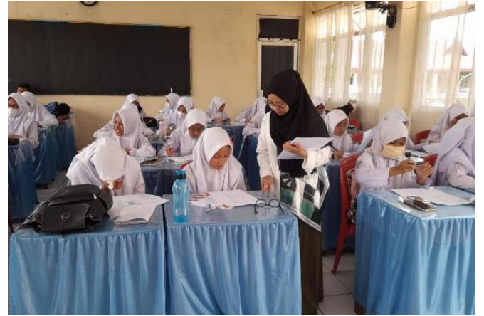
Pembagian Kuesioner Pengetahuan