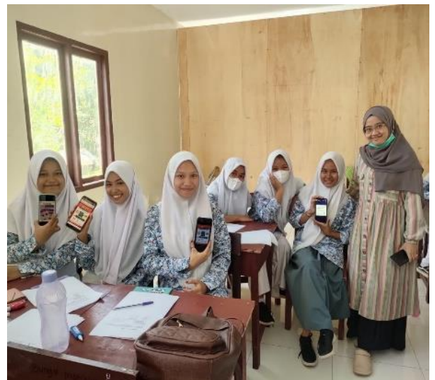
Pemasangan Media Aplikasi LADIES dan Pembagian Media e-Poster