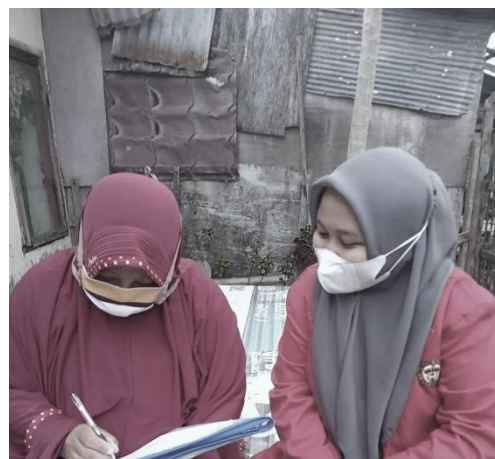
Pengumpulan Data Menggunakan Kuesioner Penelitian