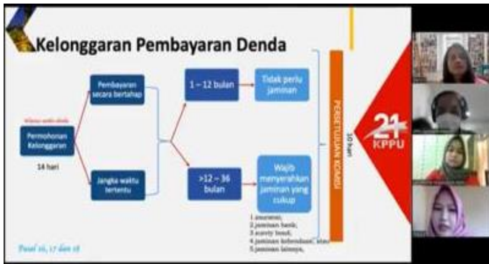
Gambar.7 Wawancara dengan Tisa Amelia selaku staf Bidang Bantuan Hukum dan Eksekusi Komisi Pengawas Persaingan Usaha Republik Indonesia (KPPU RI), pada 22 September 2022, Secara Daring Melalui Media Zoom.