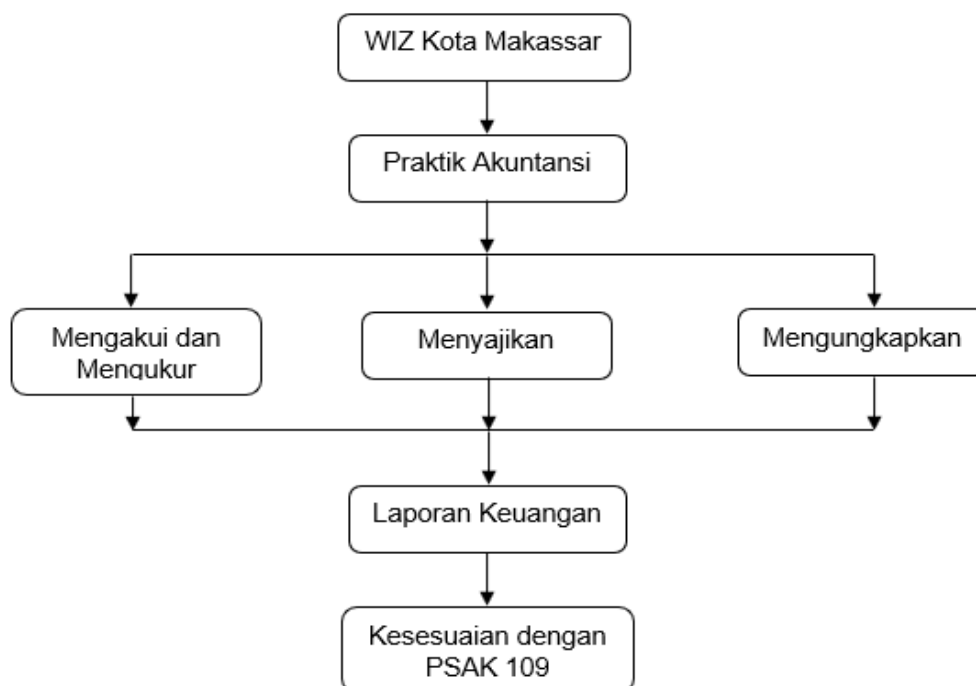
Gambar 2.1 Kerangka Pemikiran

Model kerangka konseptual berdasarkan tujuan tersebut dapat digambarkan sebagai berikut: