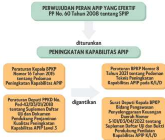
Gambar 2.1 Kerangka Logis Peraturan