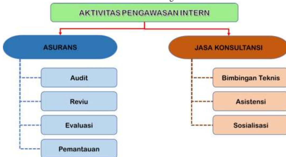
Gambar 2.3 Jenis Aktivitas Pengawasan