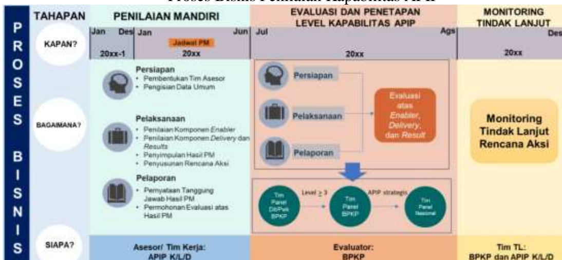
Gambar 2.7 Proses Bisnis Penilaian Kapabilitas APIP