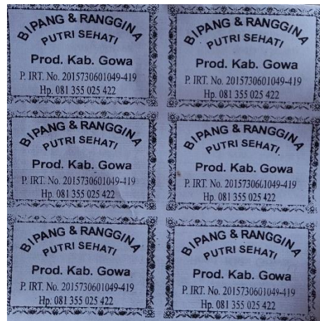
Label Produk Bipang & Rangginang Putri Sehati