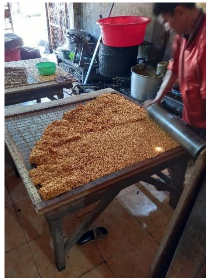
Proses perataan adonan bipang yang telah dicampur sebelumnya.