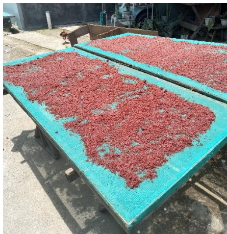
Proses pengeringan beras ketan yang sudah melalui proses pemasakan