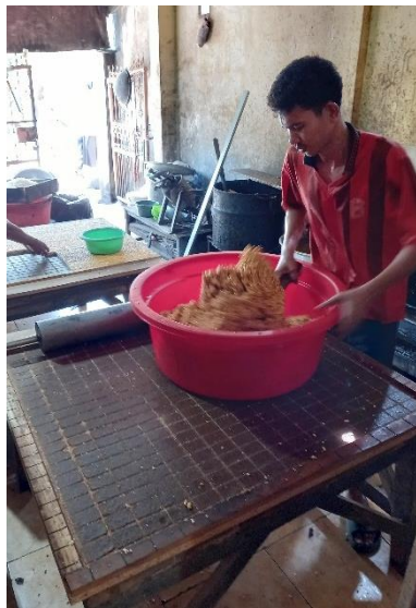
Proses pencampuran gula merah dan beras ketan yang sudah diolah menjadi brondong beras