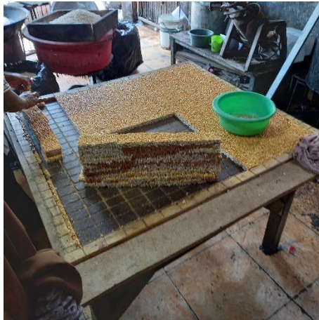
Proses Pemotongan Bipang