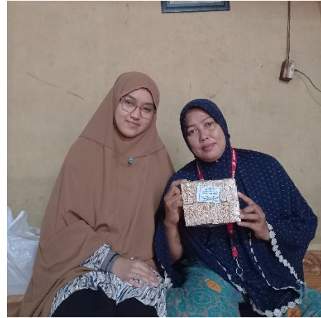
Wawancara dengan pemilik Usaha