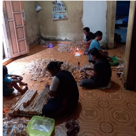
Proses Pengemasan Bipang & Rangginang