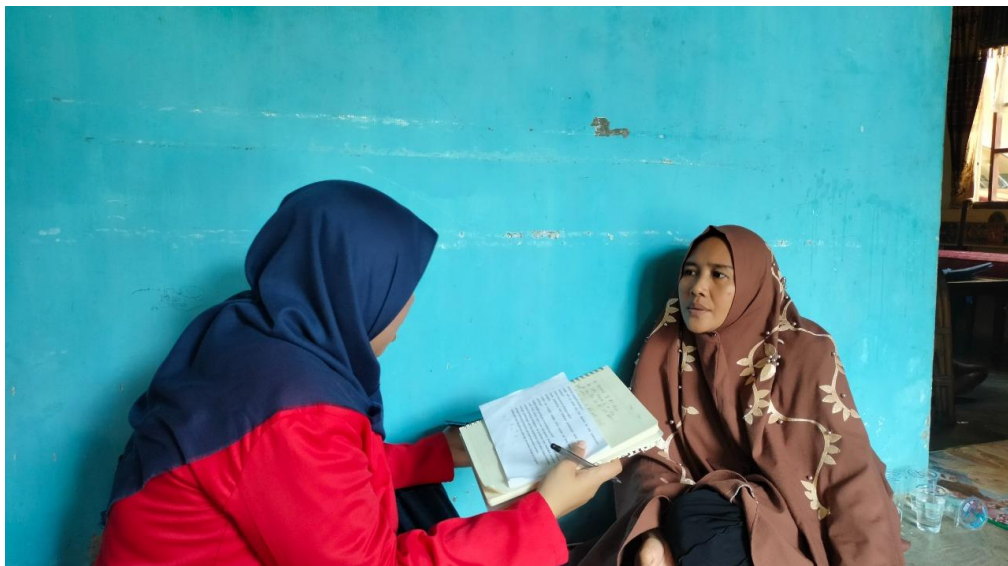
Wawancara bersama KPM PKH