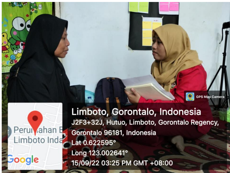
Wawancara bersama KPM PKH