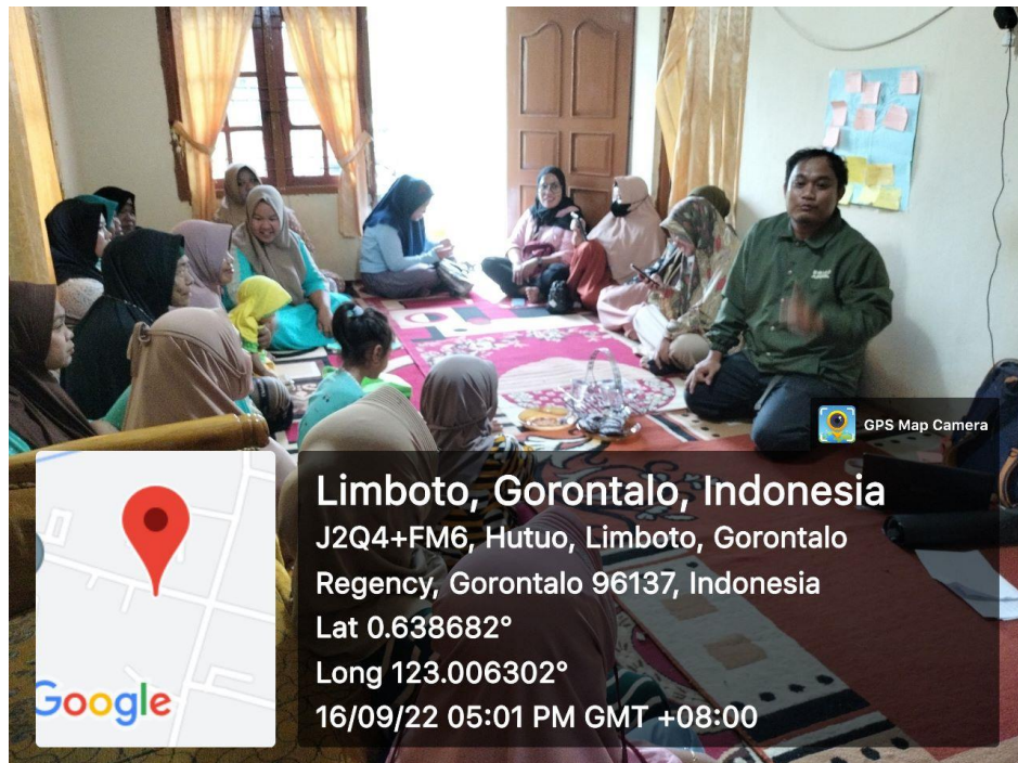
Pelaksanaan P2K2 16 September 2022