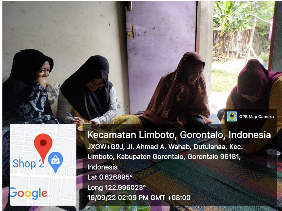
Pelaksanaan P2K2 16 September 2022