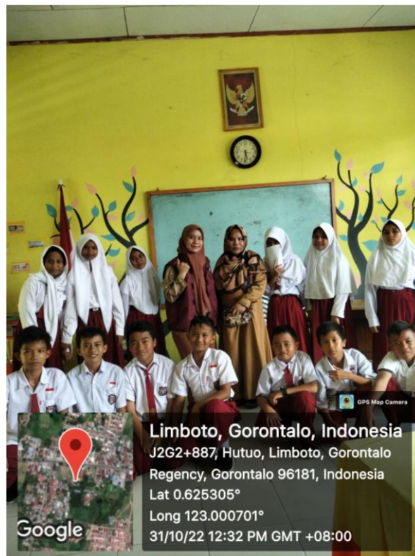
Verifikasi Fasilitas Pendidikan