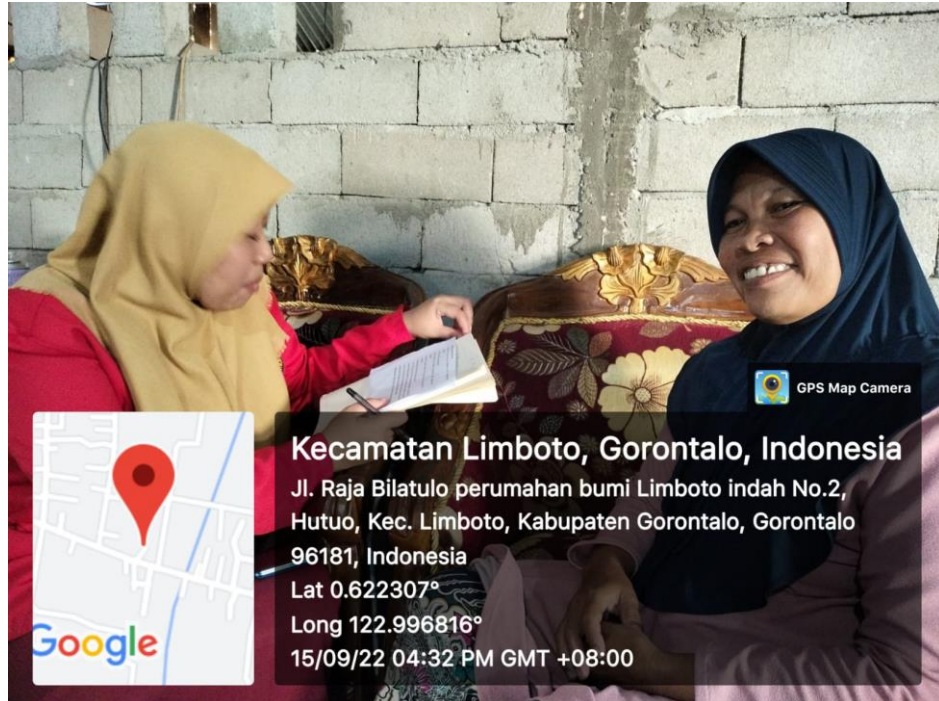
Wawancara bersama KPM PKH