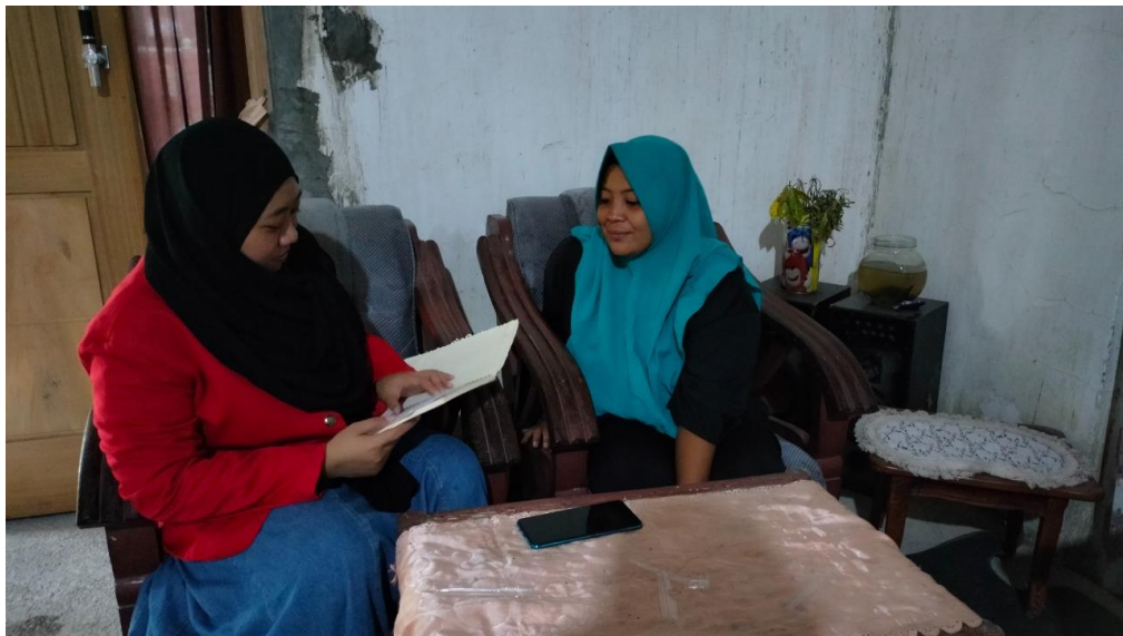
Wawancara bersama KPM PKH