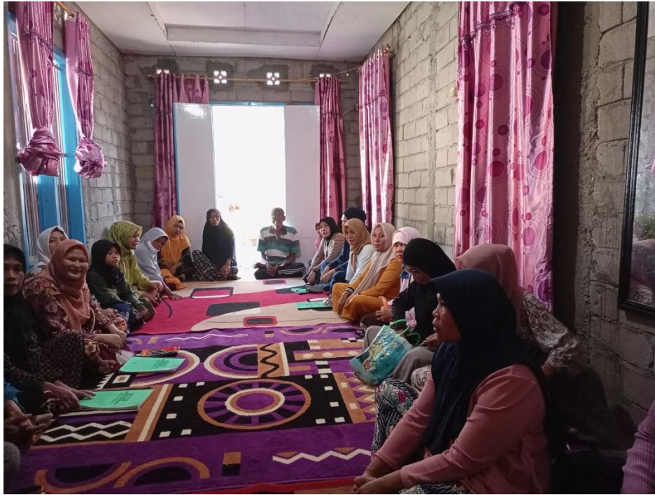
Pelaksanaan P2K2 15 September 2022