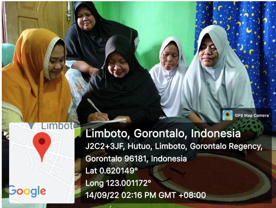
Pelaksanaan P2K2 14 September 2022