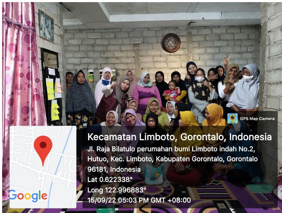
Pelaksanaan P2K2 15 September 2022