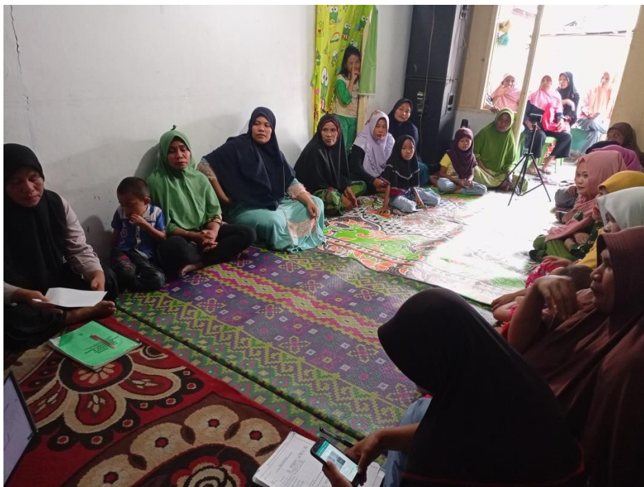
Pelaksanaan P2K2 15 September 2022