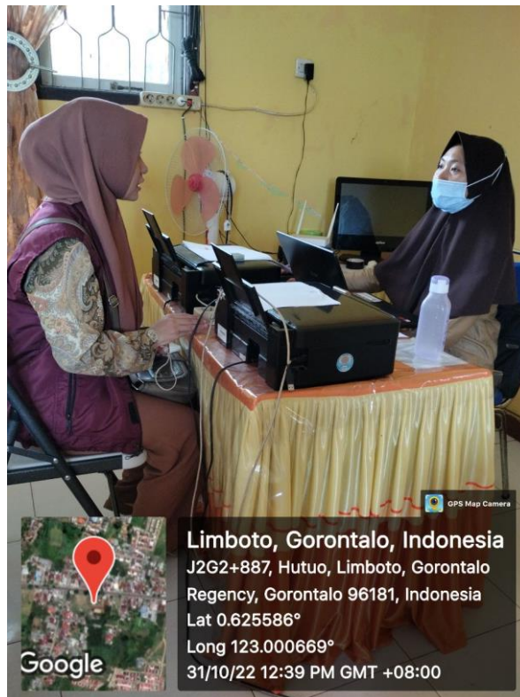
Verifikasi Fasilitas Pendidikan