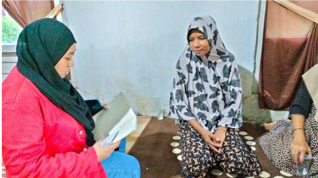
Wawancara bersama KPM PKH