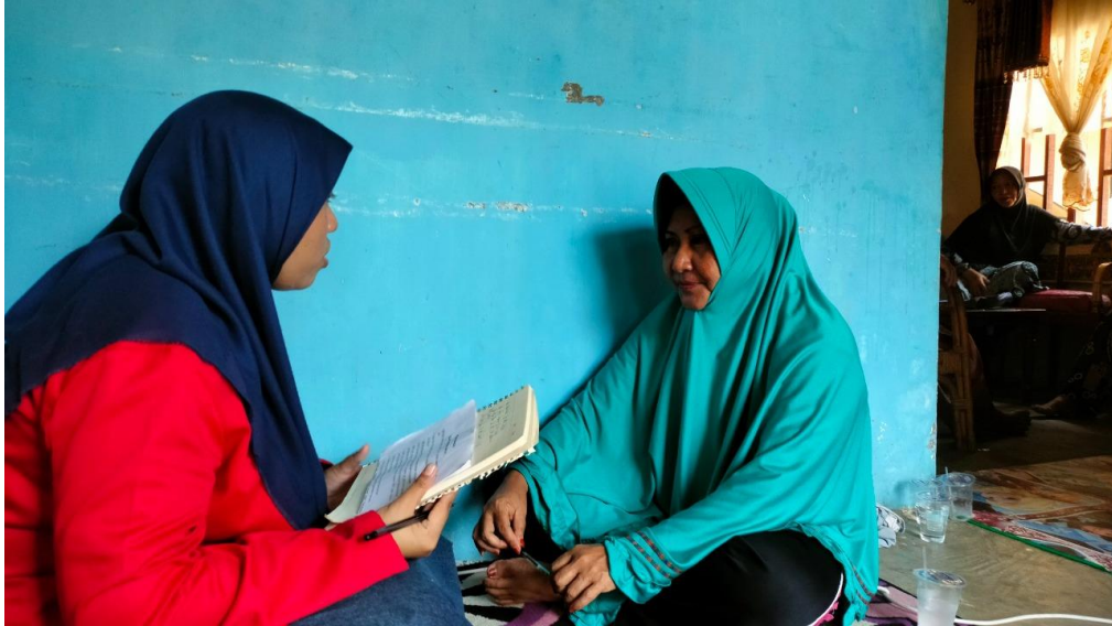
Wawancara bersama KPM PKH