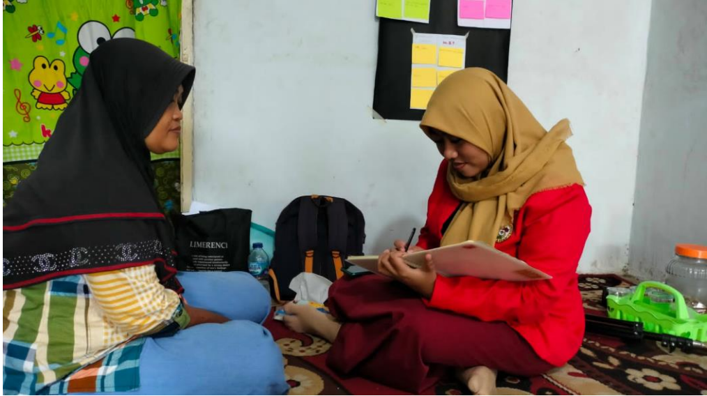
Wawancara bersama KPM PKH