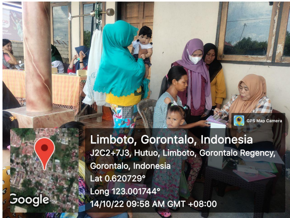
Verifikasi Fasilitas Kesehatan