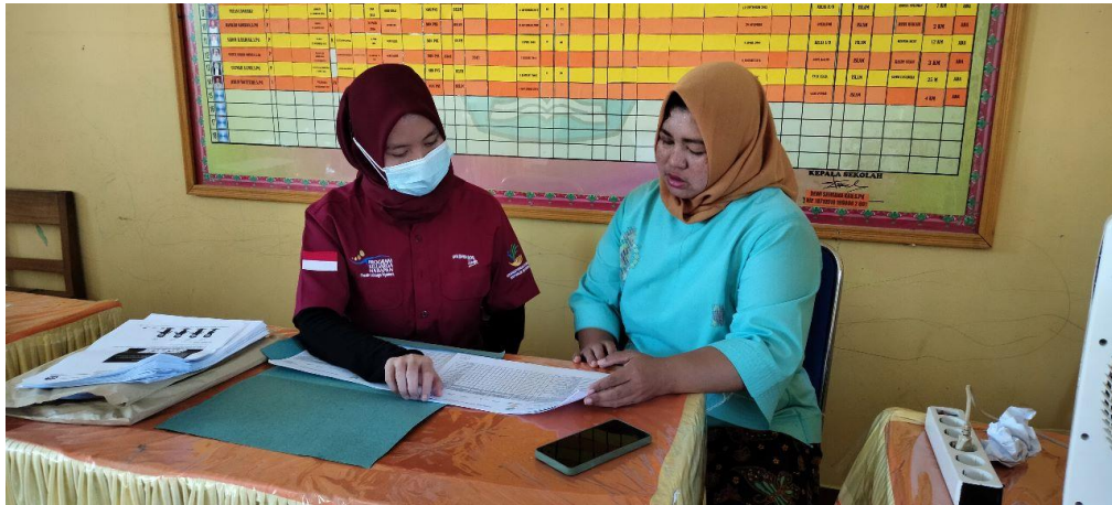
Verifikasi Fasilitas Pendidikan