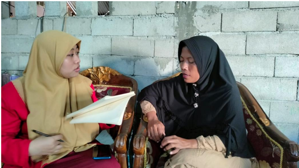
Wawancara bersama KPM PKH