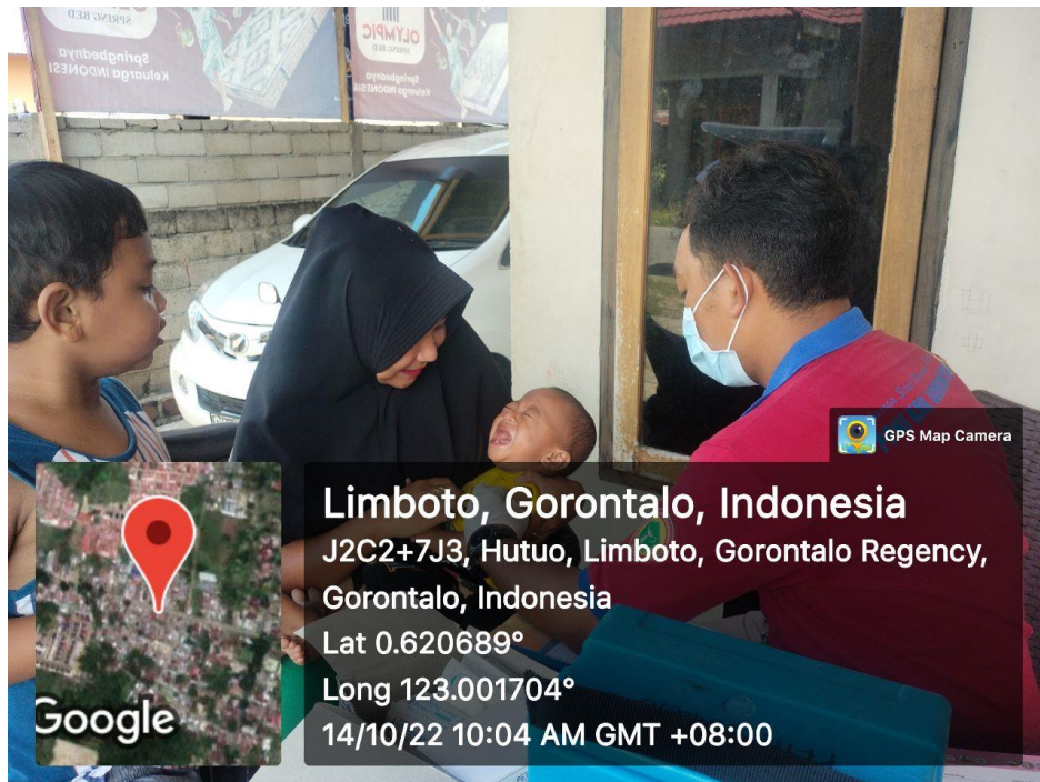
Pelaksanaan P2K2 17 September 2022

Limboto, Gorontalo, Indonesia J2C2+7J3, Hutuo, Limboto, Gorontalo Regency, Gorontalo, Indonesia Lat 0.620689° Long 123.001704° 14/10/22 10:04 AM GMT +08:00