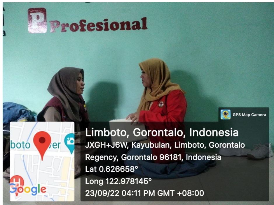
Wawancara bersama Pendamping PKH Kelurahan Hutuo, Kecamatan Limboto, Kabupaten Gorontalo