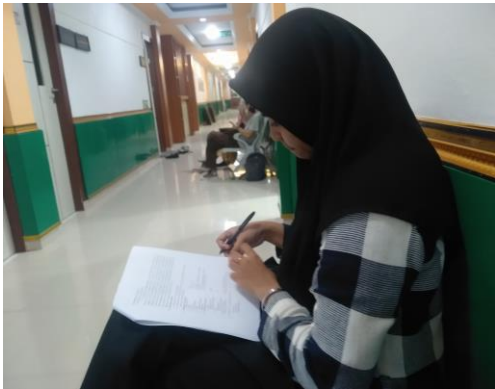
Gambar 4. Proses Pengisian Kuesioner