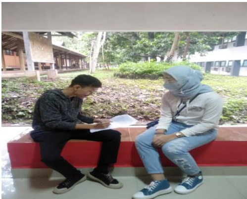
Gambar 5. Proses Pengisian Kuesioner