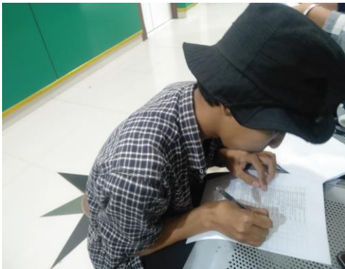
Gambar 3. Proses Pengisian Kuesioner