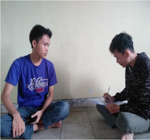
Gambar 2. Proses Pengisian Kuesioner