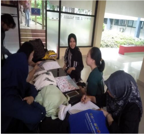
Gambar 1. Observasi dilingkup departemen