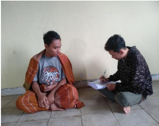
Gambar 6. Proses Pengisian Kuesioner