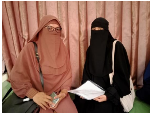
Gambar 6. Dokumentasi Penulis Dengan Informan SH