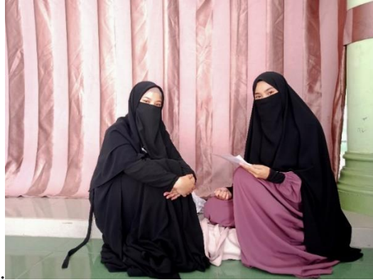
Gambar 5. Dokumentasi Penulis Dengan Informan RFA