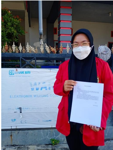
Gambar 5. Toko RPK Buniyamin