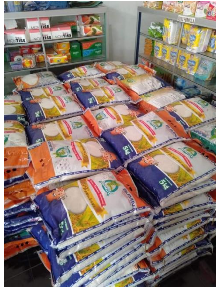
Gambar 10. Bahan Pangan (Beras)