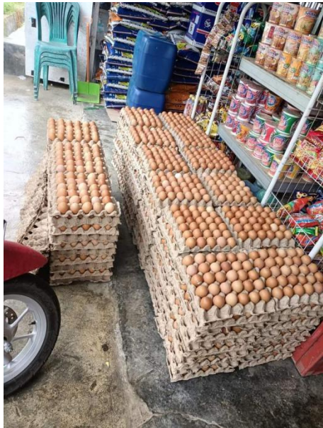
Gambar 7. Bahan Pangan (Telur)