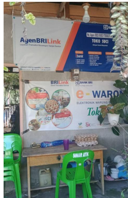
Gambar 2. Toko RPK Suci