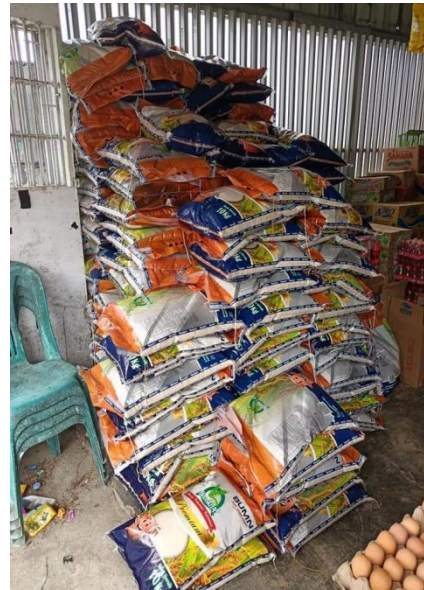
Gambar 8. Bahan Pangan (Beras)