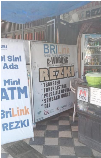
Gambar 1. Toko RPK Rezki