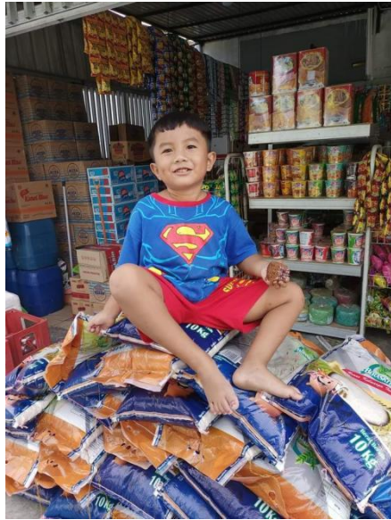
Gambar 9. Bahan Pangan (Beras)