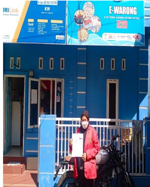
Gambar 6. Toko RPK N2N