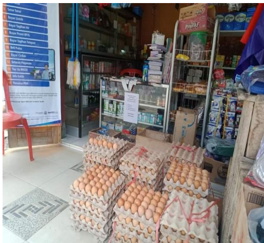
Gambar 11. Bahan Pangan (Telur)