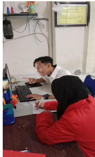
Gambar 12. Foto Bersama Pegawai Bulog Bagian Komersil