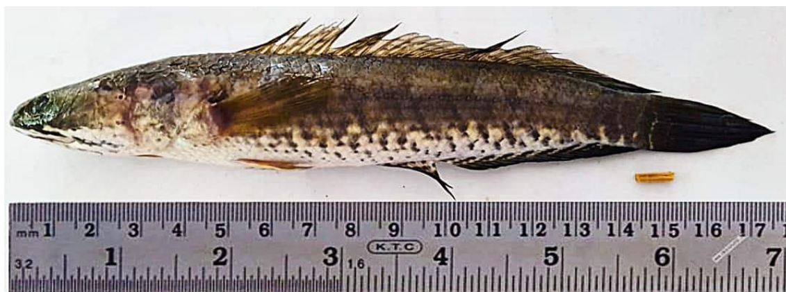
Gambar 1. Ikan Gabus Channa striata (Bloch, 1793) di Danau Tempe.

Adapun gambar ikan Gabus Channa striata (Bloch, 1793) disajikan pada Gambar 1.