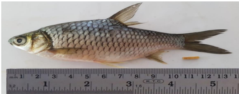
Gambar 2. Ikan Tawes Barbonymus gonionotus (Bleeker, 1849) di Danau Tempe.

Adapun gambar ikan tawes Barbonymus gonionotus (Bleeker, 1849) disajikan pada Gambar 2.