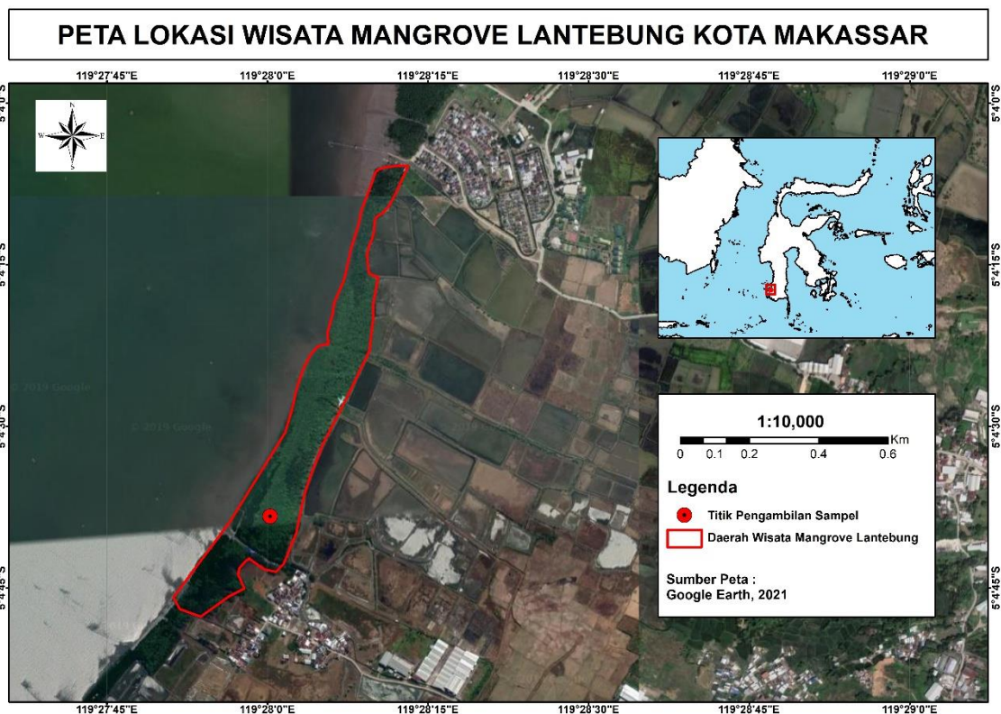
Gambar 2. Peta lokasi pengambilan daun Rhizophora mucronata di Kawasan Hutan Mangrove Lantebung, Kelurahan Bira, Kecamatan Tamalanrea, Makassar

Penelitian ini telah dilaksanakan pada bulan Agustus-November 2021. Pengambilan sampel Rhizophora mucronata dilakukan di Kawasan Hutan Mangrove Lantebung, Kelurahan Bira, Kecamatan Tamalanrea, Makassar. Preparasi sampel dilakukan di Laboratorium Biologi Laut dan Laboratorium Teknologi Hasil Perikanan, Fakultas Ilmu Kelautan dan Perikanan, Universitas Hasanuddin. Uji fitokimia dan uji antioksidan dilakukan di Laboratorium Biokimia, Fakultas Matematika dan Ilmu Pengetahuan Alam, dan Laboratorium Kimia Pakan, Fakultas Peternakan, Universitas Hasanuddin, Makassar.