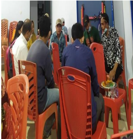
Focus Group Discussion