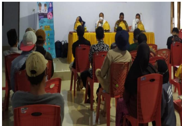
Focus Group Discussion