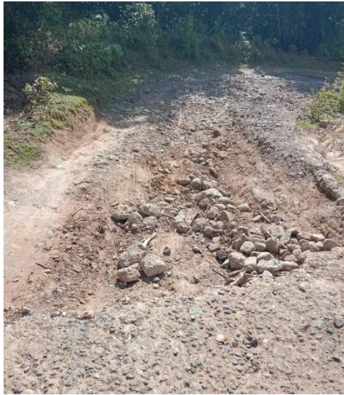
Kondisi Jalan Desa Laiya