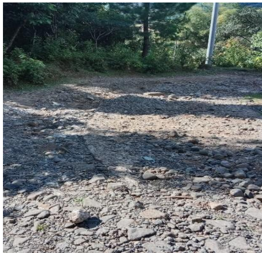
Kondisi Jalan Desa Laiya