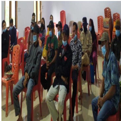
Focus Group Discussion