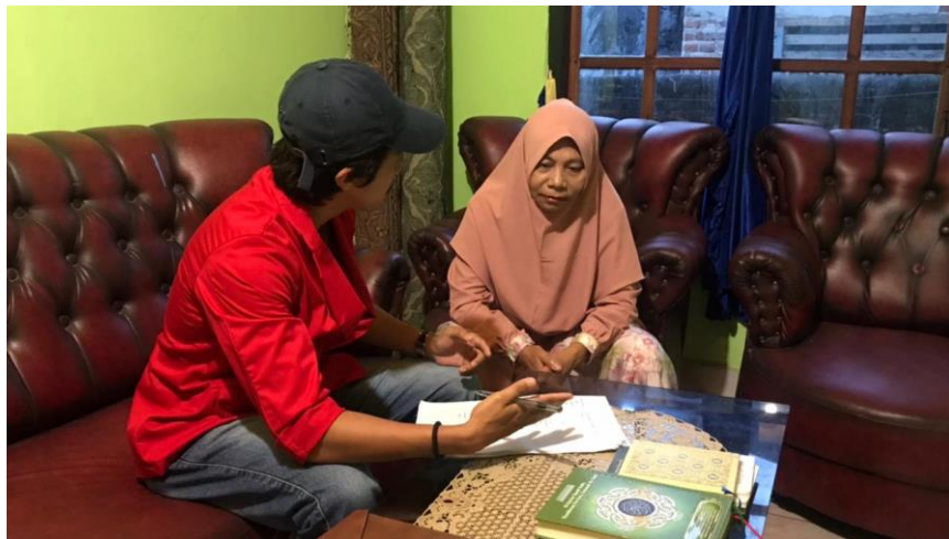
Gambar 2. Terlihat seorang informan yang sedang melakukan percakapan dengan peneliti.