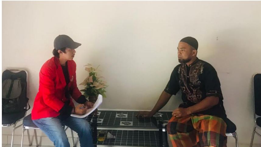
Gambar 3. Terlihat seorang informan yang sedang menjelaskan mengenai bentuk bahasa dalam bahasa Kulisusu.