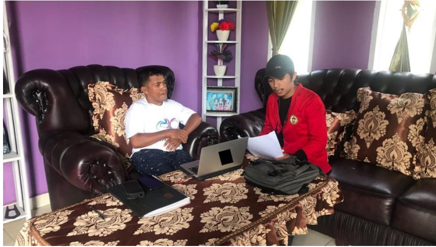
Gambar 1. Terlihat seorang informan yang sedang diwawancarai oleh peneliti.