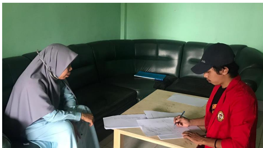
Gambar 4. Terlihat seorang informan yang sedang mengarahkan peneliti dalam menulis bentuk kata, klausa/kalimat dalam bahasa Kulisusu.