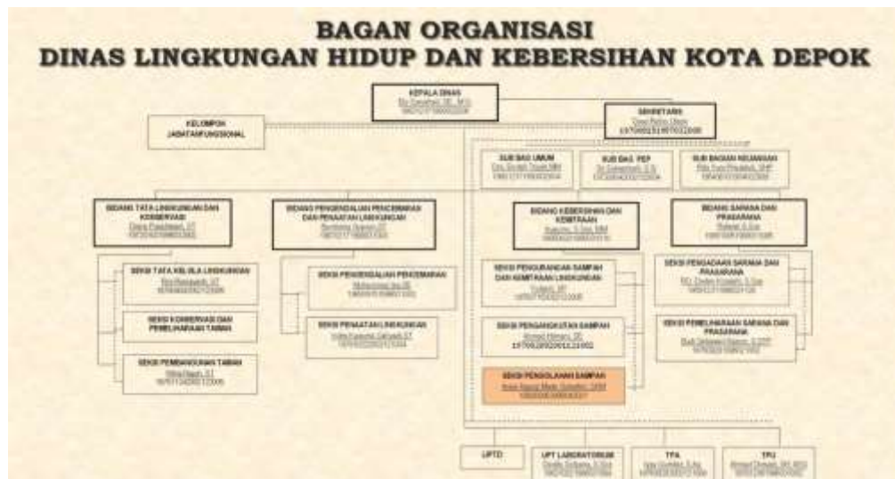
Foto Struktur Organisasi Dinas Lingkungan Hidup dan Kebersihan Kota Depok