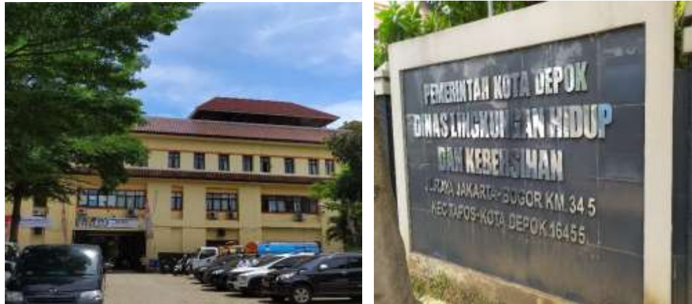
Foto Kantor Dinas Lingkungan Hidup dan Kebersihan Kota Depok