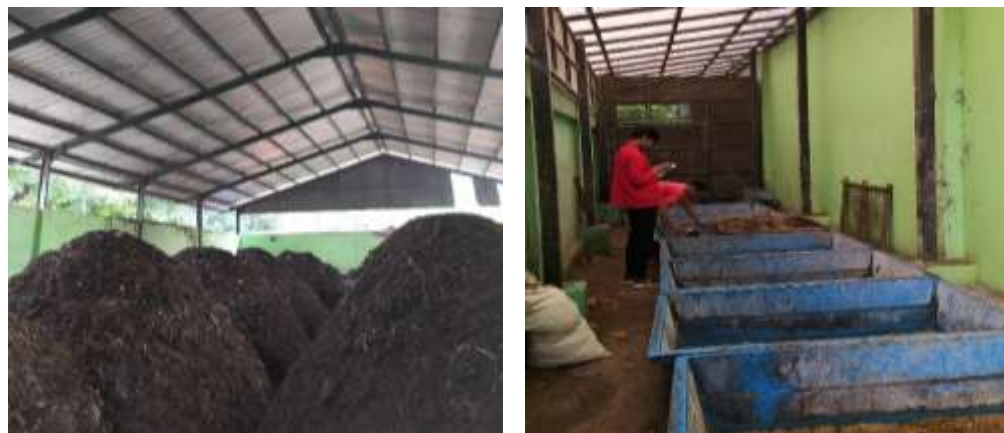
Foto Unit Pengolahan Sampah (UPS) Merdeka II, Kota Depok