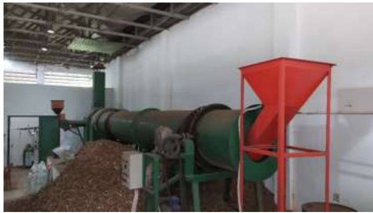
Foto Tempat Pengolahan Sampah Setempat (TPSS) Kota Depok