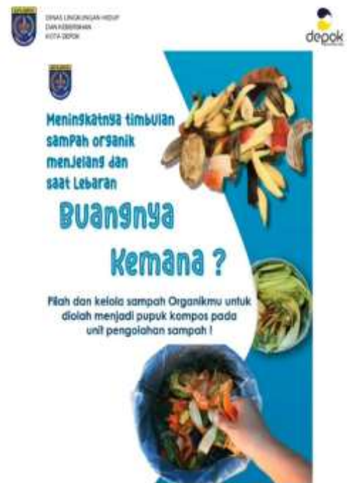
Poster pengelolaan Sampah Dinas Lingkungan Hidup Kota Depok