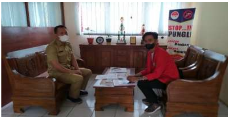
Foto wawancara bersama Kepala UPT TPA Cipayung Kota Depok