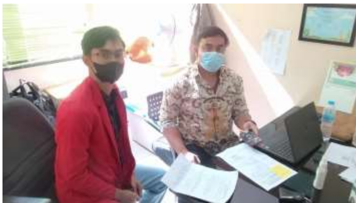
Foto wawancara bersama Kepala Seksi Pengurangan Sampah dan Kemitraan Lingkungan DLHK Kota Depok