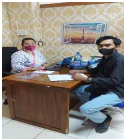
Foto wawancara bersama Kepala Seksi Pengolahan Sampah DLHK Kota Depok