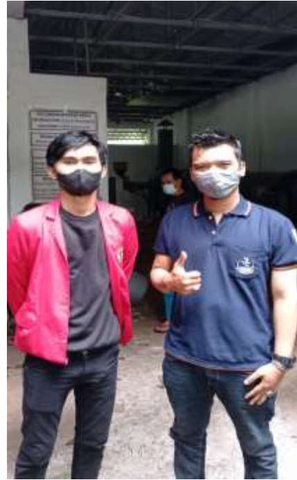
Foto wawancara bersama Koordinator UPS Merdeka II & Koordinator TPSS Merdeka Kota Depok