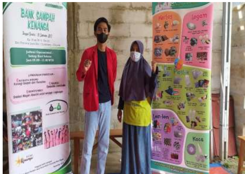
Foto wawancara bersama Kepala Seksi Pengolahan Sampah DLHK Kota Depok