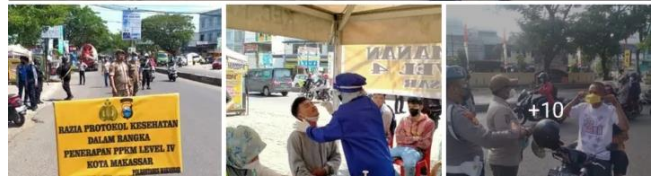
9. Sosialisasi, edukasi dan pengawasan Bersama pak lurah dan pegawai puskesmas