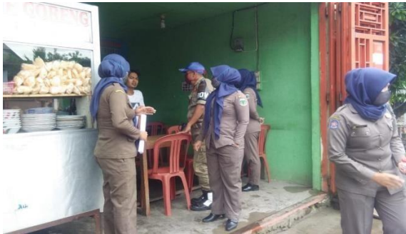
Gambar V.1 Penyuluhan yang dilakukan oleh Satpol PP