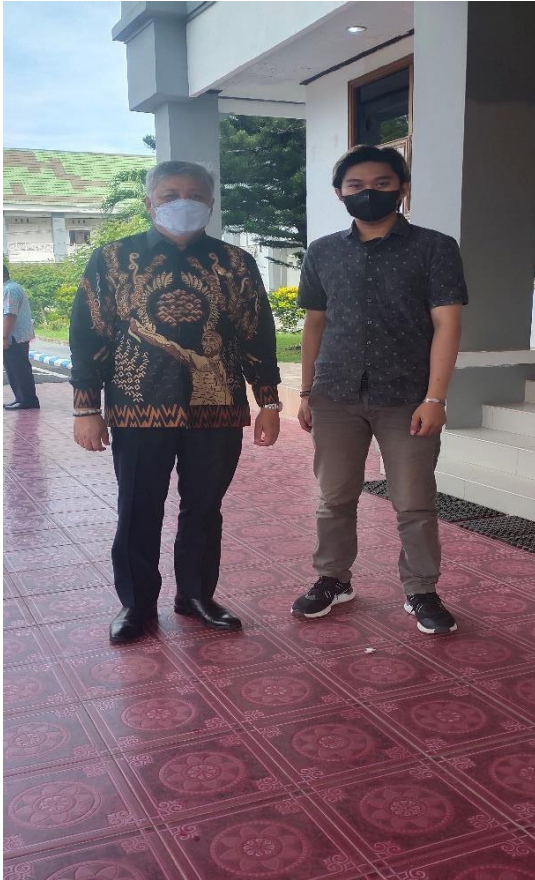
H.A.IRWAN HAMID, S.Sos ( Bupati Pinrang periode 2019 – 2024 )