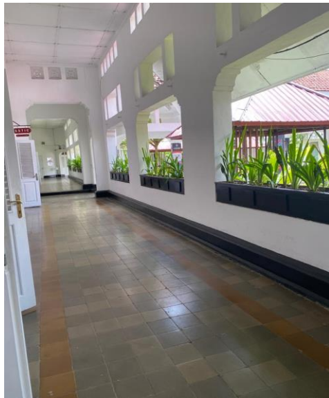
Bagian Dalam Disbudpar