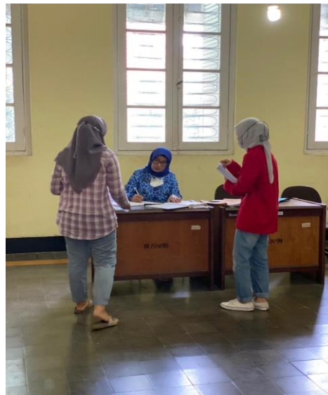
Dokumentasi Penyebaran Kuesioner