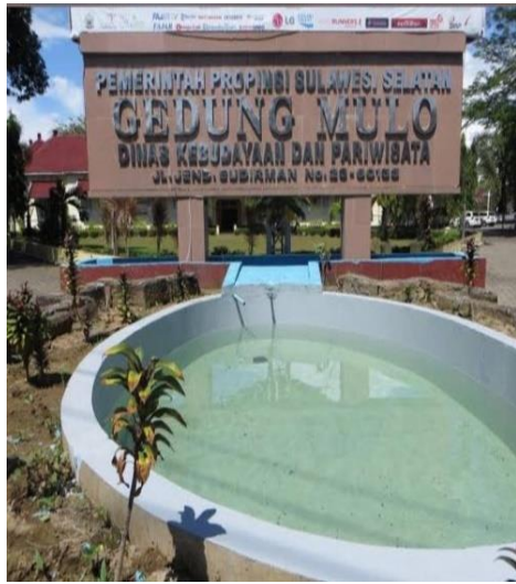
Bagian Depan Disbudpar