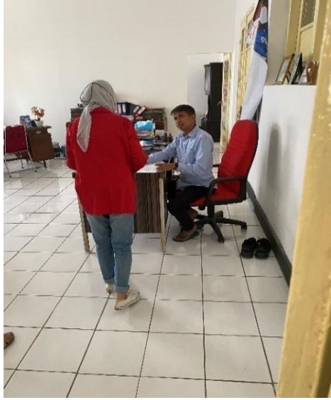
Dokumentasi penyebaran Kuesioner