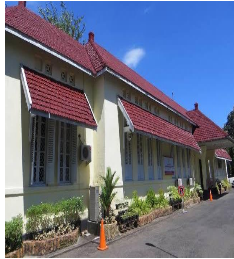
Bagian Depan Disbudpar