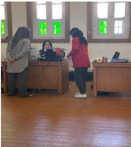
Dokumentasi Pengisian Kuesioner