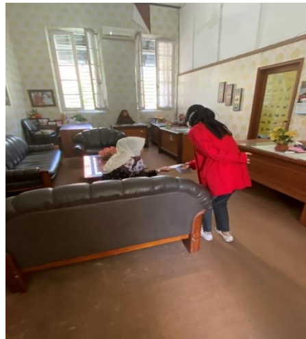
Dokumentasi Pengisian Kuesioner