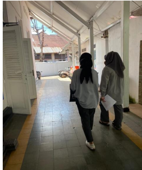
Bagian Dalam Disbudpar