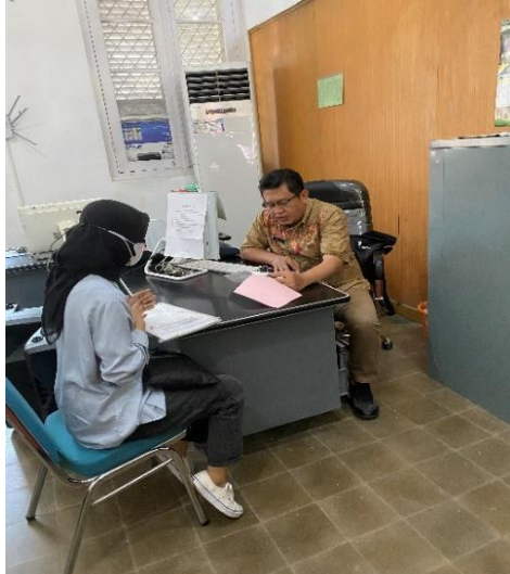
Kepala Sub Bagian Umum, Kepegawaian dan Hukum