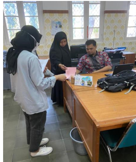
Operator absensi Face Recogiton