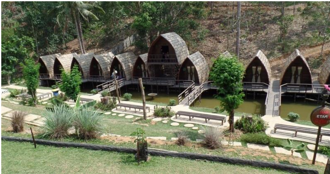
Gambar Objek Wisata LADAYA (Ladang Budaya)