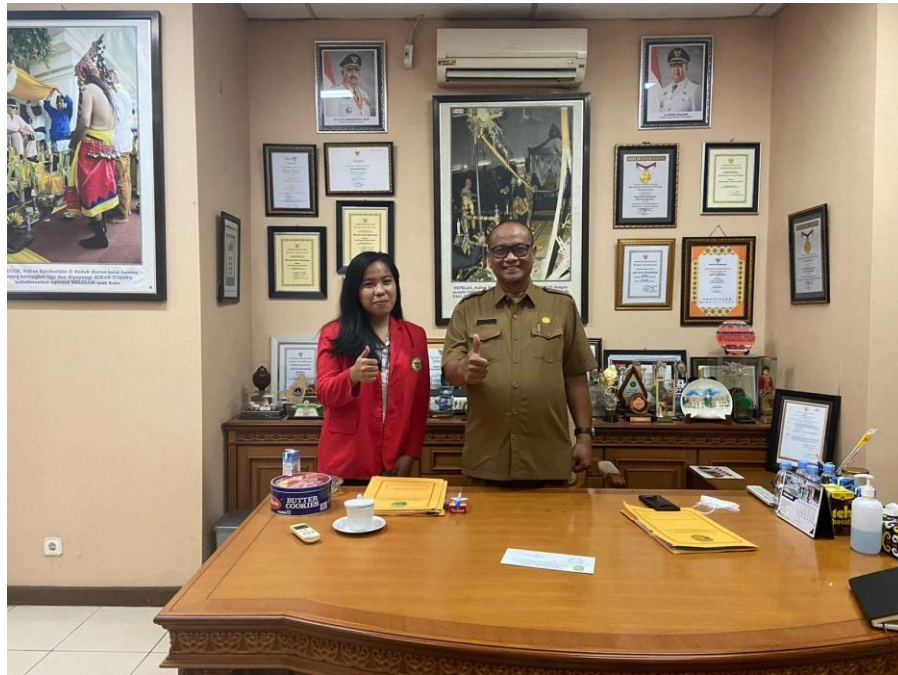
Dokumentasi setelah melakukan wawancara bersama Kepala Dinas Pariwisata Kabupaten Kutai Kartanegara