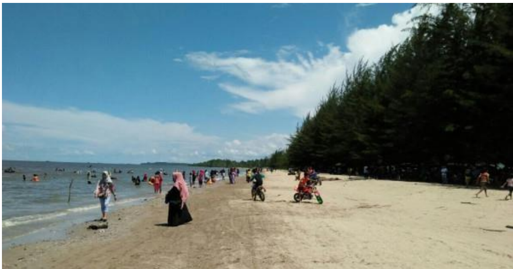
Objek Wisata Pantai Pemedas