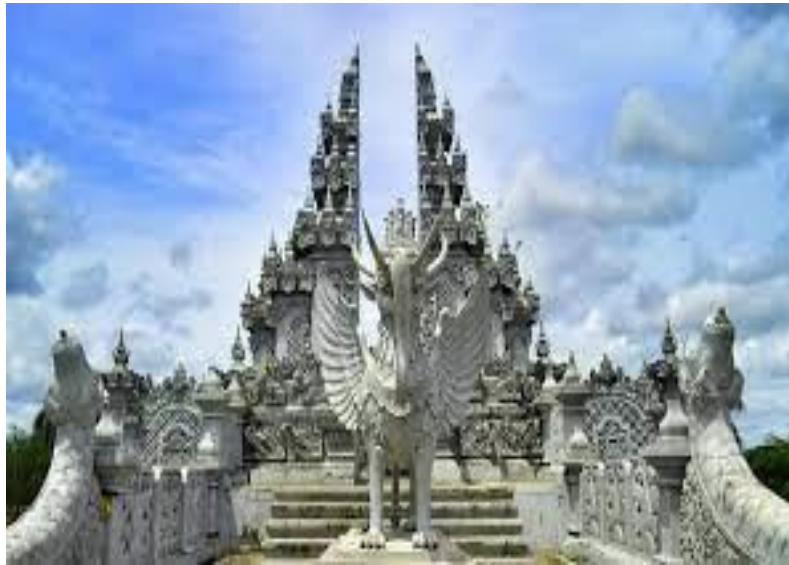
Gambar Objek Wisata Pula Kumala