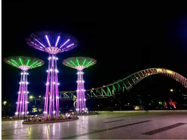
Gambar Objek Wisata Taman Kota Raja