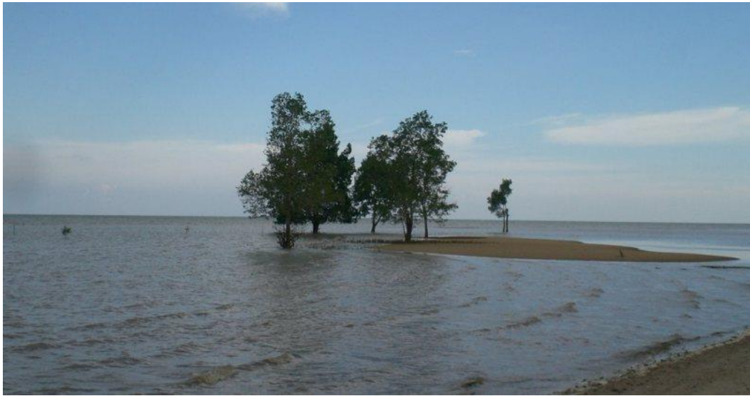
Objek Wisata Pantai Tanah Merah