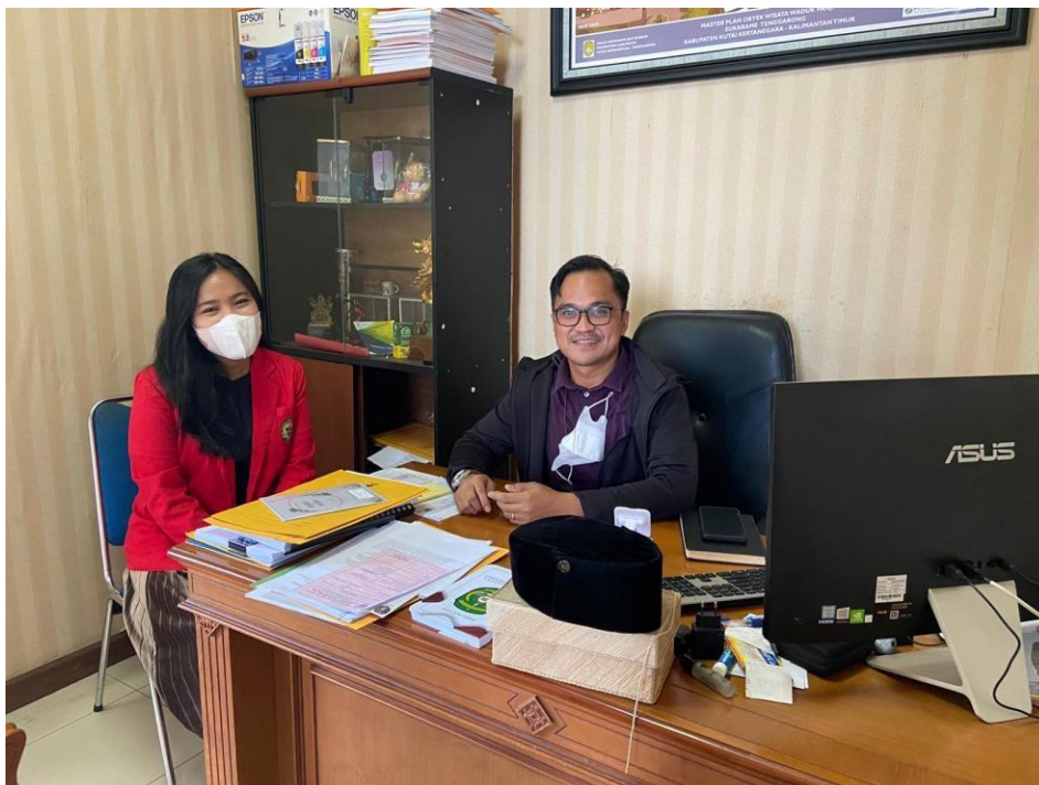
Dokumentasi setelah melakukan wawancara bersama Kepala Bidang Pengembangan Destinasi Pariwisata