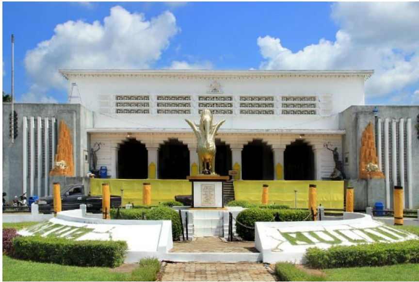
Gambar Objek Wisata Museum Mulawarman