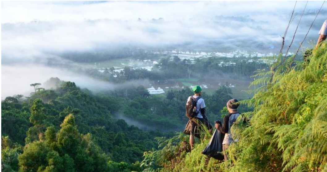
Objek Wisata Bukit Biru