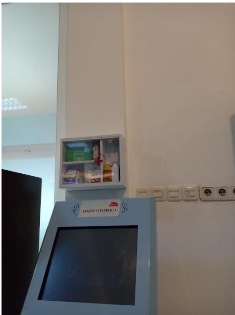
Kotak P3K yang disediakan oleh Kantor Imigrasi Kelas I Makassar