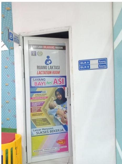
Ruang Laktasi untuk ibu menyusui