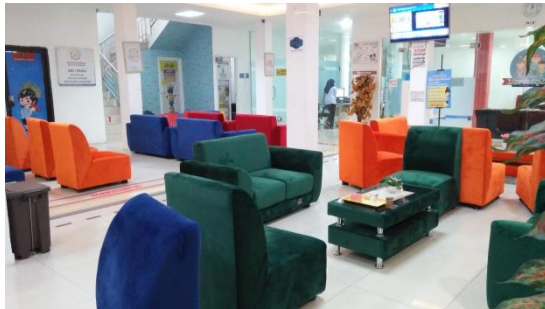
Ruang tunggu pemohon paspor.