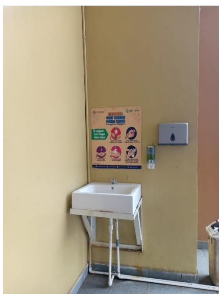
Tempat cuci tangan sebelum memasuki kantor Imigrasi .