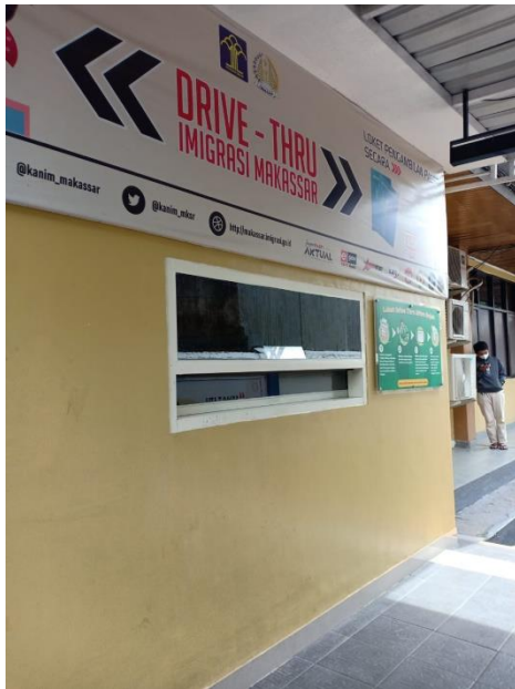
Tempat pengambilan paspor Drive Thru dan untuk pengambilan paspor melalui gojek (Kaisar Lagosi)