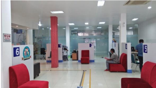
Ruang wawancara dan pengambilan biometric pemohon paspor