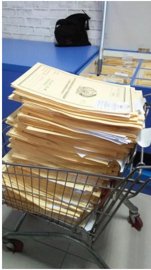
Tumpukan map berkas permohonan paspor yang telah selesai.