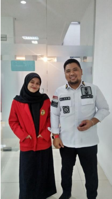
Dokumentasi setelah wawancara bersama Bapak Kepala Sub Seksi Dokumen Perjalanan. 24 Februari 2022