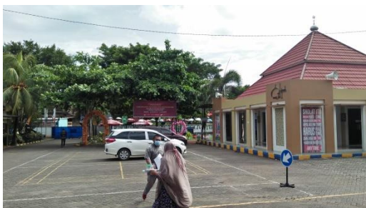
Halaman Parkir, dan Masjid