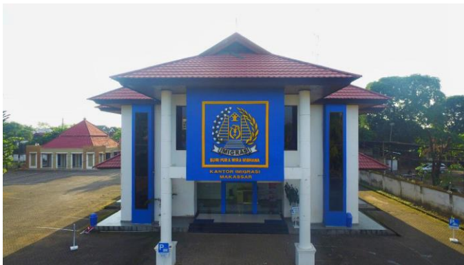
Kantor Imigrasi Kelas I Makassar