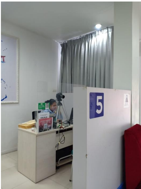
Booth Wawancara yang telah dipasang sekat untuk menjaga jarak antara petugas wawancara dengan pemohon paspor