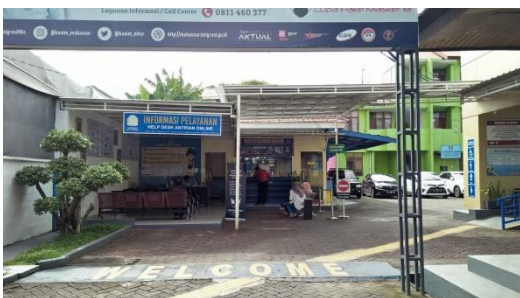
Tempat informasi pelayanan.