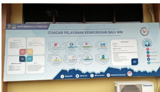
Standar Pelayanan Keimigrasian bagi WNI