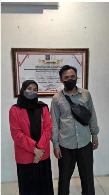
Foto bersama setelah wawancara dengan salah satu pemohon paspor.