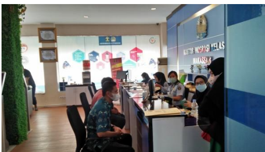
Proses Pelayanan Pemohon Paspor.