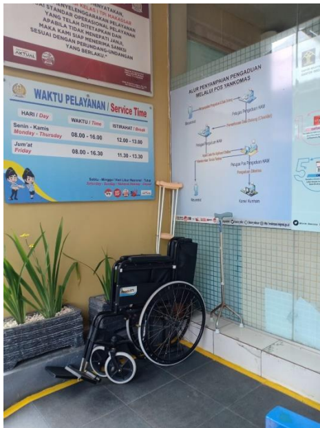
Kursi roda, alat bantu jalan yang disediakan oleh Kantor Imigrasi Kelas I Makassar untuk pemohon paspor yang berkebutuhan khusus.