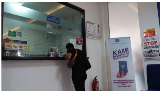
Loket Pengambilan Paspor