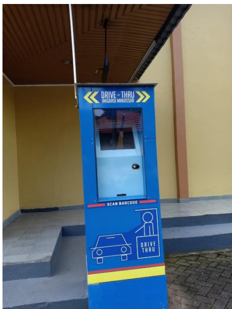
Scan Barcode ntuk pengambilan paspor secara drive thru