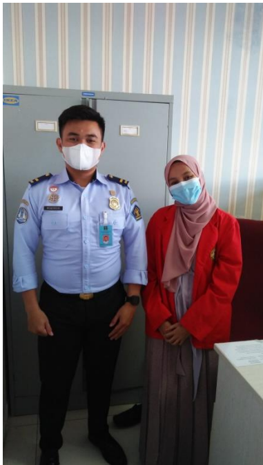
Dokumentasi setelah wawancara bersama Bapak Kepala Seksi Lalu Lintas Keimigrasian. 28 Februari 2022