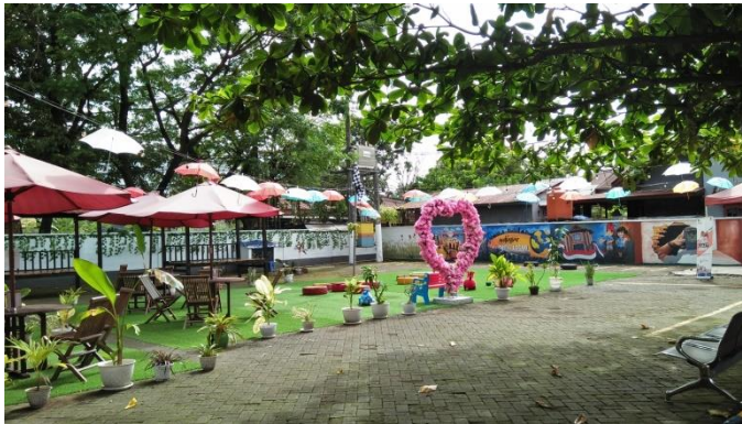
Taman Kantor Imigrasi Kelas I Makassar