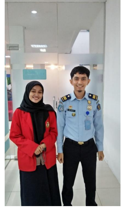
Dokumentasi setelah wawancara dengan Staff Lalu Lintas Perjalanan (LANTASKIM) 24 Februari 2022