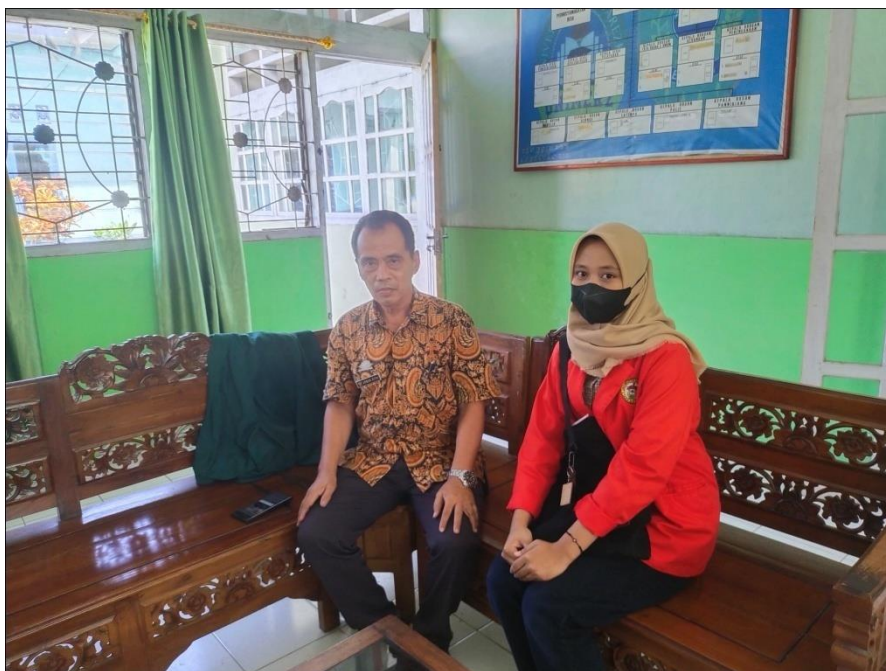
Wawancara dengan Kepala Desa Madello pada tanggal 07 April 2022