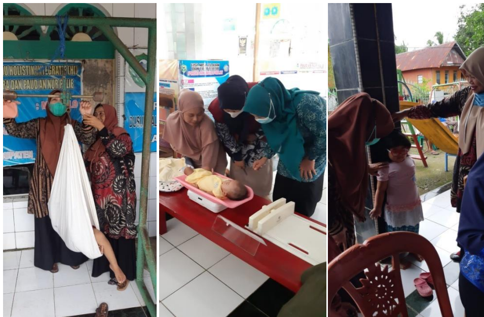
Kunjungan ke posyandu