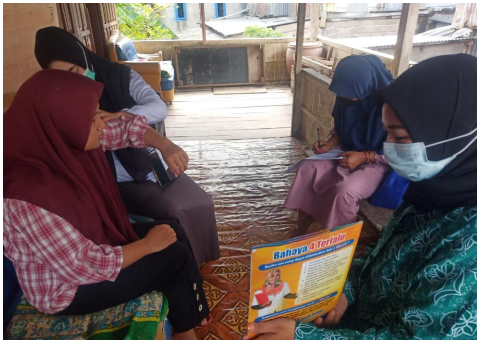
Edukasi kepada calon pengantin tentang 4 bahaya pernikahan usia muda. Misalnya bahaya melahirkan di usia muda dapat meningkatkan resiko anak stunting.