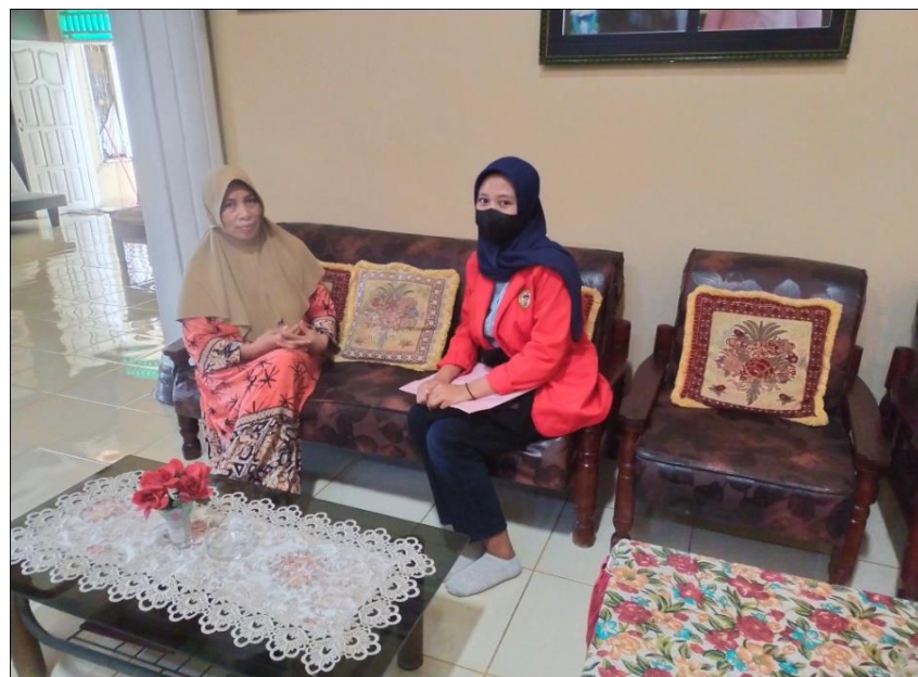
Wawancara dengan ketua PKK Desa Madello pada tanggal 06 April 2022