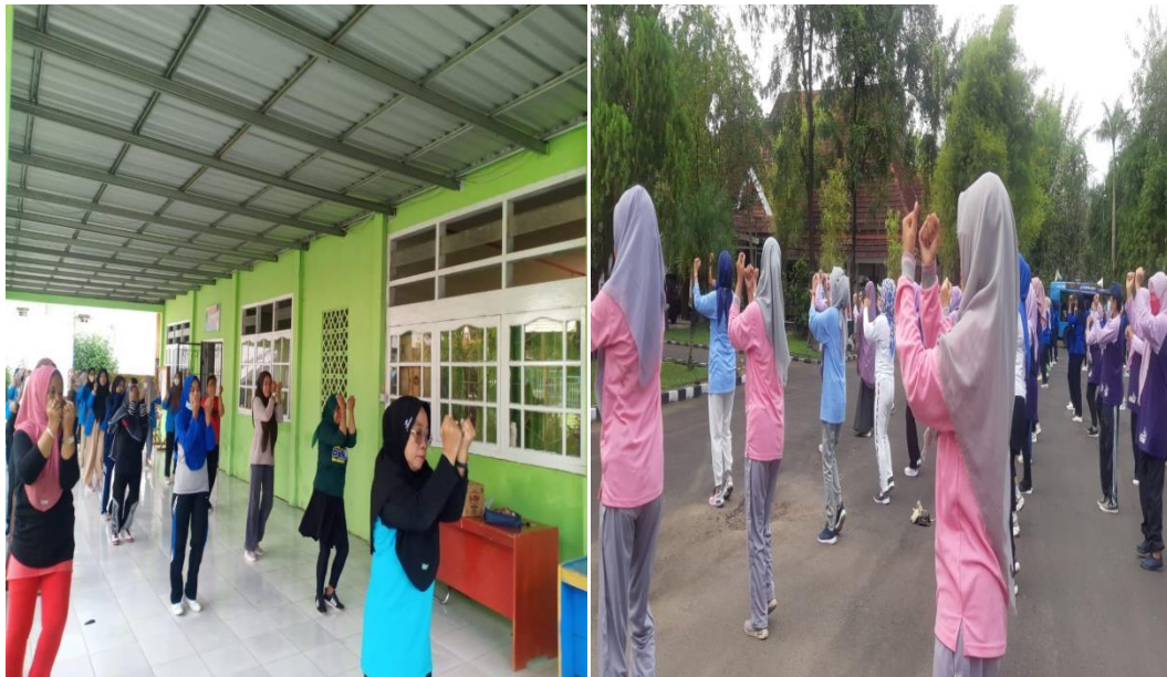
Kegiatan senam rutin setiap hari sabtu di minggu kedua