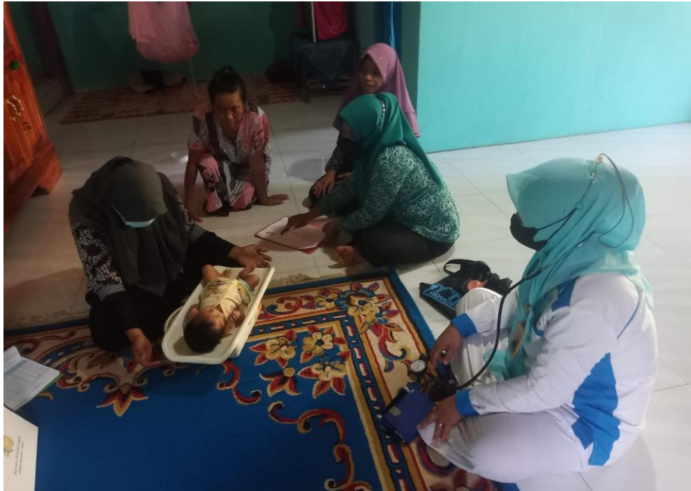
Edukasi makanan gizi seimbang, imunisasi dasar dan KB untuk ibu pasca salin