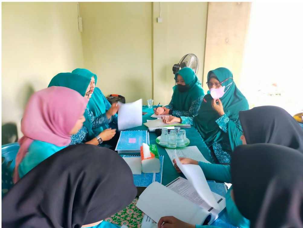
Penyuluhan bagi TP-PKK Desa