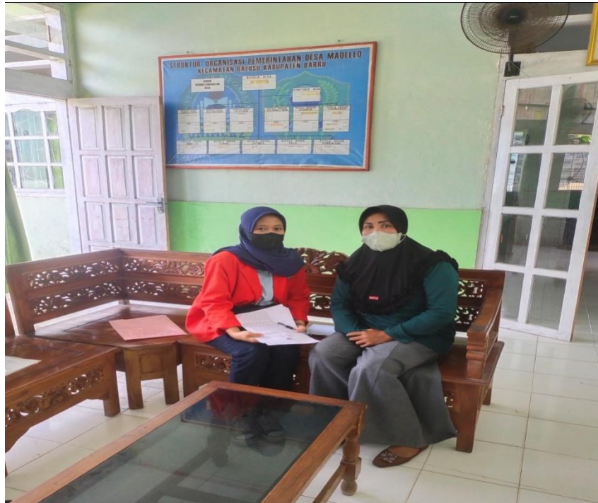
Wawancara dengan wakil ketua PKK Desa Madello pada tanggal 06 April 2022