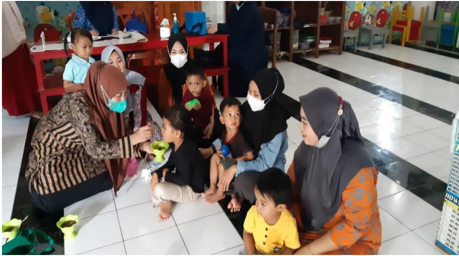
Kunjungan ke PAUD dan memberi makanan tambahan