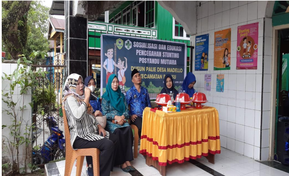
Sosialisasi dan edukasi pencegahan stunting bersama TP-PKK Kecamatan Balusu dan Dinas Kesehatan