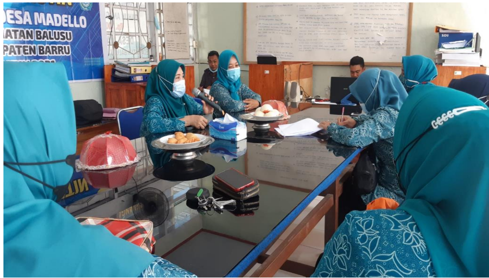
Rapat pertemuan PKK di Kantor Desa Madello