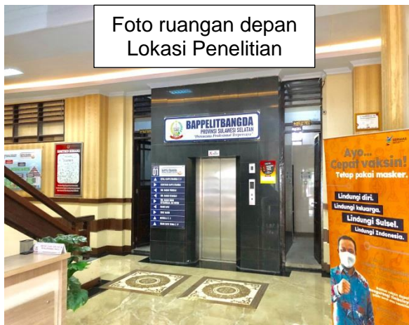
Foto ruangan depan Lokasi Penelitian