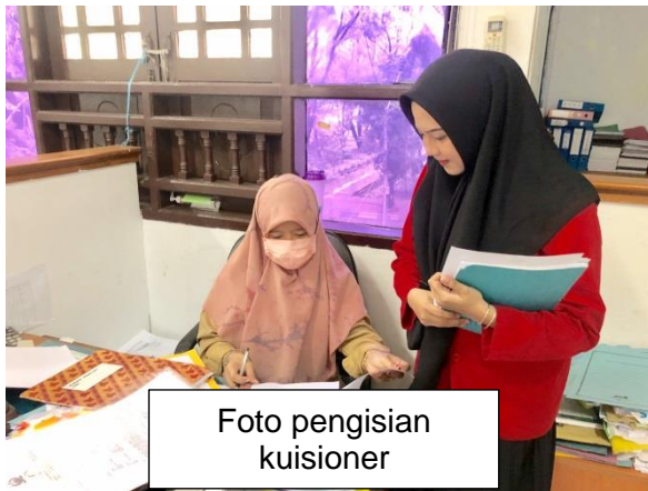
Foto pengisian kuisisioner