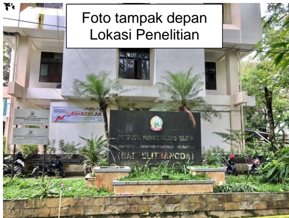
Foto tampak depan Lokasi Penelitian