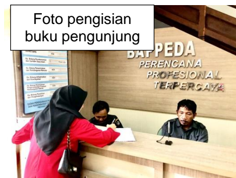
Foto pengisian buku pengunjung