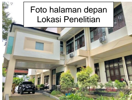
Foto halaman depan Lokasi Penelitian