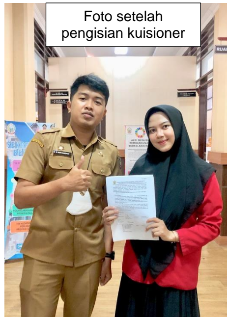
Foto setelah pengisian kuisisioner