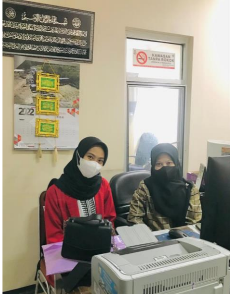
Wawancara dengan Staff/ Pegawai di Dinas Ketenagakerjaan Kota Makassar