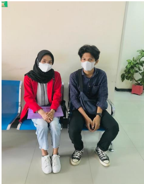
Dokumentasi dengan Salah Satu Pengguna Aplikasi Sisnaker