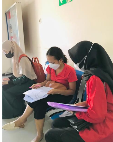
Dokumentasi Peneliti Mendampingi Responden dalam Pengisian Kuesioner