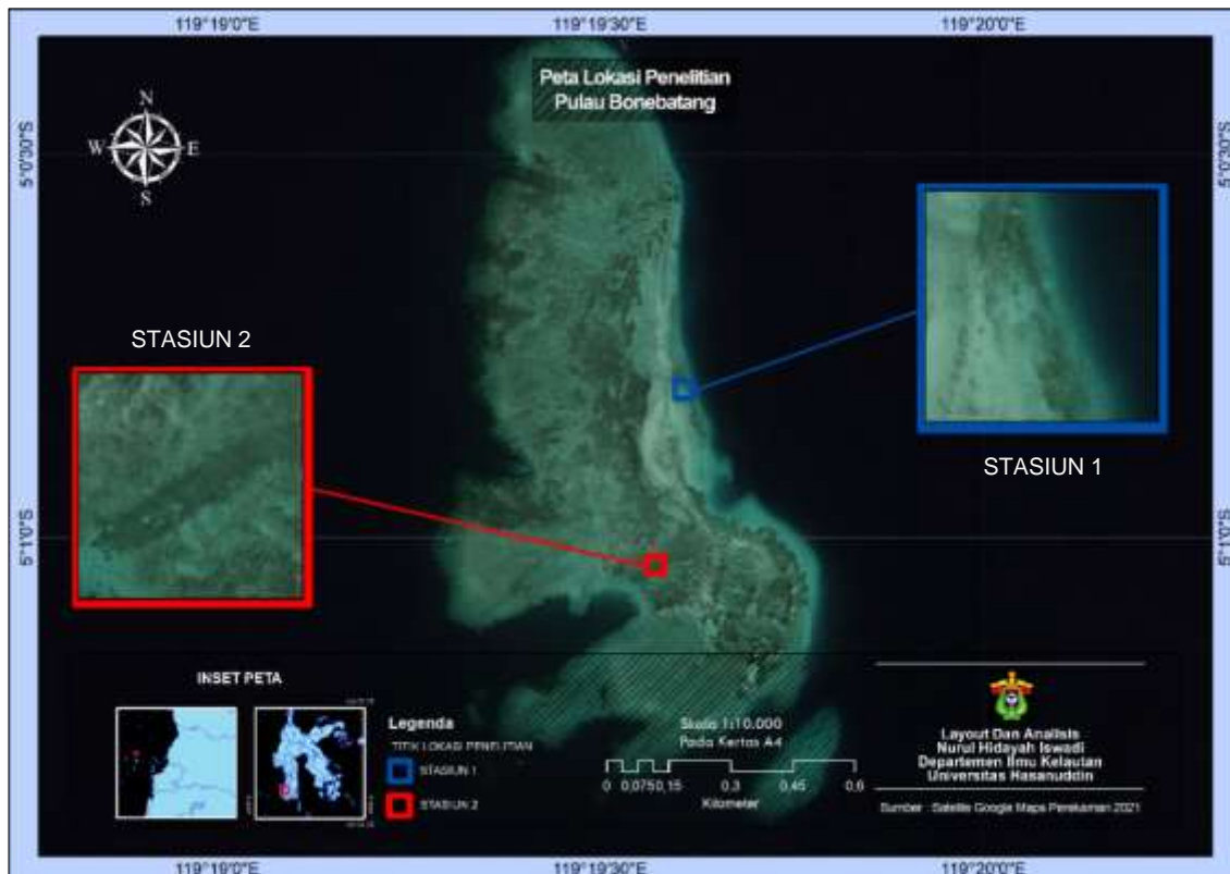
Gambar 1. Peta lokasi penelitian, Pulau Bonebatang dengan dua Stasiun yang direncanakan (Sumber: satelit google maps perekaman 2021).

Penelitian ini dilakukan pada bulan Februari 2022 di Pulau Bonebatang Makassar tepatnya di sebelah timur pulau (Stasiun 1) dan di sebelah selatan (Stasiun 2) (Gambar 1). Sampel dianalisis di Laboratorium Ekologi Laut, Laboratorium Oseanografi Kimia Laut, dan Laboratorium Oseanografi Fisika dan Geomorfologi Pantai, Fakultas Ilmu Kelautan dan Perikanan, Universitas Hasanuddin.