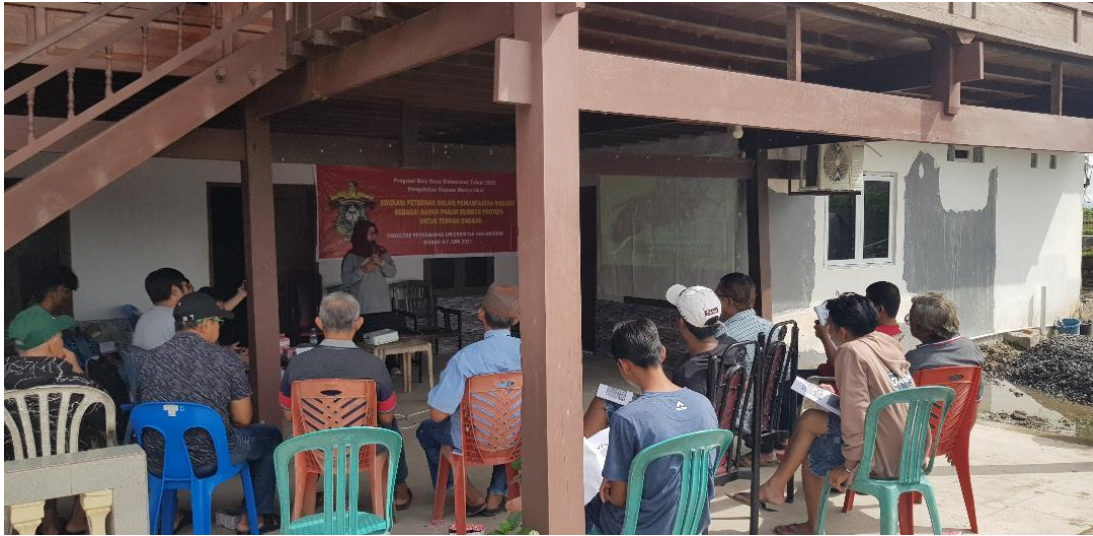
Gambar 2. Penyuluhan Budidaya Maggot sebagai Bahan Pakan Ternak Unggas

Nampak jelas dalam gambar seperti apa fase hidup BSF yang dilewati beserta karakteristik dari tiap fasenya. Tiap waktu yang dijalani pada tiap fasenya bersifat rata-rata (tidak mutlak) dan ini dipengaruhi oleh berbagai faktor antara lain ialah keadaan suhu serta kelembaban dan makanan yang dikonsumsi.