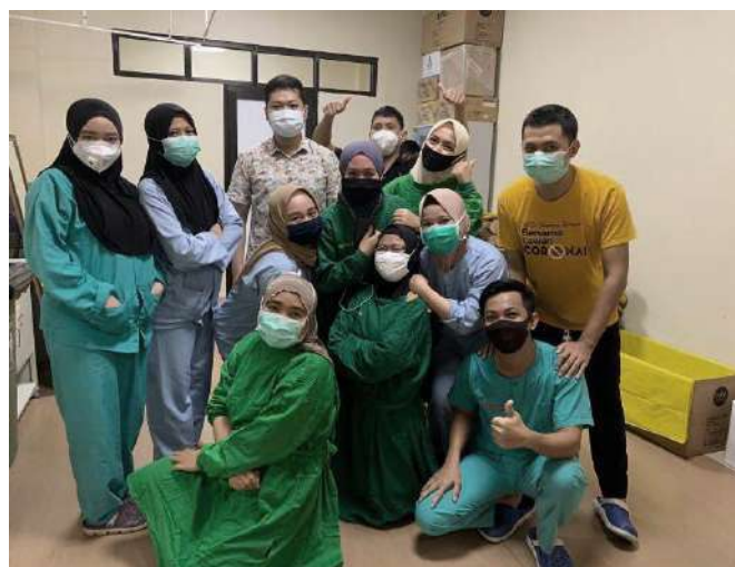
Perawat RSUD Sayang Rakyat Kota Makassar setelah melakukan pengisian kuesioner sebelum melaksanakan tugas.