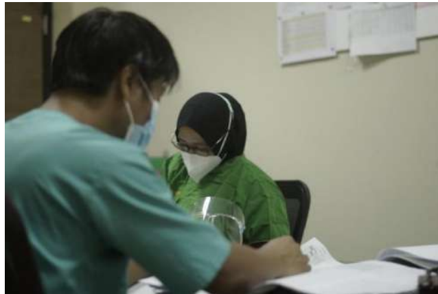
Perawat RSUD Sayang Rakyat Kota Makassar sedang melakukan pengisian kuesioner di ruang istirahat.