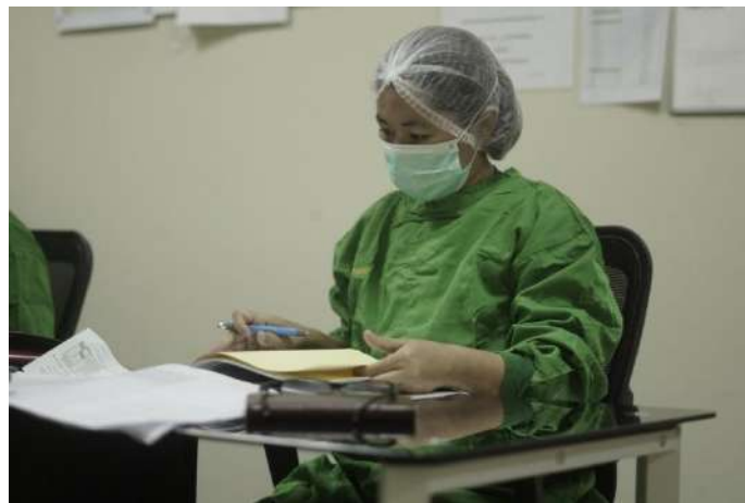
Perawat RSUD Sayang Rakyat Kota Makassar sedang melakukan pengisian kuesioner di sela-sela waktu kerja.