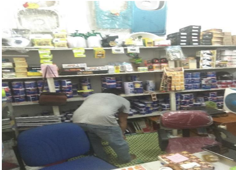
Komditas bahan bangunan produk buatan Indonesia dan Malaysia