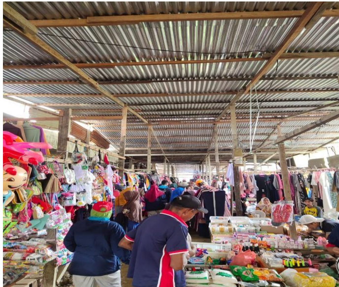
Kondisi fisik pasar di Desa Aji Kuning