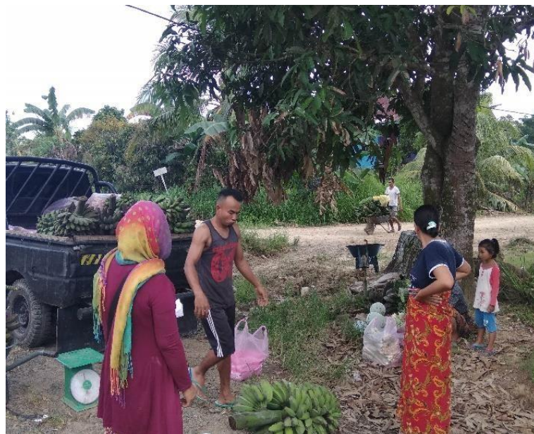
Proses pengambilan komoditas buah di Desa Bukit harapan untuk dikirim ke Bandar Tawau Malaysia