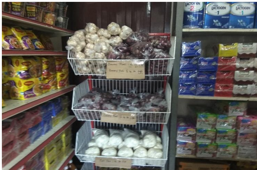
Komoditas bawang merah dan bawang putih produk dari Bandar Tawau Malaysia