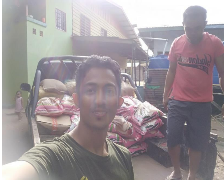
Proses pengangkutan barang dari jongkong menuju kedai