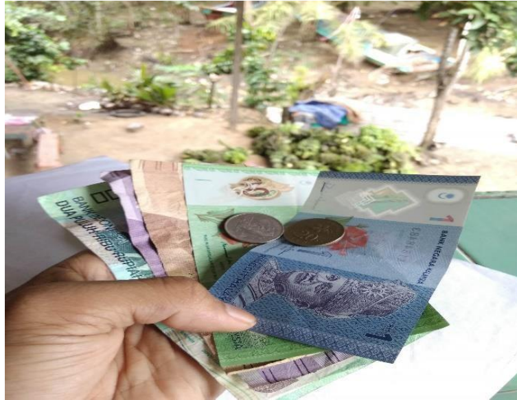
Mata uang ringgit dan rupiah yang digunakan dalam transaksi dagang pada masyarakat Desa Aji Kuning