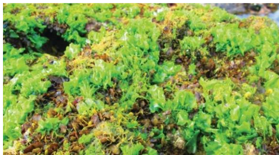
Gambar 1. Ulva lactuca

Adapun klasifikasi Ulva lactuca adalah sebagai berikut: (Kasanah et al. , 2018).