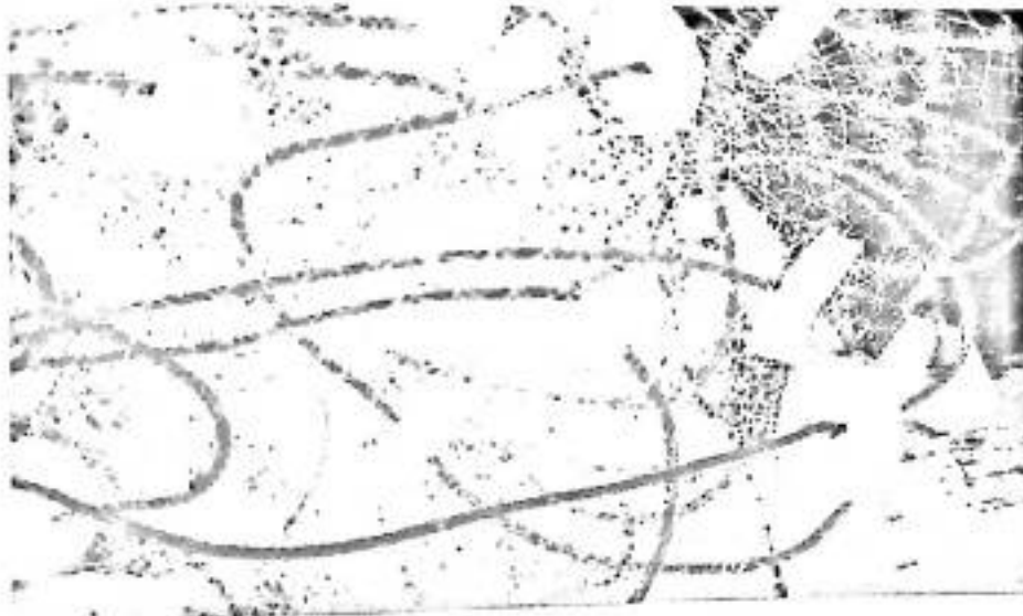
Gambar 3. Pelampung yang digunakan oleh nelayan di perairan Polewali Mandar Sedangkan letak jaring di perairan dapat dilihat pada gambar 3 dibawah ini

Pelampung yang digunakan pada alat tangkap gill net terbuat dari karet gabus yang tidak menyerap air dengan panjang 5 cm dan tebal 3 cm berbentuk ellips yang dipasang pada tali ris atas dengan jarak masing-masing antar pelampung 0,5 m dan bola pelampung yang terbuat dari bahan sintetis, yang terletak diantara penyambungan satu jaring. Pemberat yang digunakan terbuat dari campuran semen berbentuk silindris dengan panjang 3 cm dan diameter 2,5 cm yang dipasang pada tali ris bawah dengan jarak masing-masing pemberat 0,5 m, berat dari tiap satu pemberat adalah 36,5 gram.