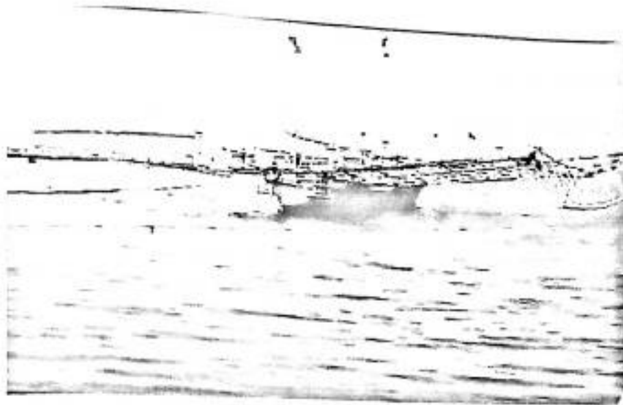
Gambar 5. Alat Tangkap Bagan Perahu yang Digunakan oleh Nelayan di Polewali Mandar

Adanya bangunan kayu yang berbentuk rangka merupakan ciri khas dari unit alat tangkap bagan perahu. Ukuran panjang dan lebar rangka bagan adalah 20x17 m yang dirangkai pada kedua sisi perahu, seperti halnya dalam pembuatan perahu bagan. Kayu yang digunakan dalam pembuatan rangka juga dipilih jenis kayu yang berkualitas yang dipesan khusus dari luar daerah Polewali Mandar. Balok kayu yang melintang ukurannya lebih besar yaitu 15x20 m dan panjangnya kurang lebih 17 m perbatang, sedangkan balok kayu yang membujur memiliki ukuran berkisar 5x10 cm dengan ukuran panjang yang tidak bersyarat.