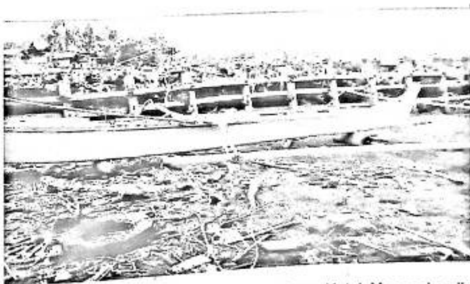
Gambar 2. Kapal Yang Digunakan Oleh Nelayan Untuk Menangkap Ikan

Alat tangkap yang digunakan selama penelitian adalah jaring insang permukaan dengan panjang keseluruhan 45 m, dan lebar 5,5 m terbuat dari bahan monofilament (tasi), yang warnanya transparan dengan ukuran mesh size 1 3/4inci, sedangkan tali yang digunakan untuk merangkai jaring satu sama lain yang terbuat dari bahan polyethelene nomor 4 berdiameter 5 mm yang berwarna biru, tali ini merupakan perpanjangan dari tali ris atas dan bagian bawahnya dipasang pemberat.