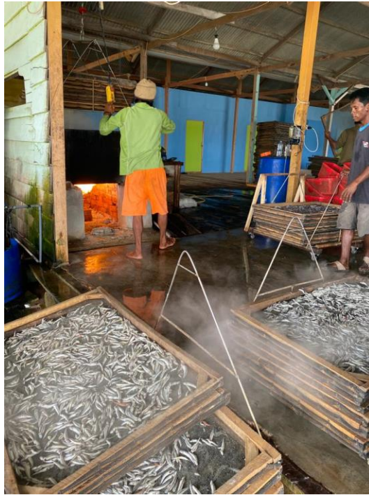
Proses pemasakan bahan baku menggunakan garam