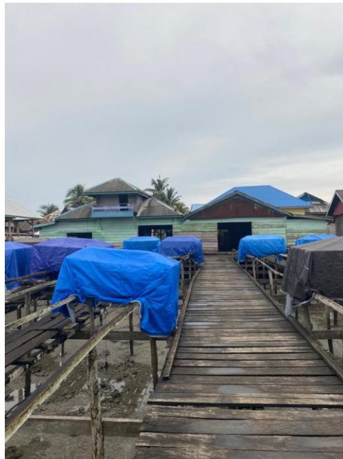
Tampak depan Basecamp CV. XYZ