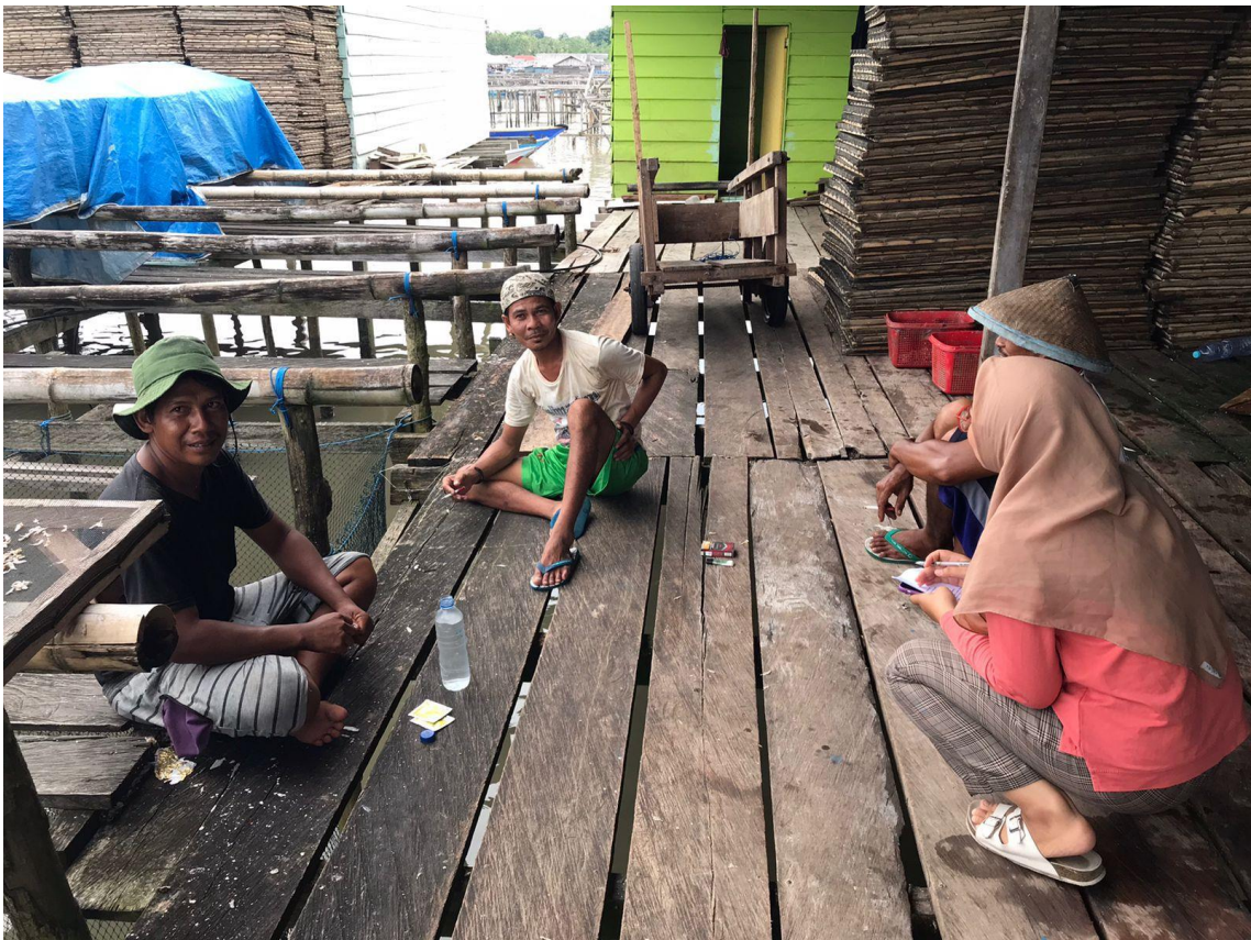
Wawancara dengan beberapa karyawan CV. XYZ