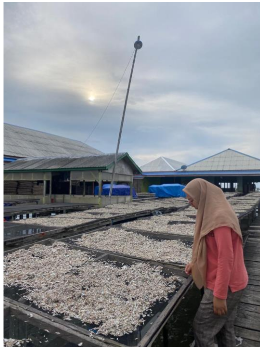
Proses pengeringan dibawah matahari