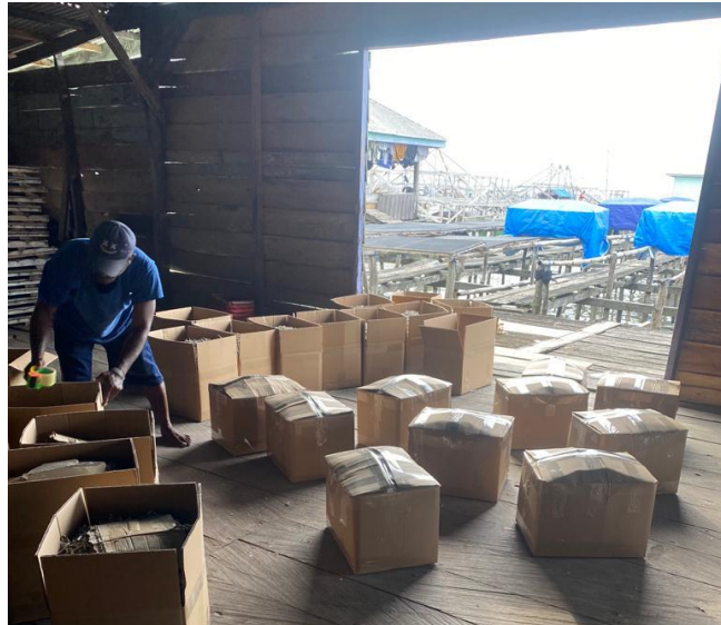
Proses packing ikan teri nasi dalam dos dan tampak packingan produk ikan teri nasi CV. XYZ