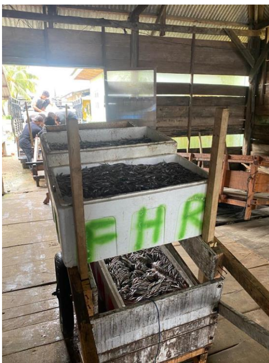
Bahan baku ikan teri nasi datang dari bagan