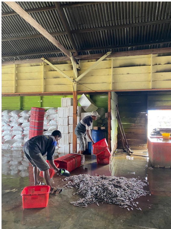
Proses pensortiran dan pencucian bahan baku