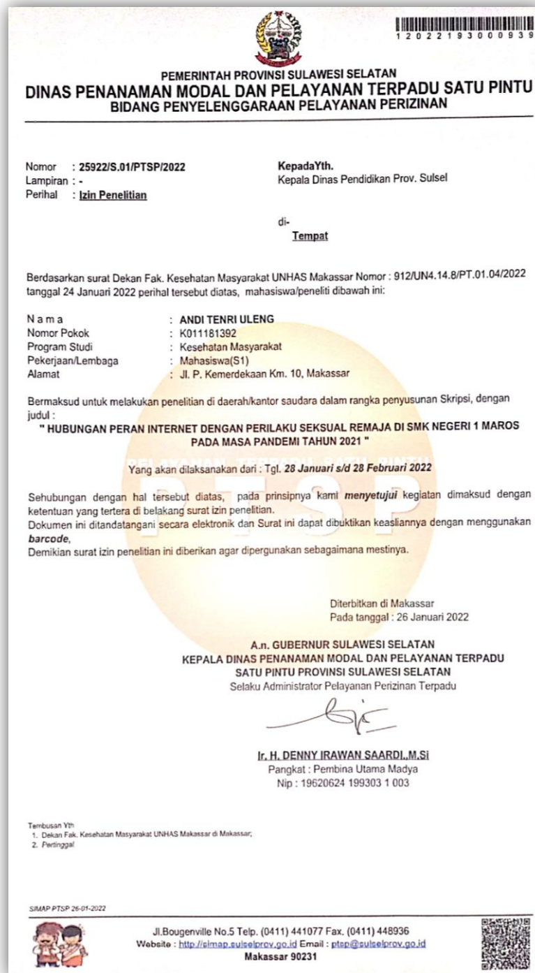
Gambar 2. Surat Izin Penelitian Walikota