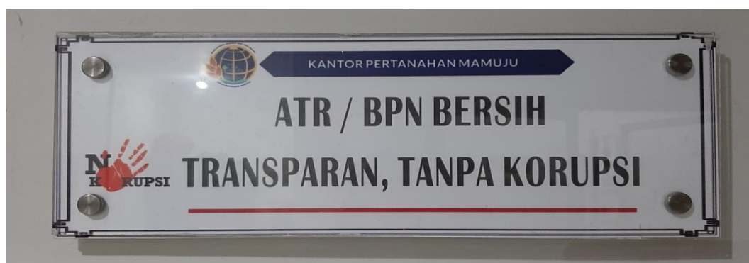
Poster bersih transparan, tanpa korupsi