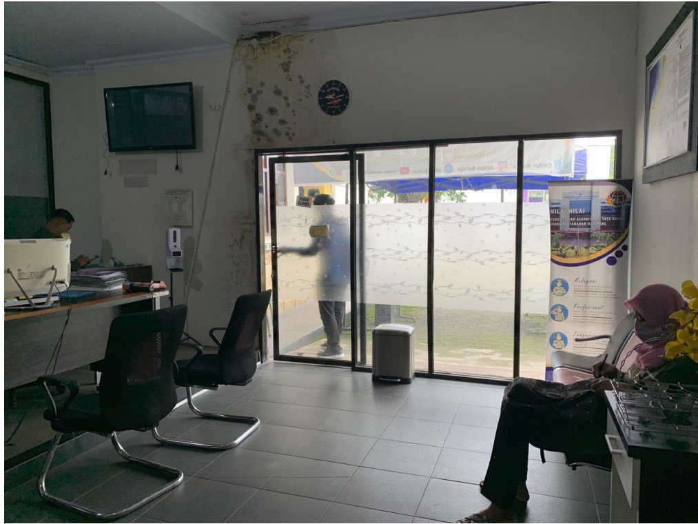
Pintu masuk loket (tampak dari dalam)