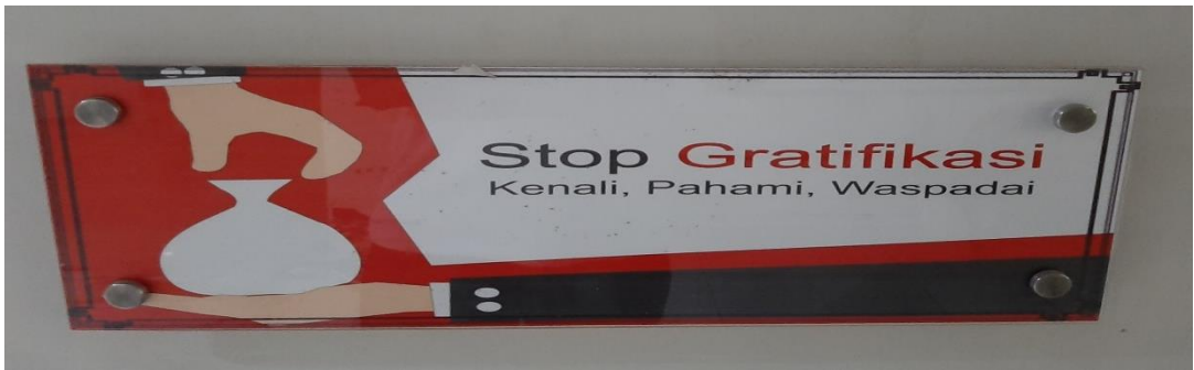
Poster stop gratifikasi