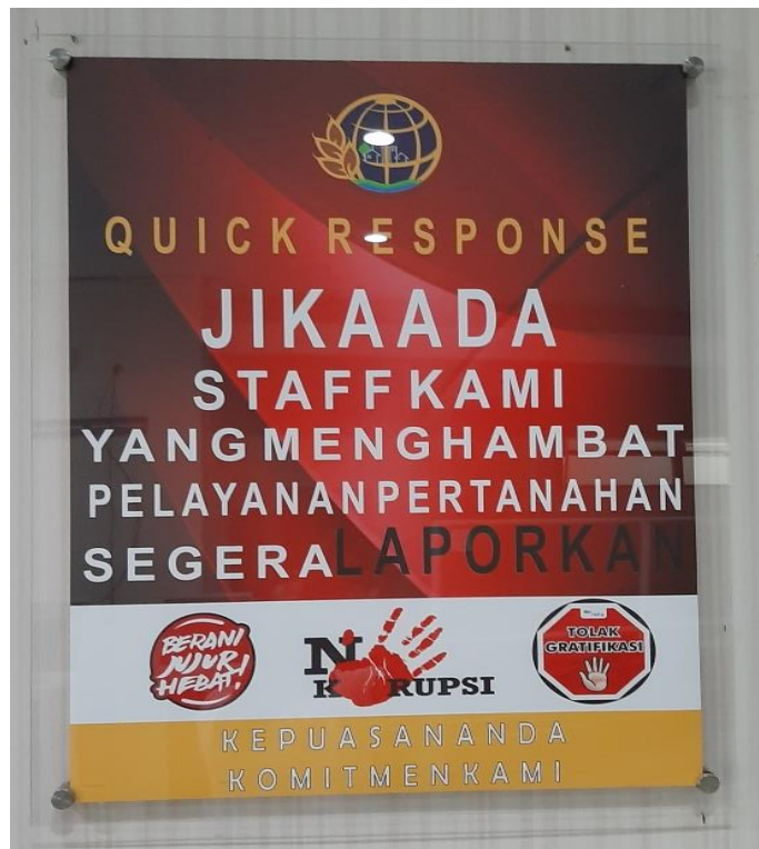
Poster anti korupsi