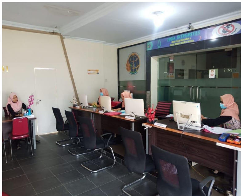
Keadaan loket di Kantor Pertanahan Kabupaten Mamuju pada hari jumat tanggal 10 Desember 2021