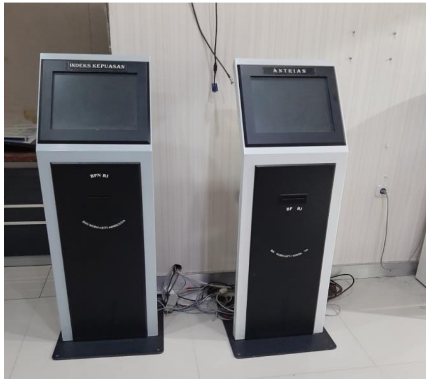
Mesin indeks kepuasan dan mesin nomor antrian yang rusak