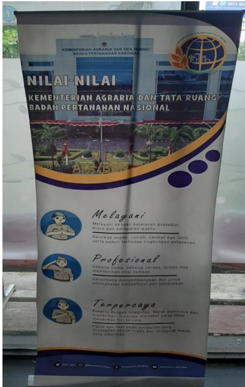
Poster nilai – nilai Kementerian Agraria dan Tata Ruang Badan Pertanahan Nasional