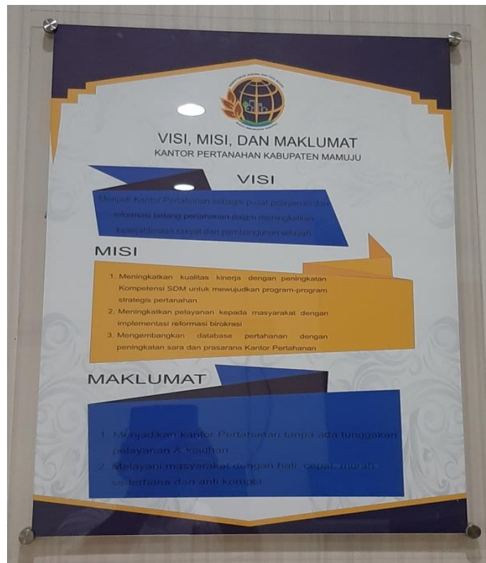
Visi, misi dan maklumat Kantor Pertanahan Kabupaten Mamuju