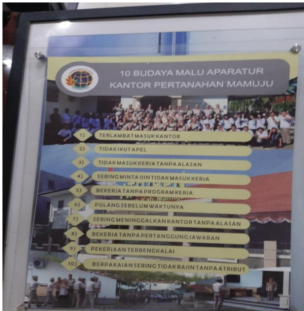
Poster 10 budaya malu aparaturn Kantor Pertanahan Mamuju