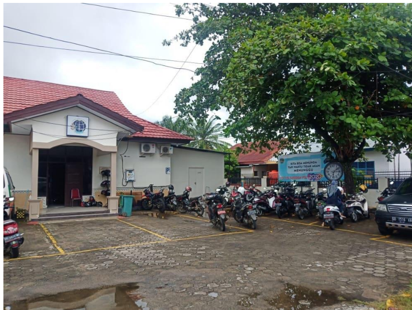
Parkiran Kantor Pertanahan Kabupaten Mamuju