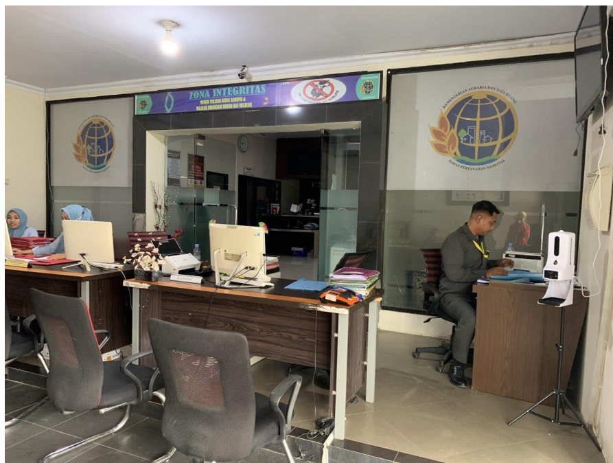
Keadaan loket di Kantor Pertanahan Kabupaten Mamuju pada hari Rabu tanggal 8 Desember 2021