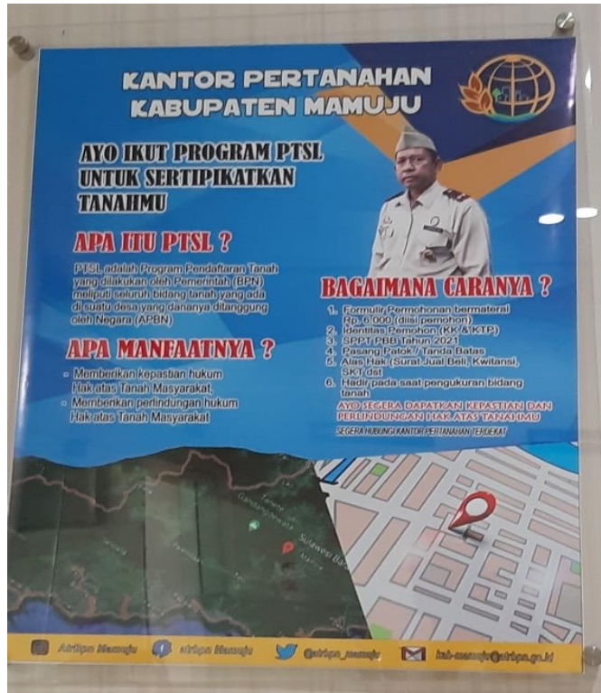
Poster informasi program PTSL