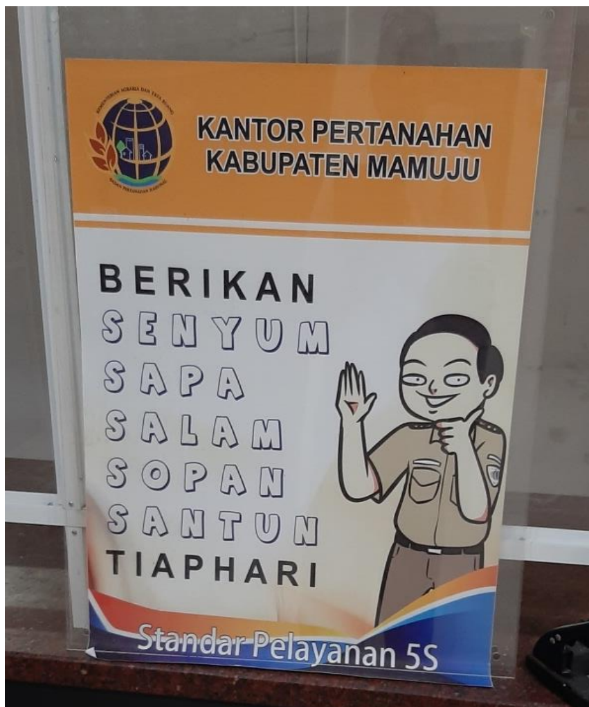
Poster standar pelayanan 5S