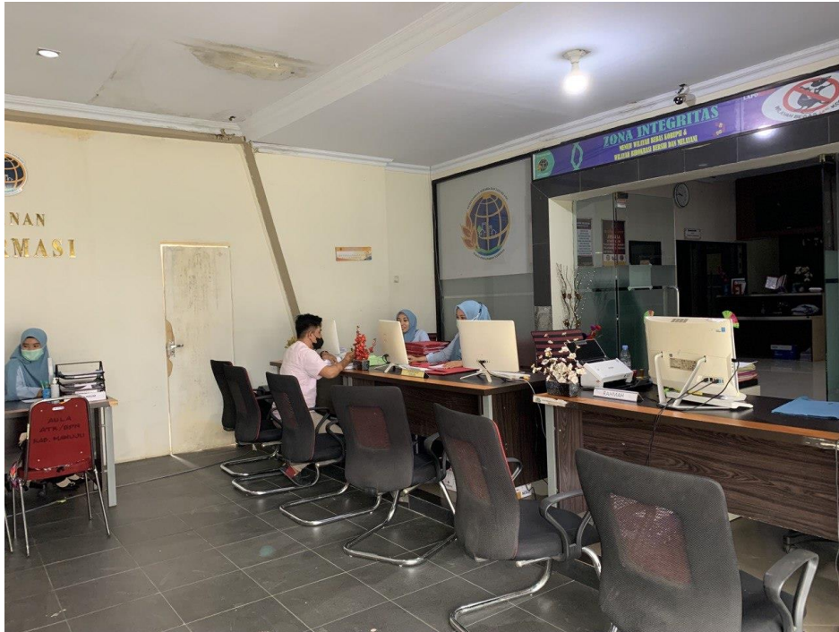
Keadaan loket di Kantor Pertanahan Kabupaten Mamuju pada hari Kamis tanggal 9 Desember 2021