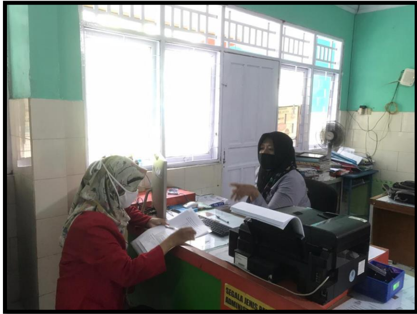
Wawancara dengan Pengurus Shelter Warga di Kel. Batua