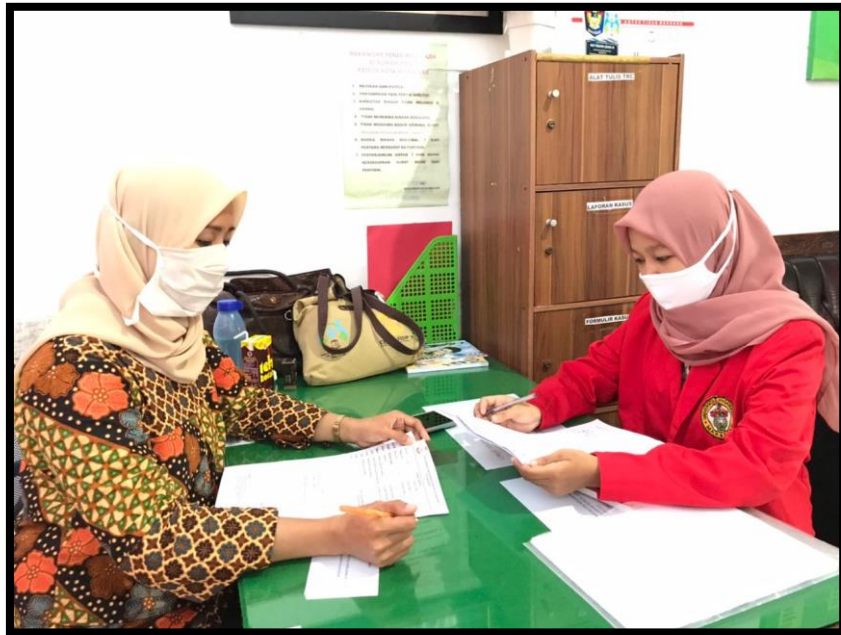
Wawancara dengan staff P2TP2A DP3A Kota Makassar