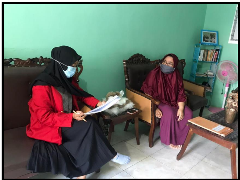
Wawancara dengan Pengurus Shelter di Kel. Manggala