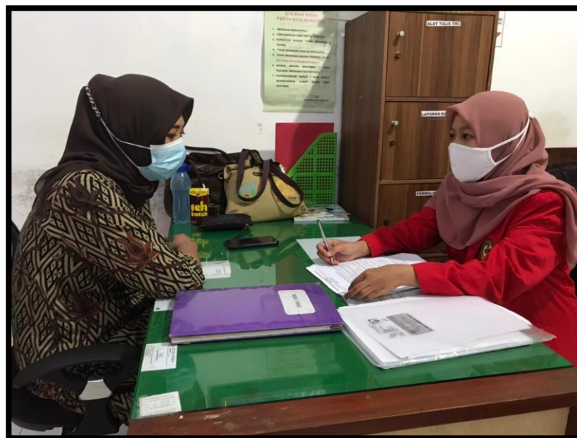
Wawancara dengan Kepala Seksi Pemberdayaan Perempuan