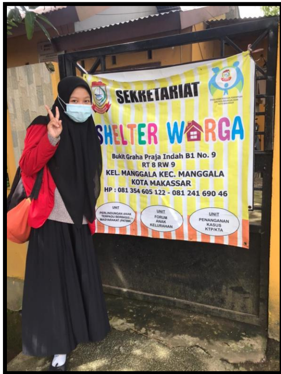
Sekretariat Shelter Warga di Kecamatan Manggala