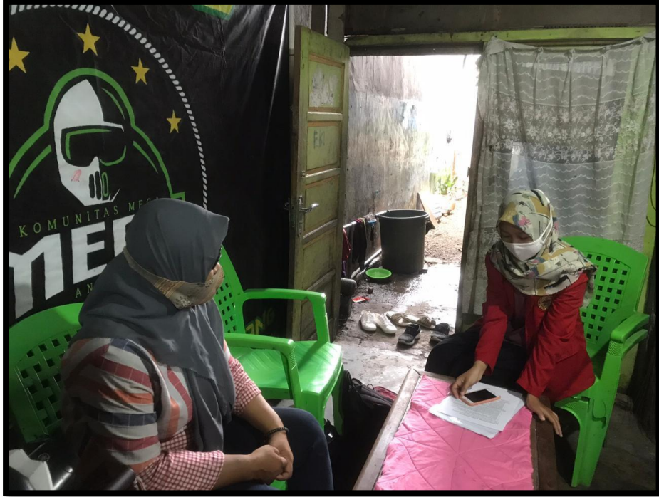
Wawancara dengan Masyarakat Pengguna Jasa Shelter Warga