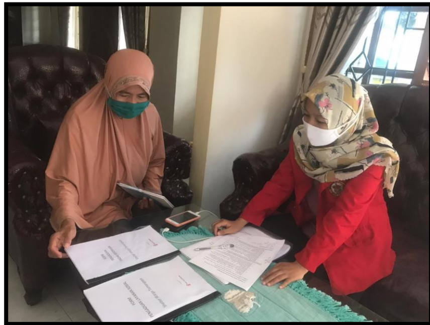
Wawancara dengan Pengurus Shelter Warga di Kel. Tamangapa