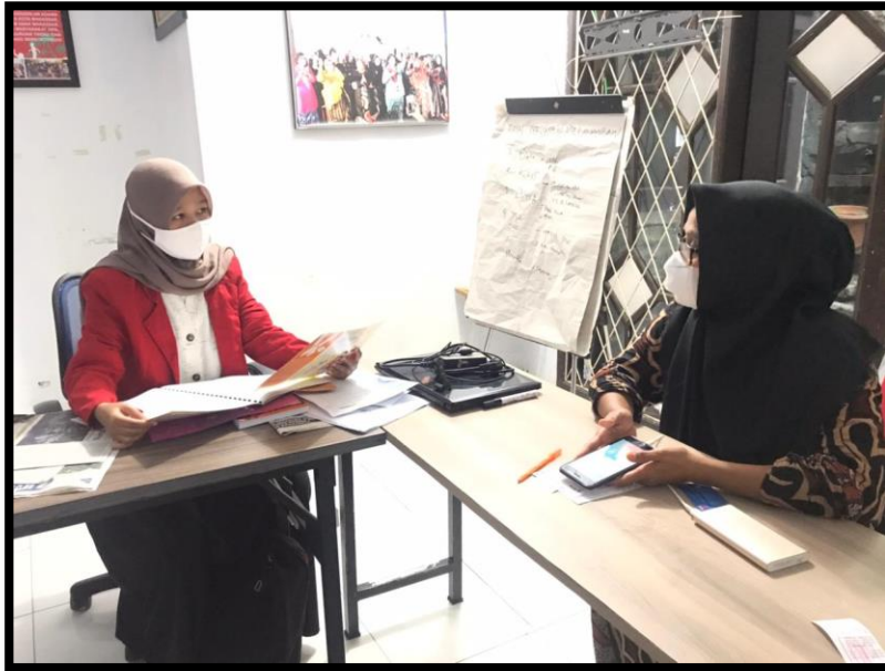
Wawancara dengan Ibu Kadis Dinas Pemberdayaan Perempuan dan Perlindungan Anak Kota Makassar