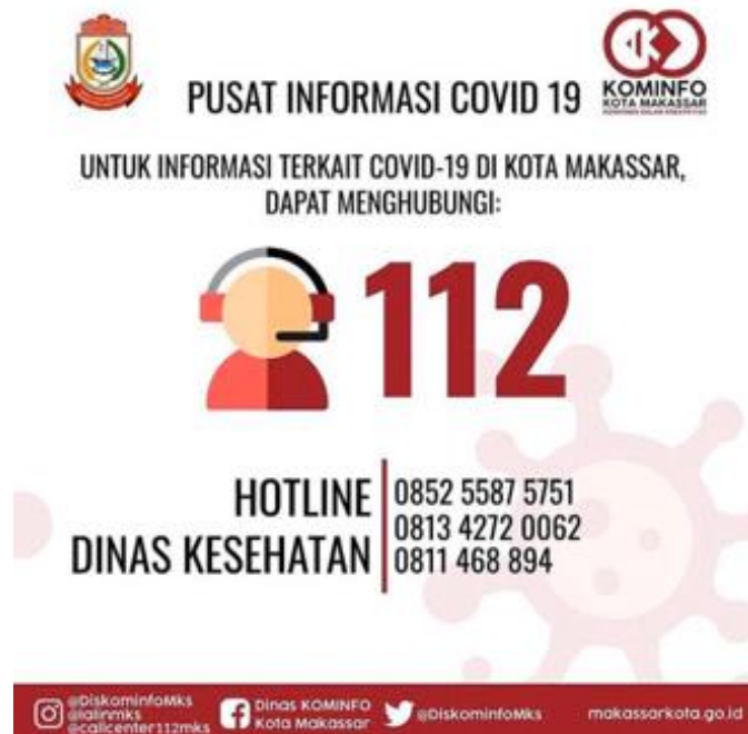
Gambar hotline Covid Diskominfo Makassar