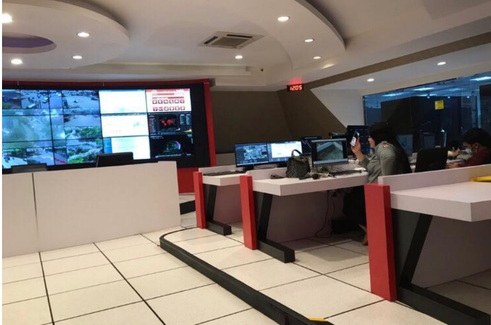
Ruangan Operation Room di Kot Makassar