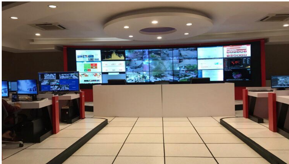
Ruangan Operation Room di Kota Makassar