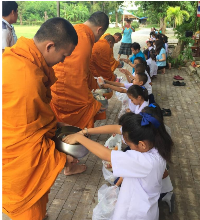
Gambar 19. Penyerahan sembako ke setiap Mong/Biksu