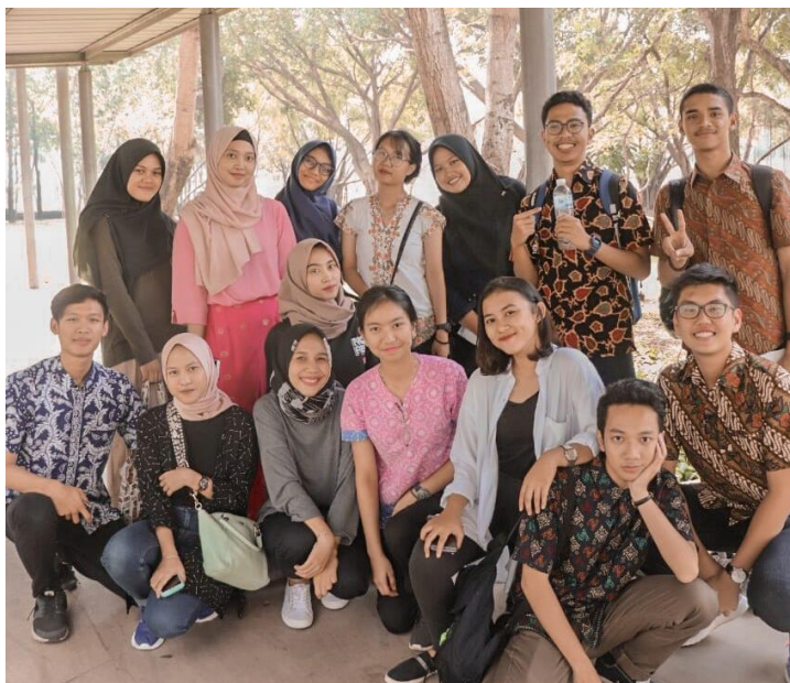
Gambar 11. Peserta program dari seluruh daerah di Indonesia