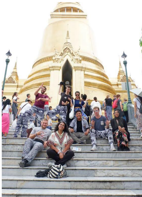
Gambar 27. Mengisi akhir pekan bersama dengan peserta dari setiap negara