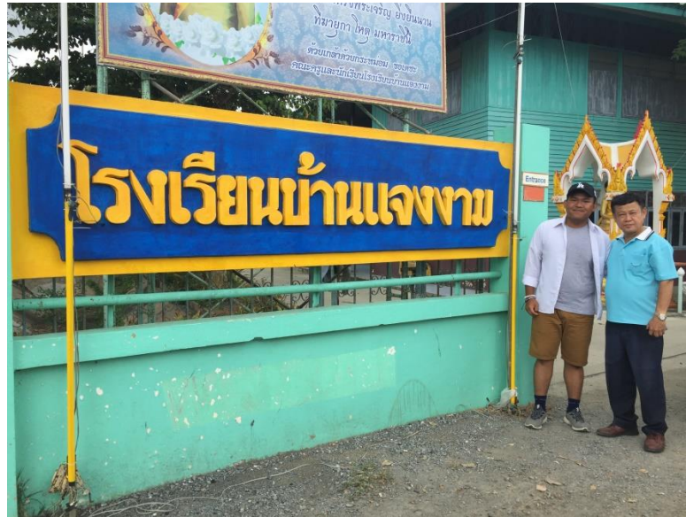
Gambar 24. Bersama dengan orang tua angkat