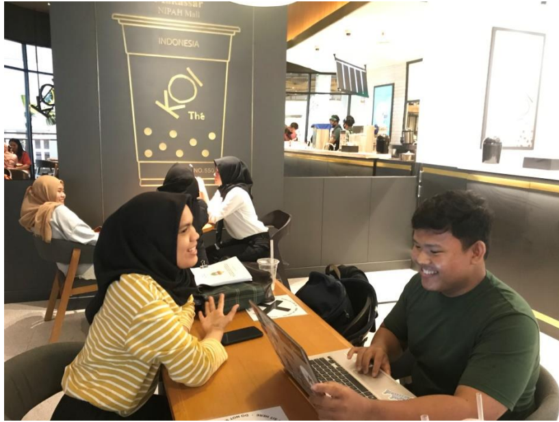
Gambar 28. Proses pengumpulan data bersama informan