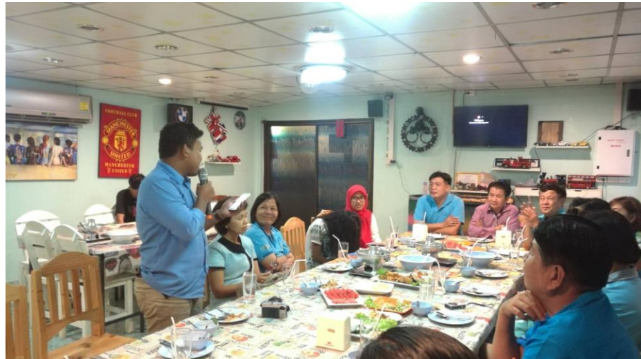
Gambar 21. Sambutan perpisahan setelah menyelesaikan program