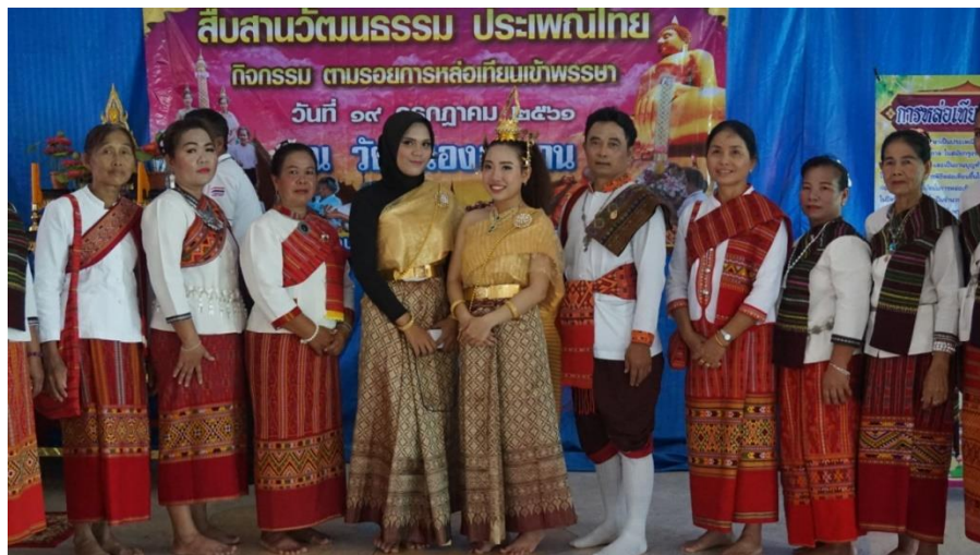
Gambar 17. Informan yang memakai baju adat Negara Thailand