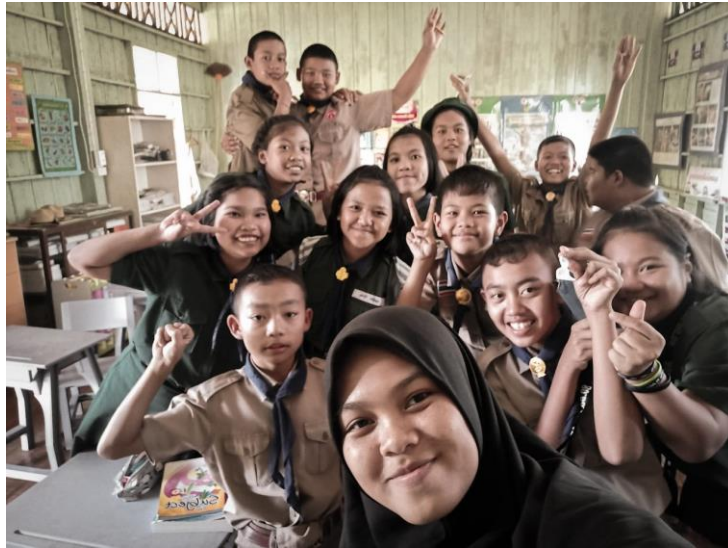
Gambar 12. Informan bersama murid- muridnya disaat jam istirahat