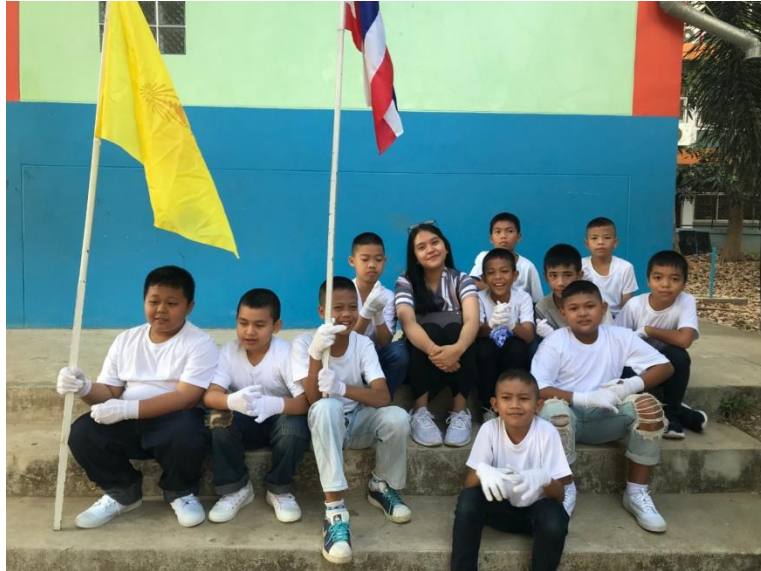
Gambar 8. Informan bersama murid- muridnya