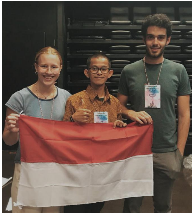
Gambar 15. Informan dengan peserta program dari negara lain