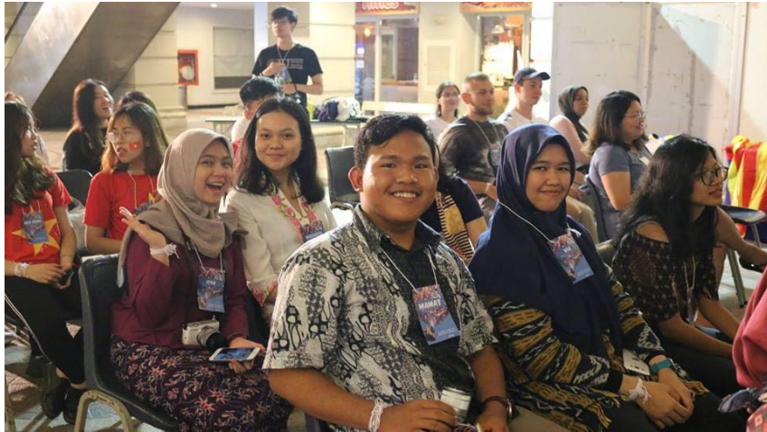
Gambar 26. Memperkenalkan budaya Indonesia kepada peserta dari negara lain