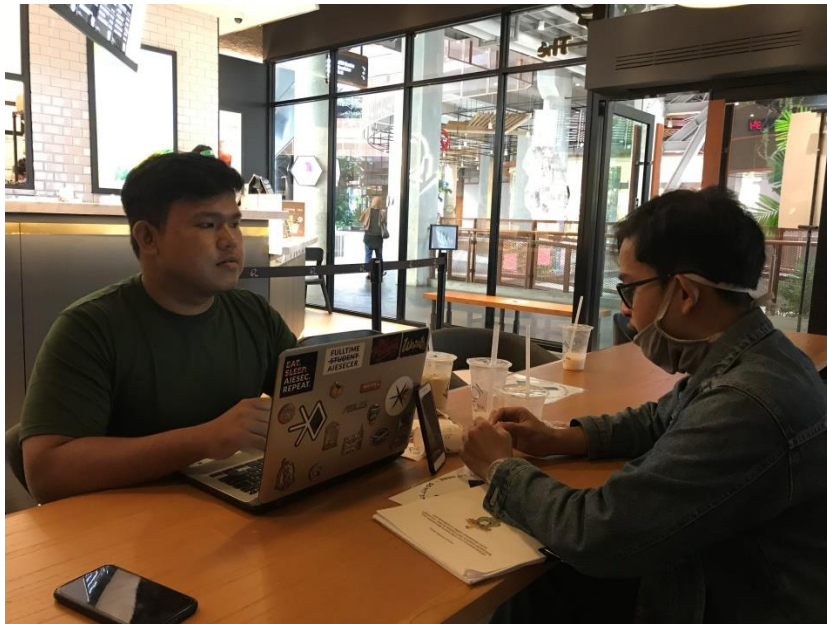
Gambar 29. Proses pengumpulan data bersama informan