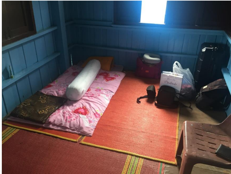
Gambar 22. Kondisi kamar peserta program Global Volunteer