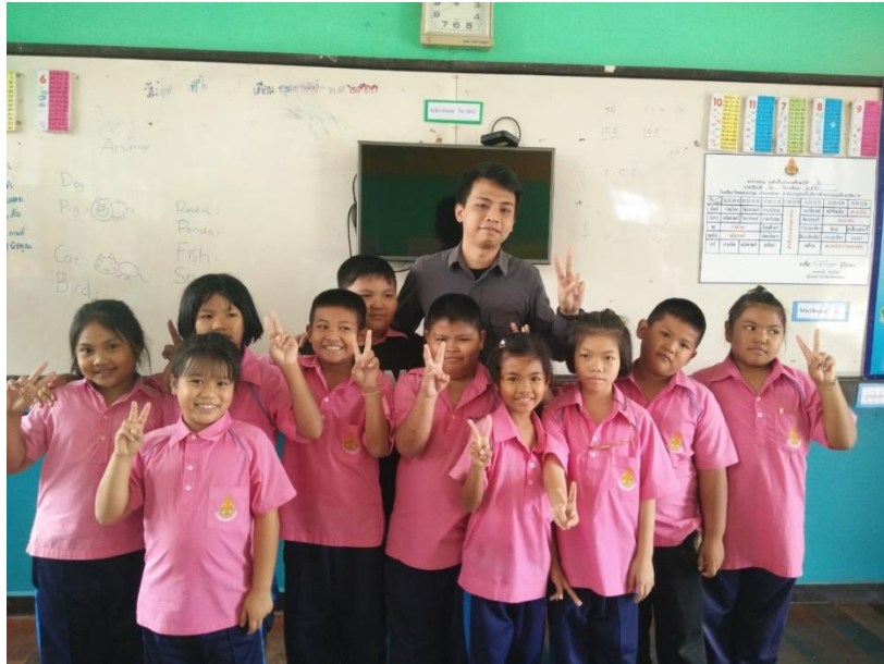
Gambar 14. Informan dengan murid- muridnya