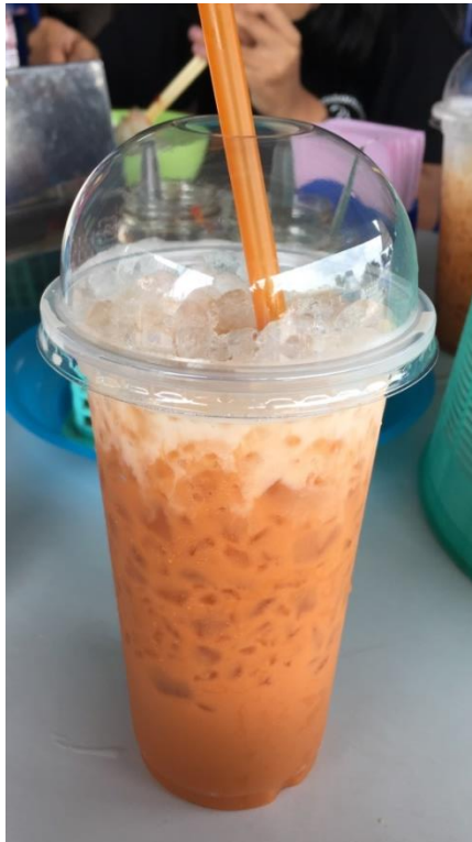
Gambar 23. Minuman Thai tea khas Thailand