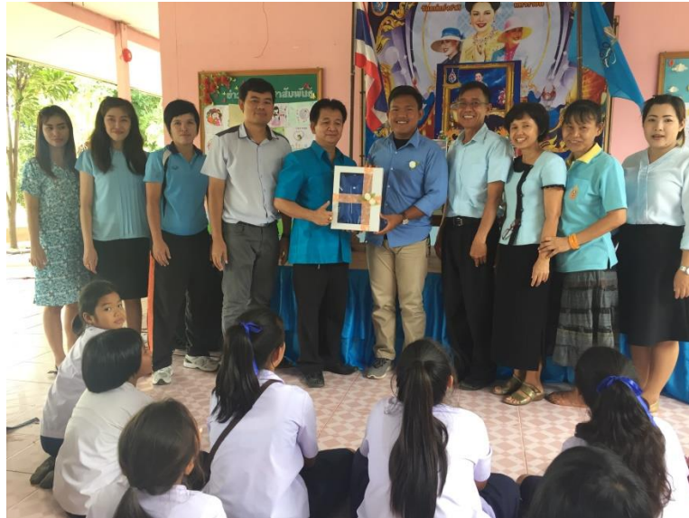
Gambar 20. Memperingati hari lahirnya ratu di Negara Thailand