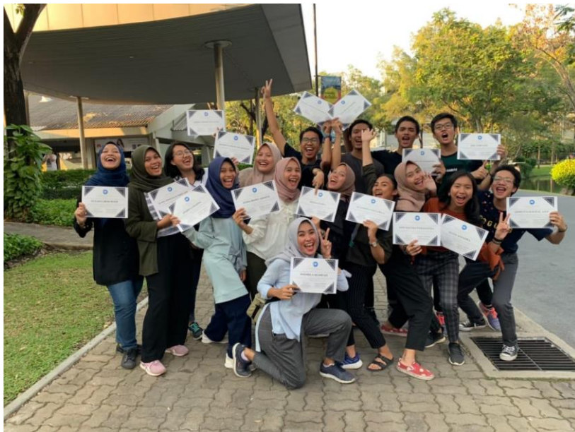
Gambar 13. Penerimaan sertifikat setelah program selesai