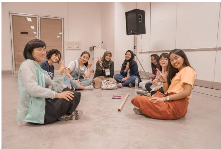
Gambar 10. Persiapan sebelum berangkat ke provinsi masing- masing