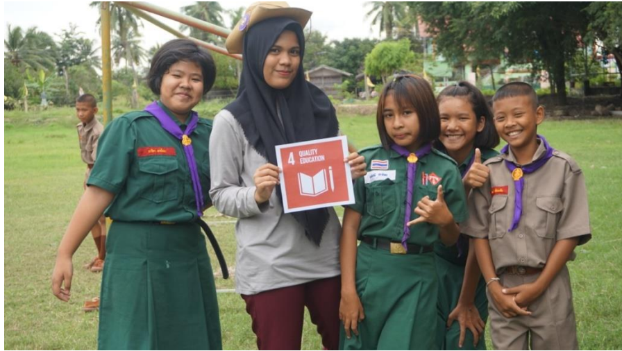
Gambar 18. Sosialisasi SDG's kepada murid- murid