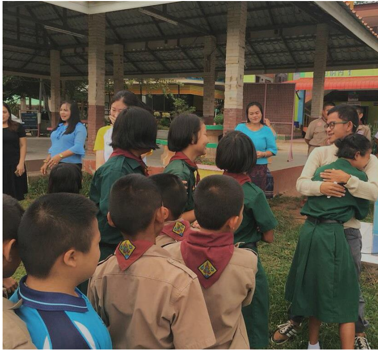
Gambar 16. Perpisahan dengan guru dan murid setelah menyelesaikan program