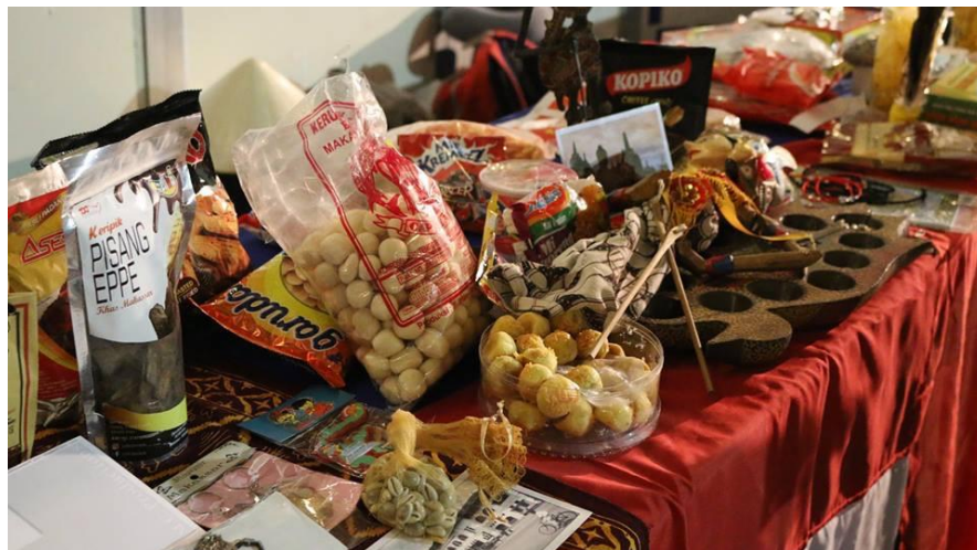
Gambar 25. Pameran kebudayaan peserta program di Assumption University