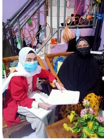
wawancara dengan informan A4