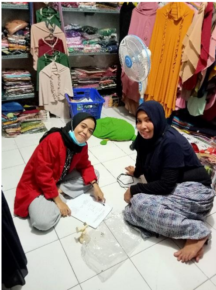
Wawancara dengan informan A5