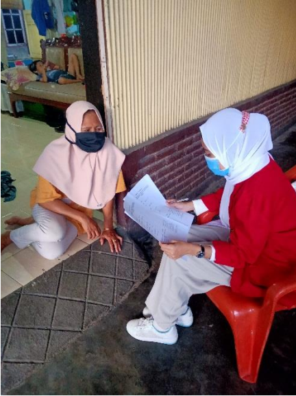
Wawancara dengan informan A3