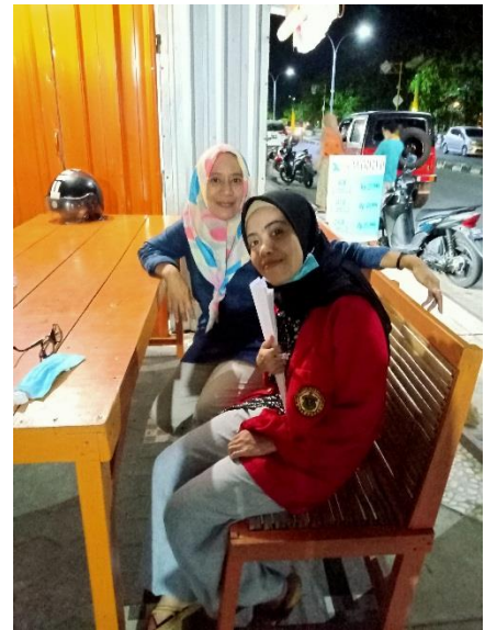
Wawancara dengan informan A6