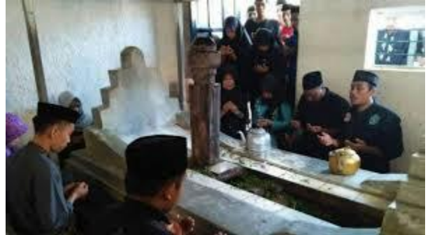
Makam Imam Lapeo