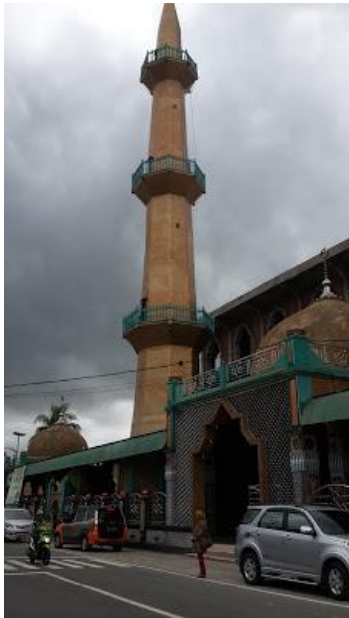
Masjid Imam Lapeo