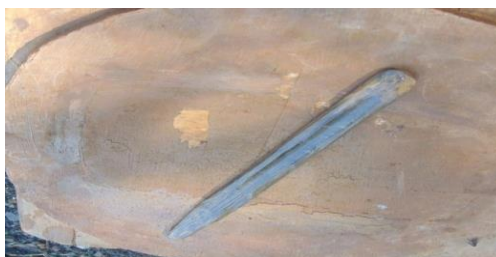
Foto 3. Alat Tradisional Pembuatan Gerabah Peralatan Bambu Komparatif