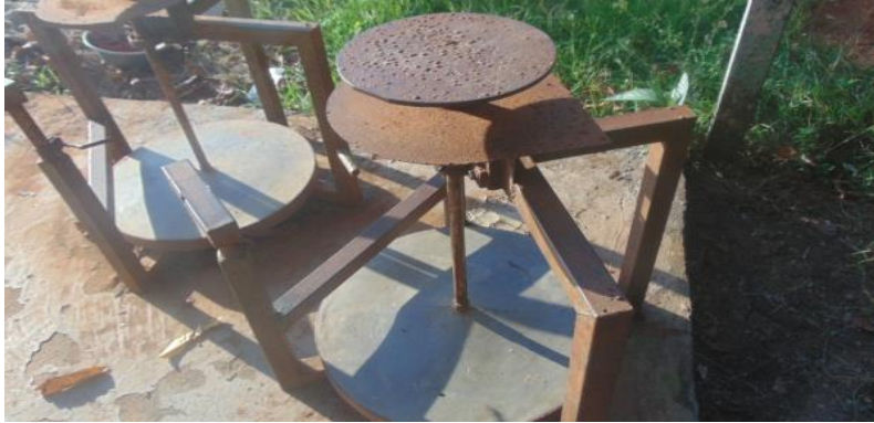
Foto 7. Roda Putar, Alat Modern dalam Membuat Gerabah (Dokumentasi: Martinus, 2021)