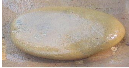
Foto 5. Alat Tradisional Pembuatan Gerabah Peralatan Batu Komparatif