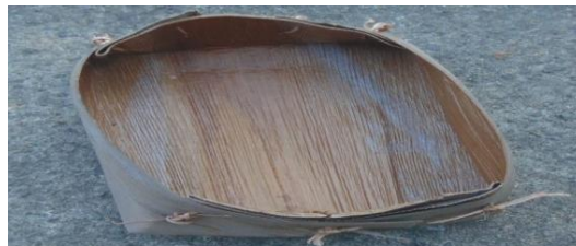
Foto 4. Alat Tradisional Pembuatan Gerabah Peralatan kulit Pelepah Komparatif (Dokumentasi: Martinus, 2021)