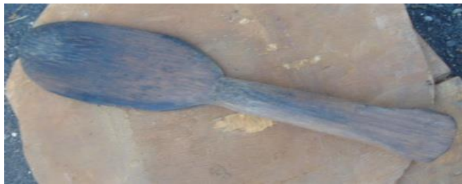
Foto 2. Alat Tradisional Pembuatan Gerabah Peralatan Kayu Besi Komparatif

perbandingan pembuatannya seperti situs Tanjung Ria, Situs Asei, Situs Ayapo, Situs Ifar Besar, Situs Marwari-Urang dan Situs Tutari. Teknologi pembuatan dilihat melalui artefak gerabah konsentrasi situs-situs sama komparatif. Tetapi gerabah pada masa lalu hampir sama dengan gerabah masa kini. Teknik tatap, menggunakan alat dari kayu besi yang tebal seperti alat sendok makan dilihat gambar dibawah ini.