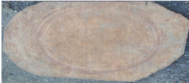
Foto 6. Alat Tradisional Pembuatan Gerabah Peralatan Papan Persegi Komparatif